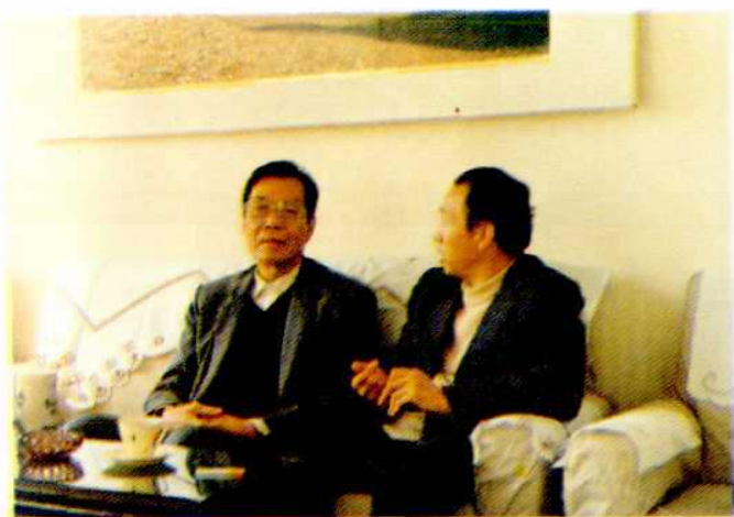
省分公司古汉宏总经理 (左) 到沧州检查指导工作