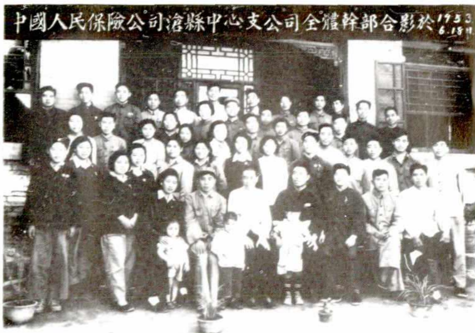
一九五三年滄縣中心支公司全體幹部合影