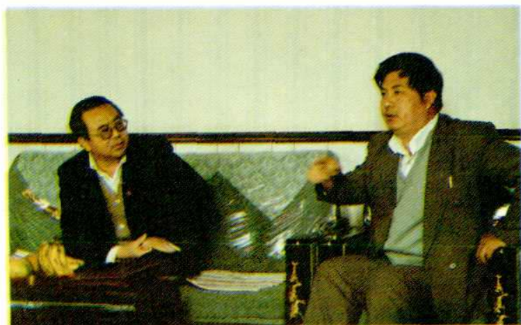
省分公司程会场 副总经理(左)到黄 骅检查指导工作