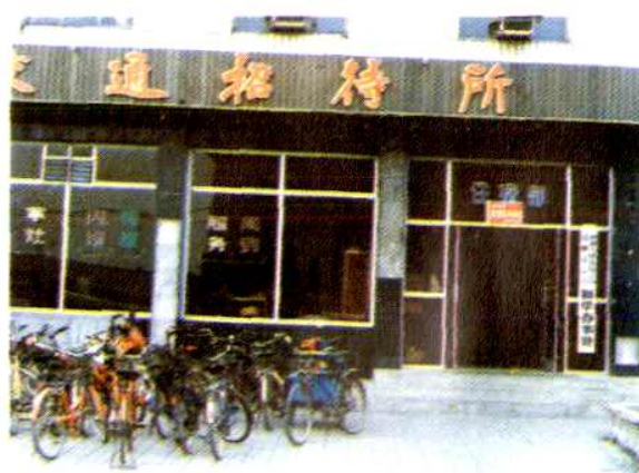
沧州中心支公司新华办事处办公地点