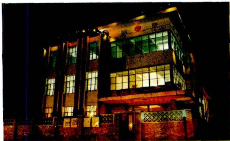
黄骅市支公司办公楼