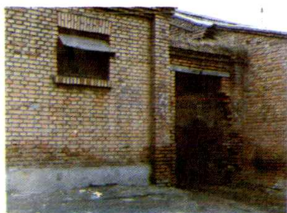
五十年代沧县中心支公司办公地点——文昌街