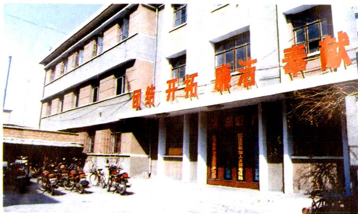
沧州中心支公司办公楼