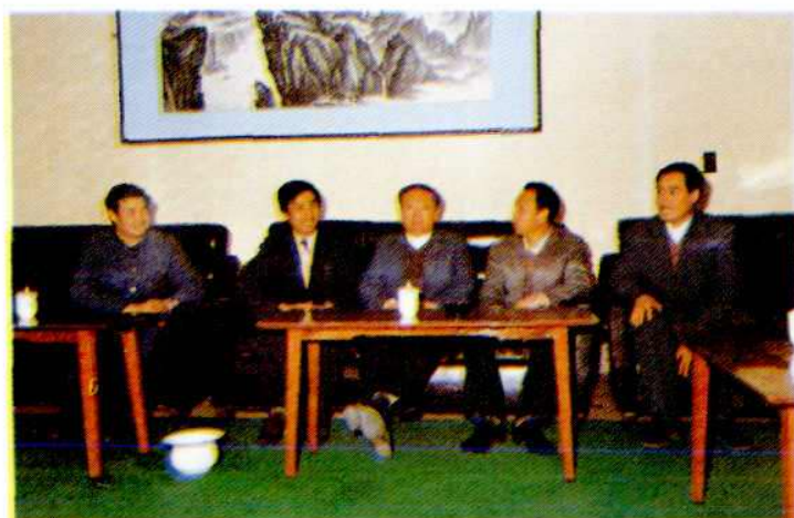
沧州市人民政府高 尧隆副市长(中)听取 中心支公司领导成员工 作汇报