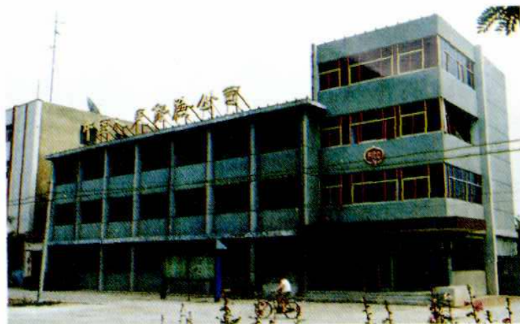
泊头市支公司办公楼