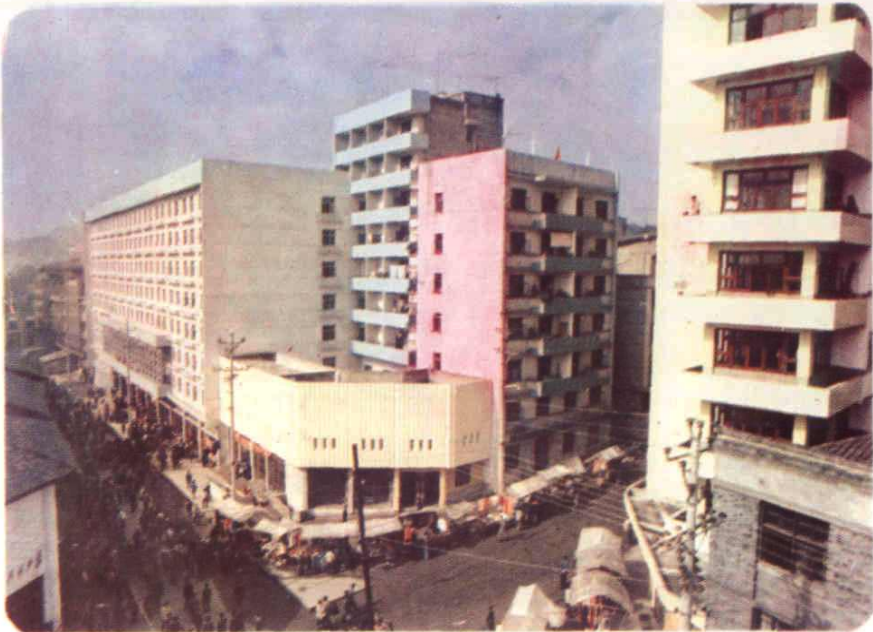
渠江镇八一街楼房鳞次栉比