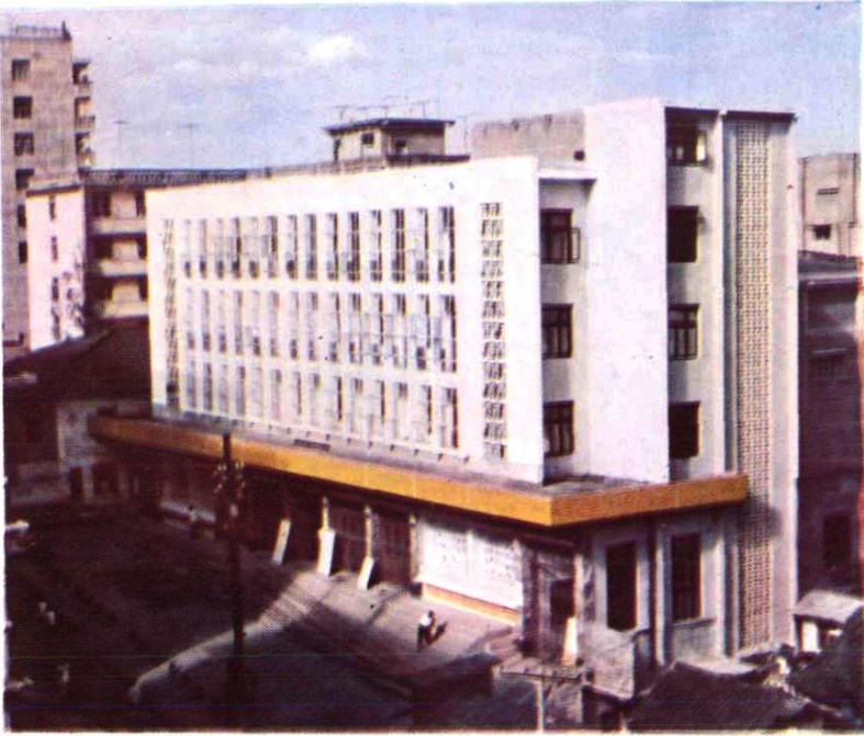
新建的渠县工人俱乐部侧面