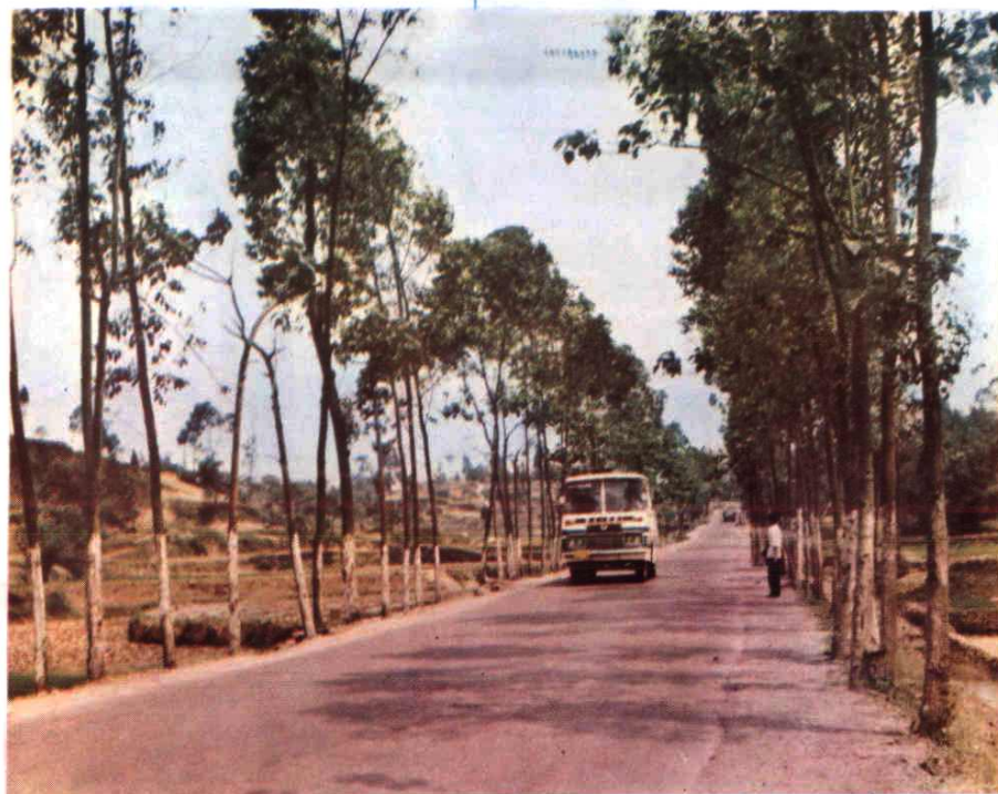
川鄂公路与县、区、乡公路相连，乡乡通汽车