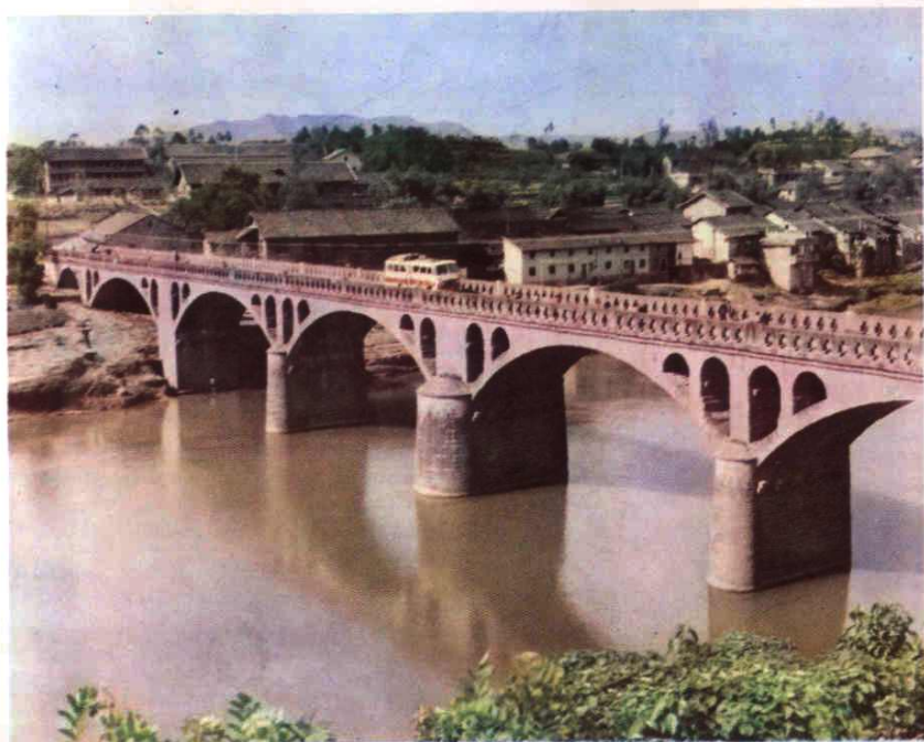
流江河上的静边公路大桥