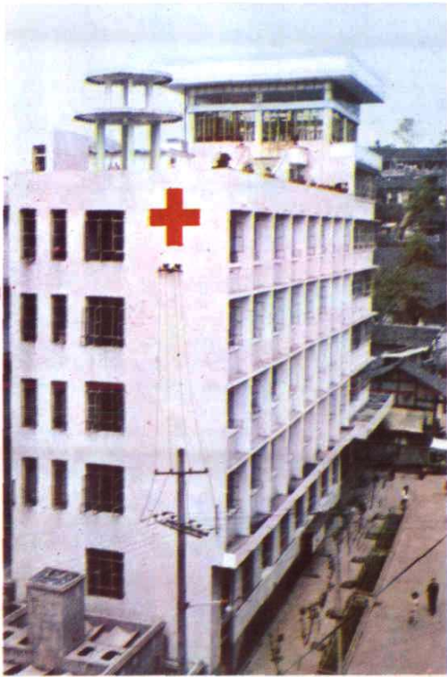
渠县人民医院门诊大楼一侧