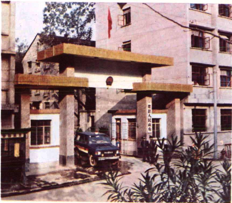
渠县人民政府大门一瞥