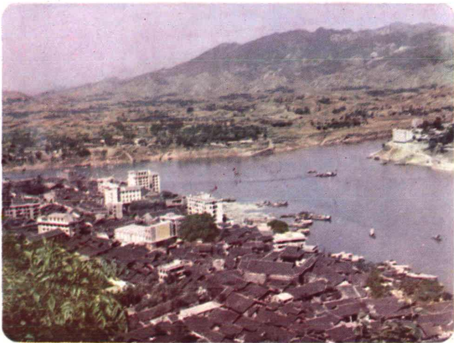
素有“小重庆”之称的三汇镇一瞥