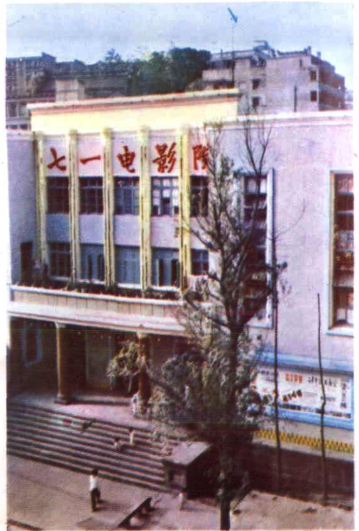
渠县七一电影院一角