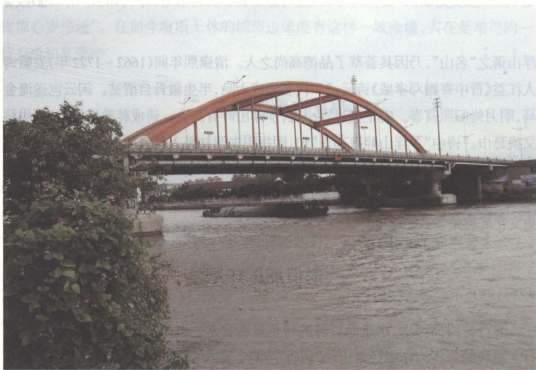
渔行赵公桥(现名迎江桥)

有水就有河，有河就有桥。渔行村有砖桥、板桥等多座桥梁。其中最古老的则是横跨在渔行村南边新通扬运河上的迎江桥。它的前身是拥有260多年历史的赵公桥，古称凤尾桥，是古渔行村的标志性建筑。清乾隆十八年(1753年)，知州赵天爵捐俸倡建三孔石拱桥，以赵公姓名之。因原桥甚长，桥建成后两边建有五座“土地”庙，