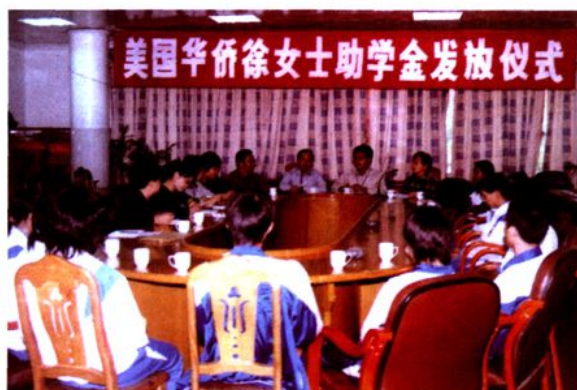
美国华侨徐女士资助云中贫困学生读书