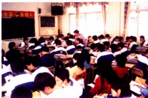
小组合作学习公开课