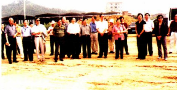
全国人大香港区代表到新校区视察