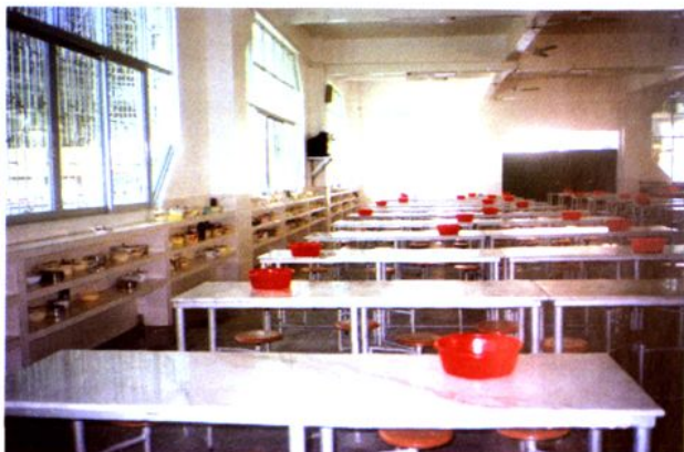
寬敞、明亮、整潔的學生飯堂