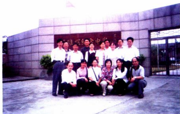
云中市级课题“主体参与型”课题组成员到花都邝维煜纪念中学参观学习