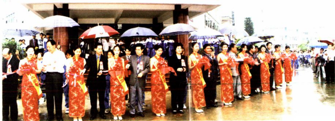
各级领导、各界嘉宾为云中联谊楼落成剪彩