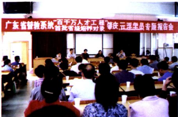
广东省督教系统“百千万人才工程”首批省级培养对象肇庆、云浮学员专题报告会在云中举行

2003年4月，省“百千万人才工程”首批省级培养对象肇庆、云浮学员专题报告会在云中举行