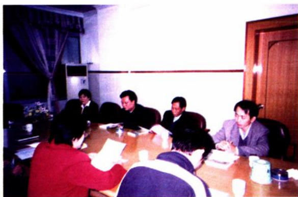
市专家组对云中市级重点课题“主体参与型”教学模式进行评估