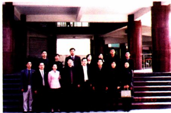
团中央少工委的领导莅临云中指导工作