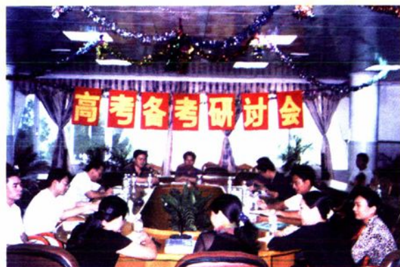
云中重视高考备考工作