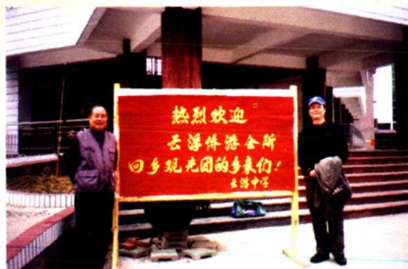
云浮侨港会所乡亲到云中参观