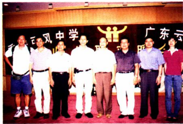
香港可风中学到云中联谊