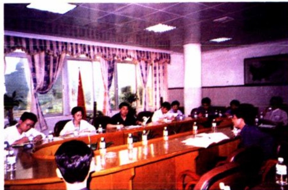
肇庆中学老师来云中交流教学经验