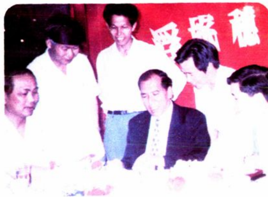
1994年，校友、广州市常务副市长陈开枝与母校80周年校庆等委员会部分成员在一起