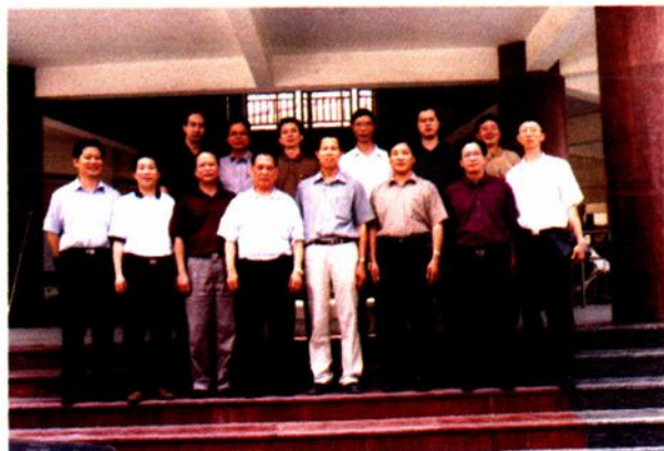
省委组织部“固本强基”检查团到云中检查工作