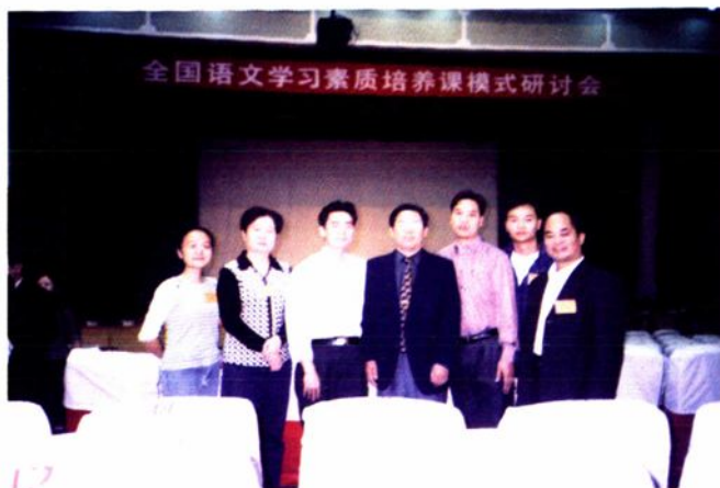
云中国家级课题“语文合作式学习方法的指导”课题组部分成员参加在广西师大举行的全国语文学习素质培养课模式研讨会