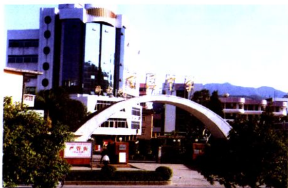
1994年落成的學校大門