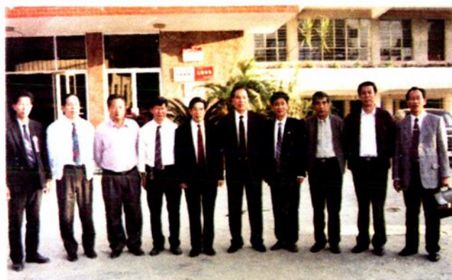
1994年11月7日，省委常委、副省长卢钟鹤(左五)到云中视察。左起：朱东海、温耀深、钟爱碧、叶文鉴、卢钟鹤、吴驹贤、廖钦源、陈锦锋、梁清林、陈仲凤