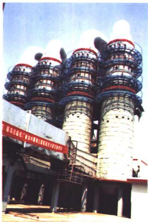
国家“九五”科技攻关和国家力公司 科技示范工程——水膜除尘器脱硫装置