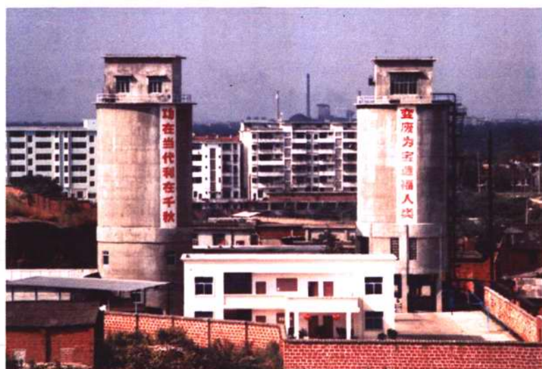
粉煤灰综合利用项目年产二〇万吨 的商品粉煤灰处理系统