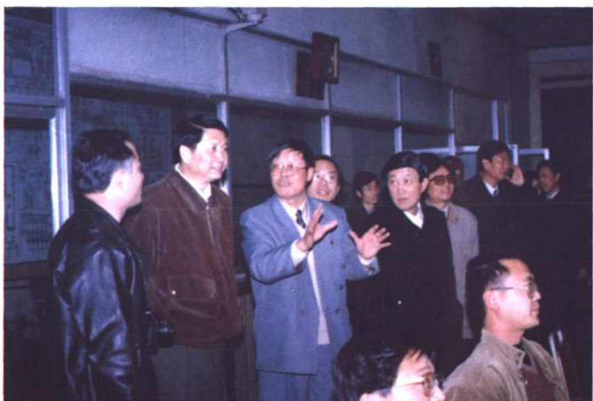
1997年5月16日江西省省委书记记舒惠国（左二）来厂视察