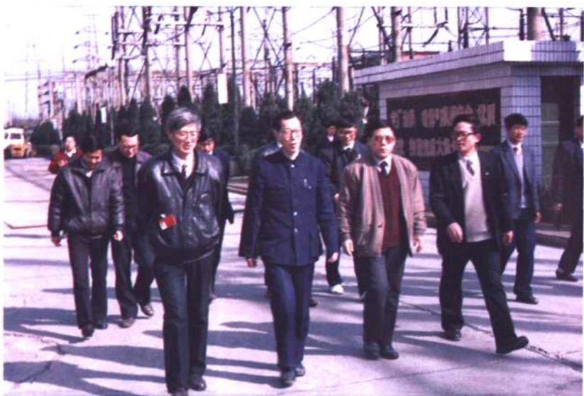
1994年3月10日，江西省常务副省长舒圣佑（前左二）来厂视察