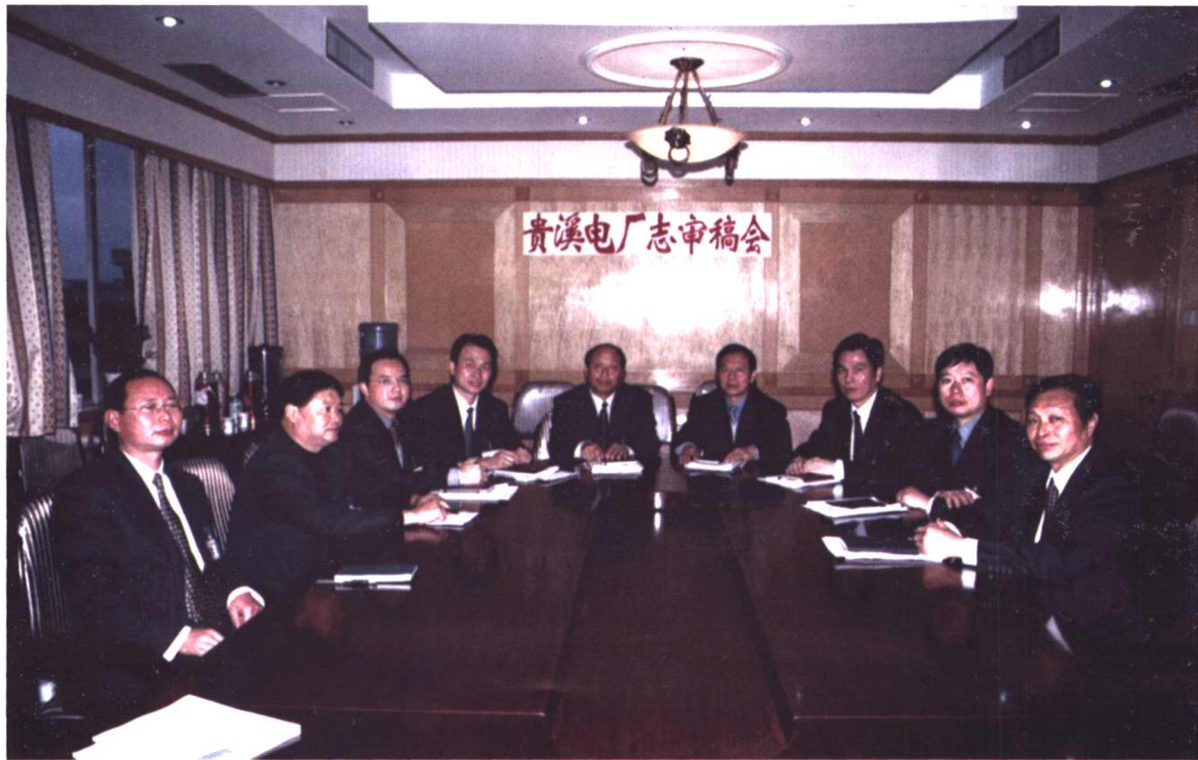
团结、进取的贵溪电厂领导班子