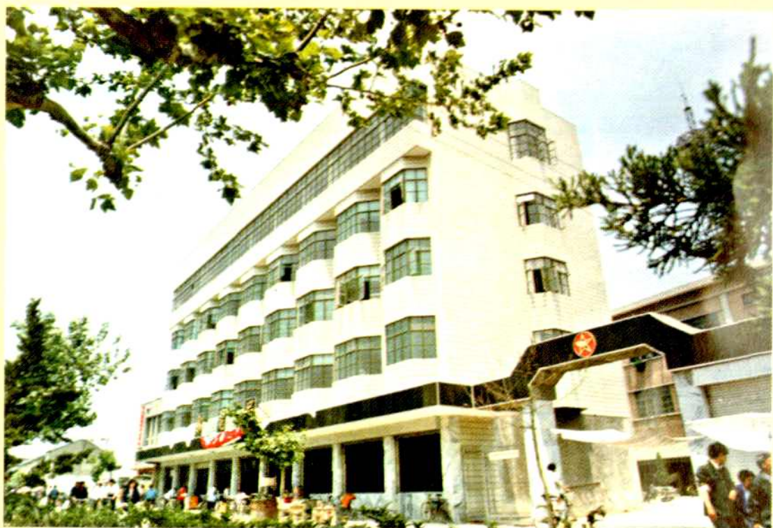
建于90年代的邮政楼