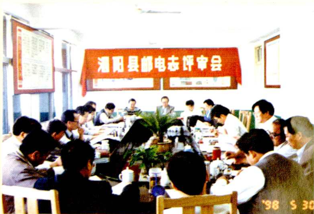
泗阳县邮电志评审会议会场