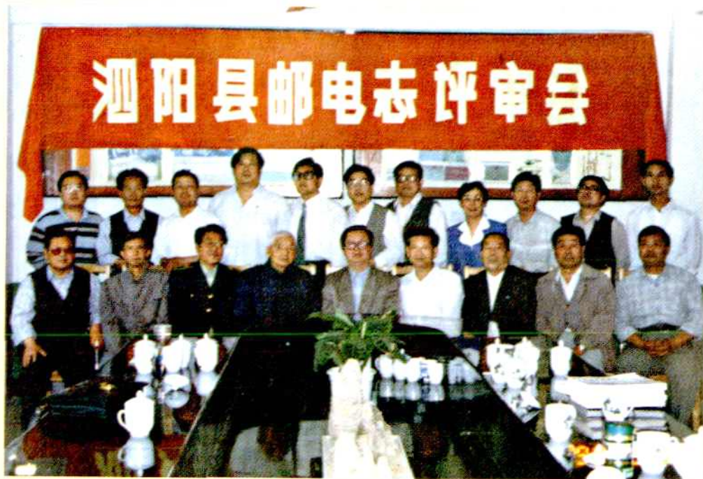
参加泗阳县邮电志评审会议的全体人员