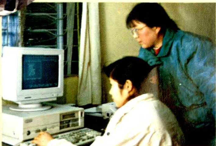
“112 查障台”技术 人员在测试 ▶