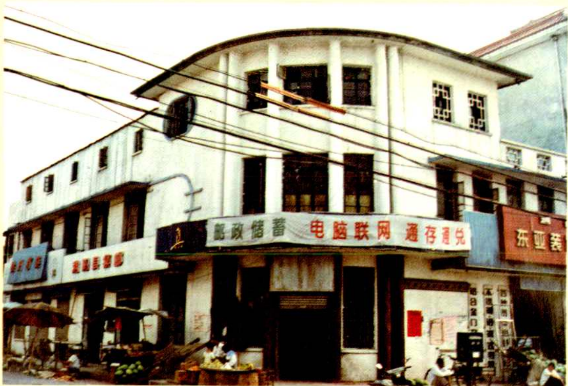
建于70年代的邮政楼