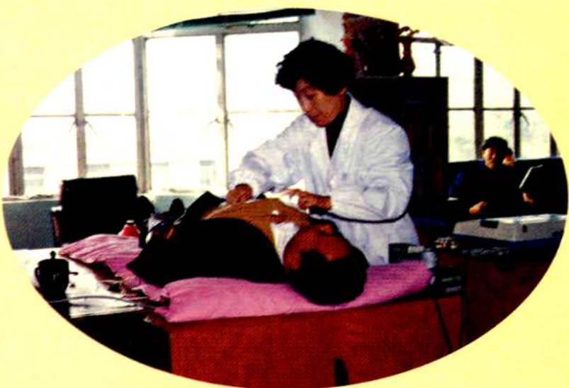
对职工进行健康体检 ▶