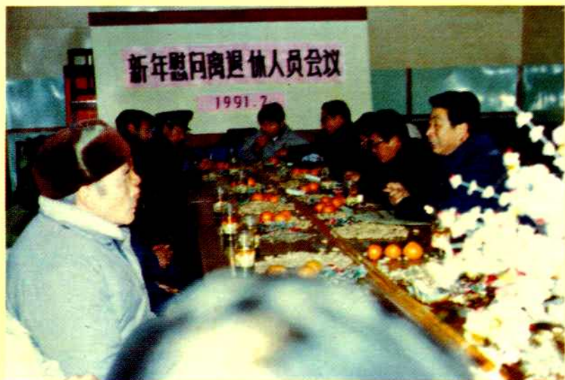
◀ 召开离退休 人员座谈会