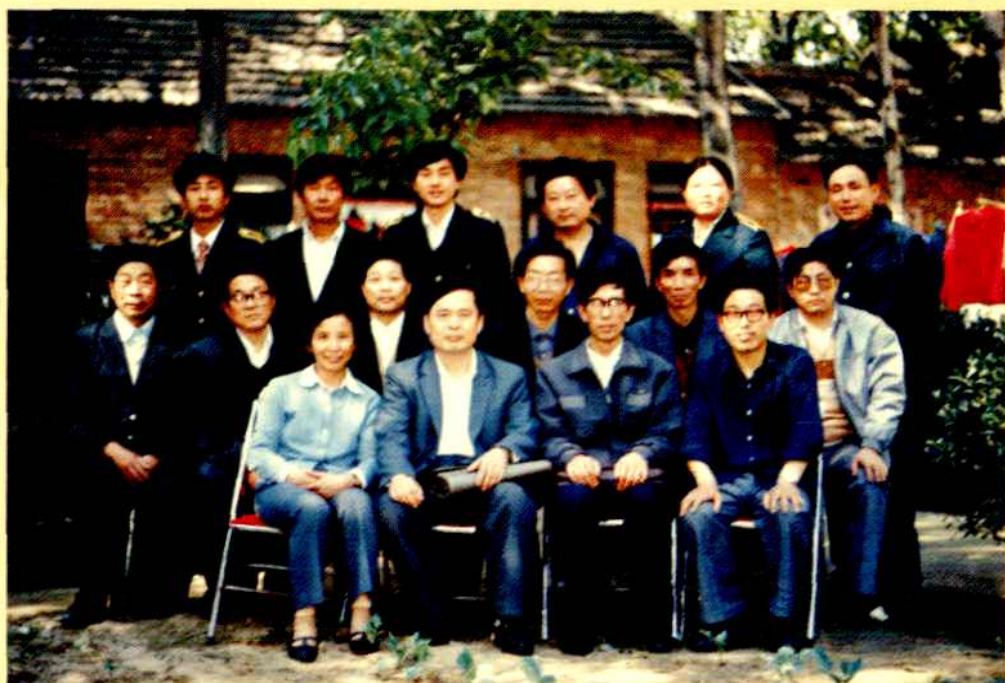
省局张秉银局长视察新元邮电支局