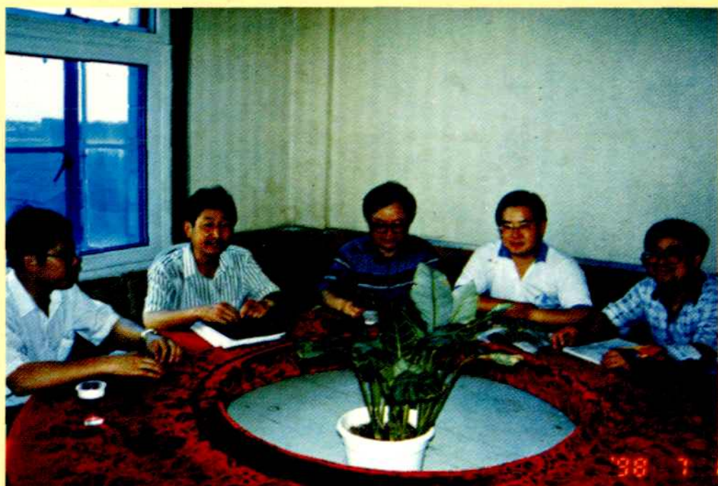
县局领导班子成员