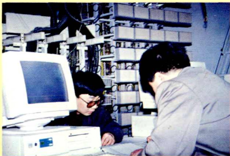
◀ 洋河镇 3000 门程 控交换机在安装测试