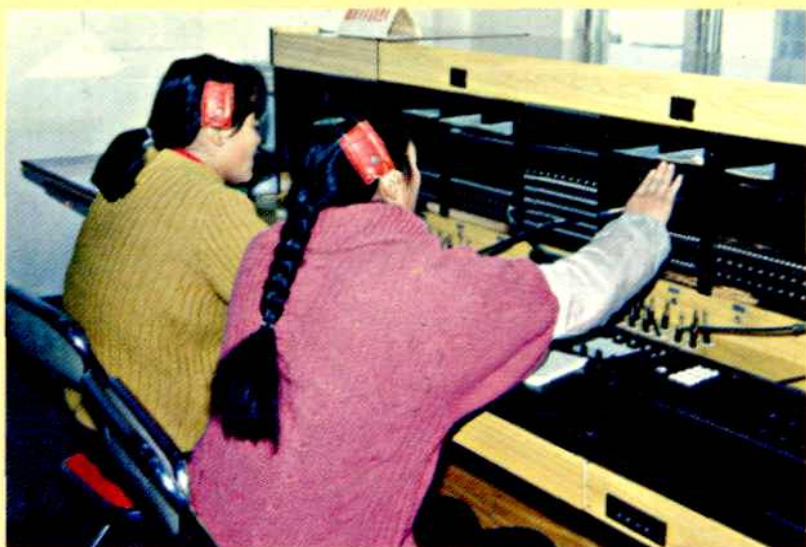
◀ 长途话务员在工作