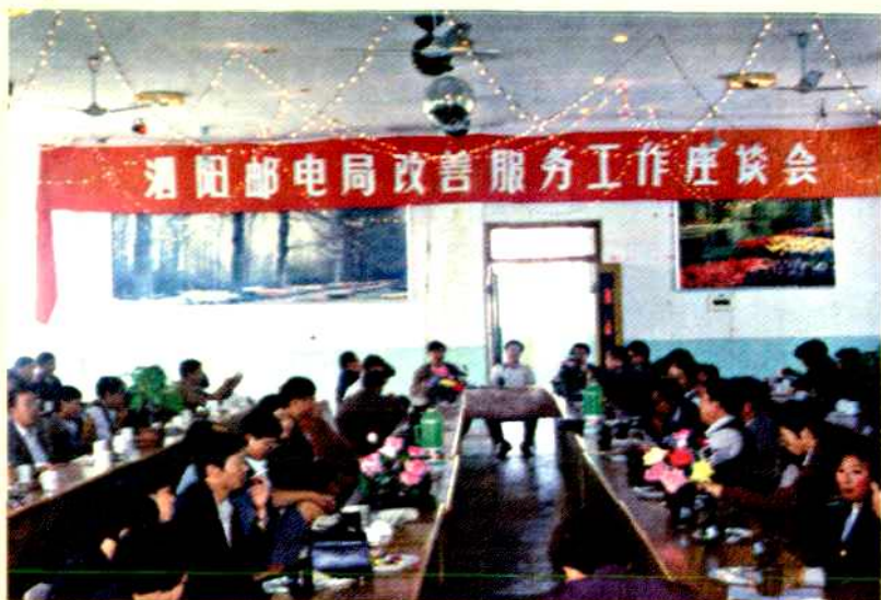
召开由社会各界人士参加的服务工作座谈会 ▶