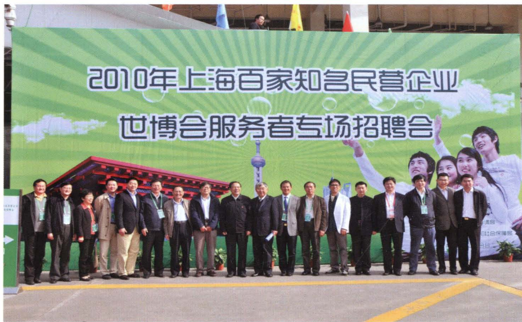
2010年11月13日，上海市工商联举办上海百家知名民营企业世博会服务者专场招聘会。