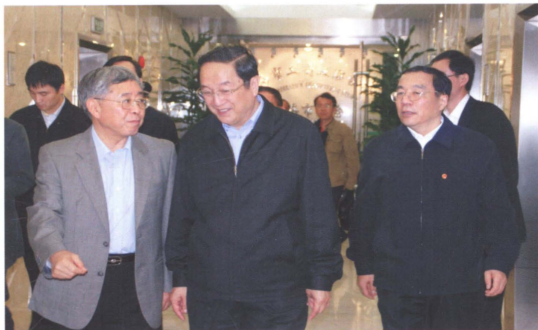
2007年10月31日，中共上海市委书记俞正声在市工商联调研。市委常委、市委统战部部长杨晓渡（右一），上海市政协副主席、市工商联会长王新奎（左一）陪同。