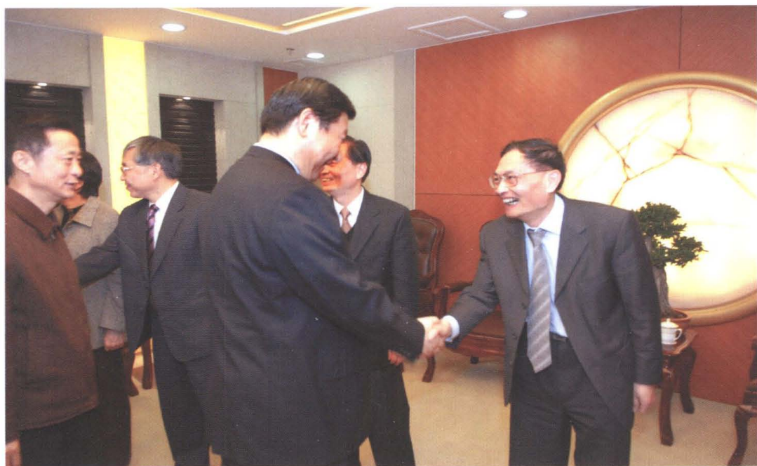
2007年4月2日，中共上海市委书记习近平在上海市民主党派市委、市工商联调研时与市工商联党组书记、副会长季晓东握手。