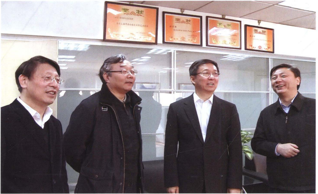
2013年1月10日，中共上海市委书记韩正走访市工商联。市委常委、市委统战部部长沙海林（左一），市工商联主席王志雄（左二），市委统战部副部长、市工商联党组书记、常务副主席赵福禧（右一）陪同。