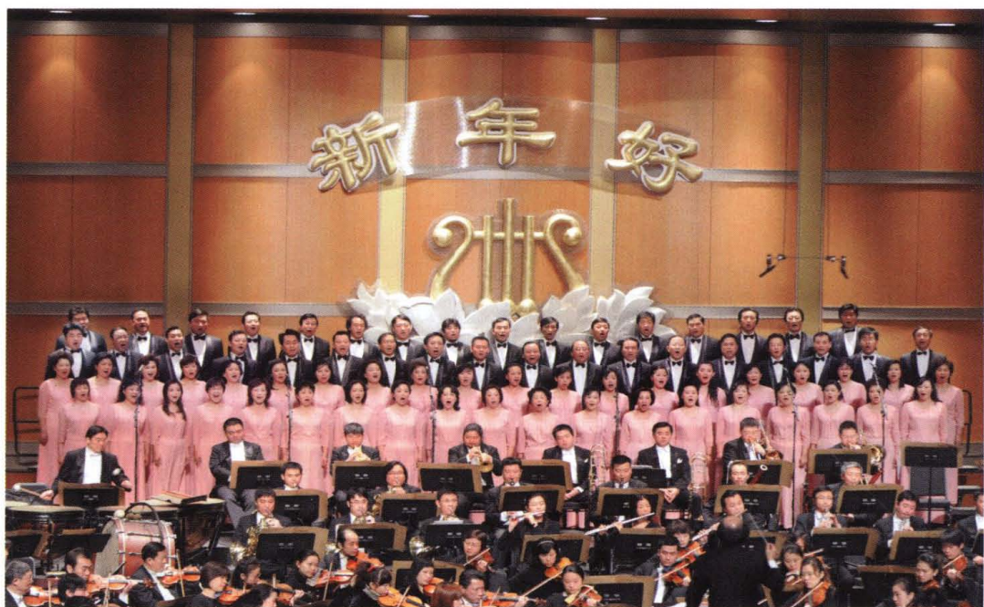
2009年1月1日，上海市（工商联）民营企业家协会合唱团参演上海市各界人士新年音乐会。