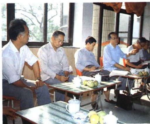
与会代表在评审会议上