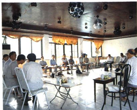
《资源县财政志》评审会场