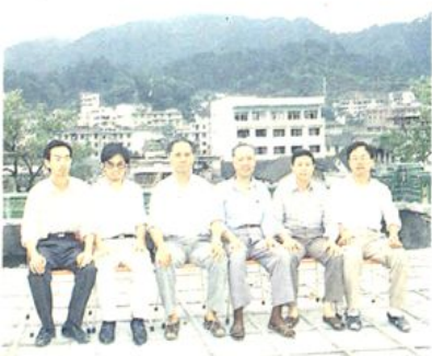
参加《资源县财政志》编写及其地县有关领导合影