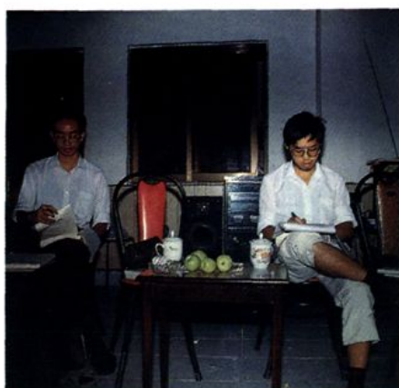
本志主编(左) 副主编(右)