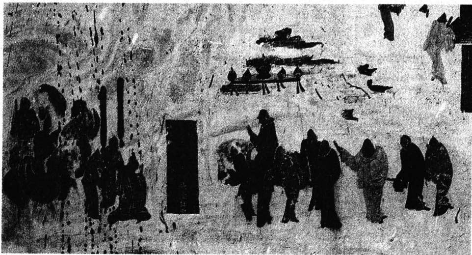
敦煌壁画中的张骞出使西域图

张骞,男,汉族,生年不详,汉中城固(今陕西城固县)人。公元前114年去世。初任郎官,默默无闻。汉武帝建元二年(公元前139年),应募出使大月氏,于次年率领堂邑父等100余人西行,联络大月氏共同抗击匈奴。途中被匈奴抓住,留居十年。匈奴单于赐予他妻子,并生了子女,而张骞持汉节不失。元朔二年(公元前127年),单于死,国内乱,张骞与胡妻及甘父逃离匈奴,步行数十天,经过大宛、康居,到达大月氏。次年,返回长安,因功升官为大中大夫。刻像与凌烟阁后随大将军卫青出击匈奴,获得胜利,被封为博望