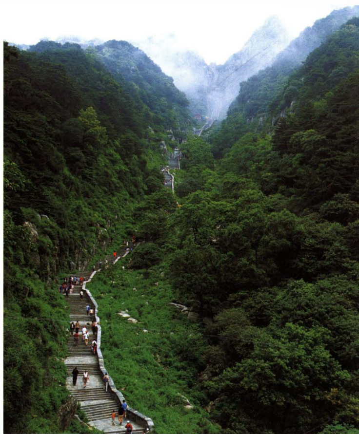
世界文化与自然 遗产——泰山