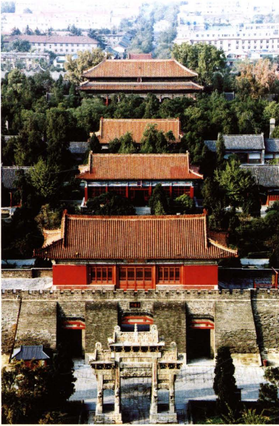
泰山岱庙