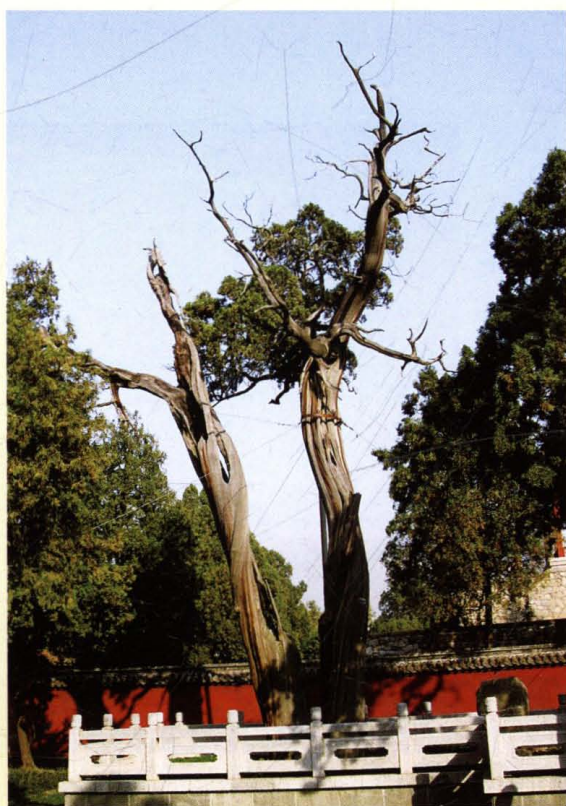
泰山岱庙“双干连理” 柏