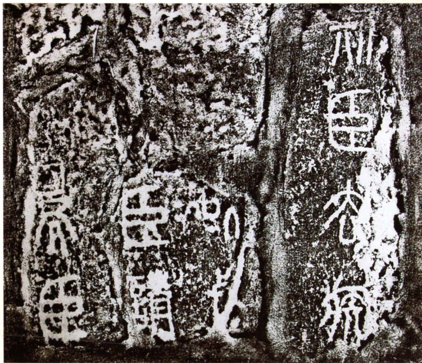
泰山岱庙秦刻石拓片