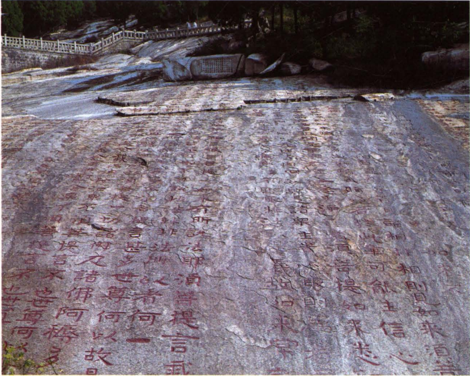
泰山经石峪北齐刻经