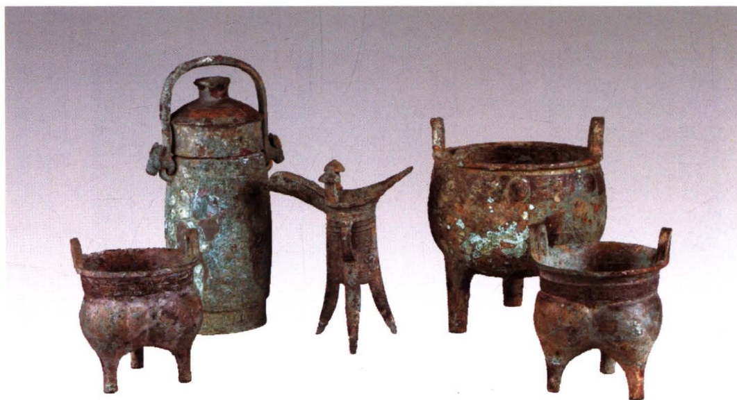
新泰出土春秋叔氏青铜器