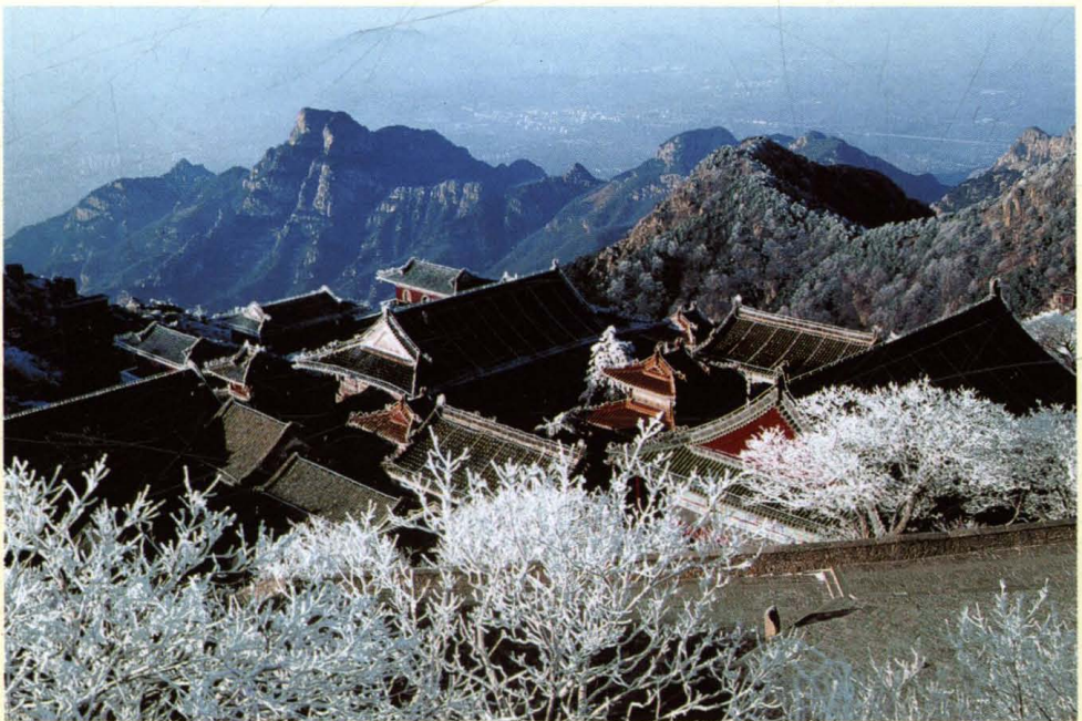
泰山碧霞祠