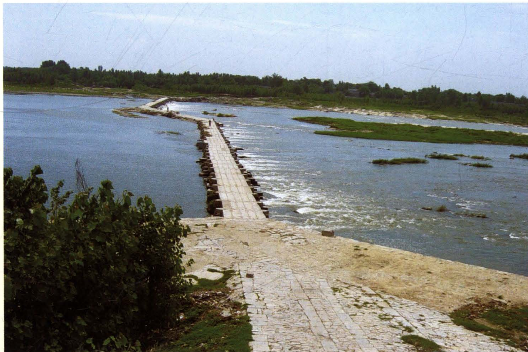
大汶河明清石桥