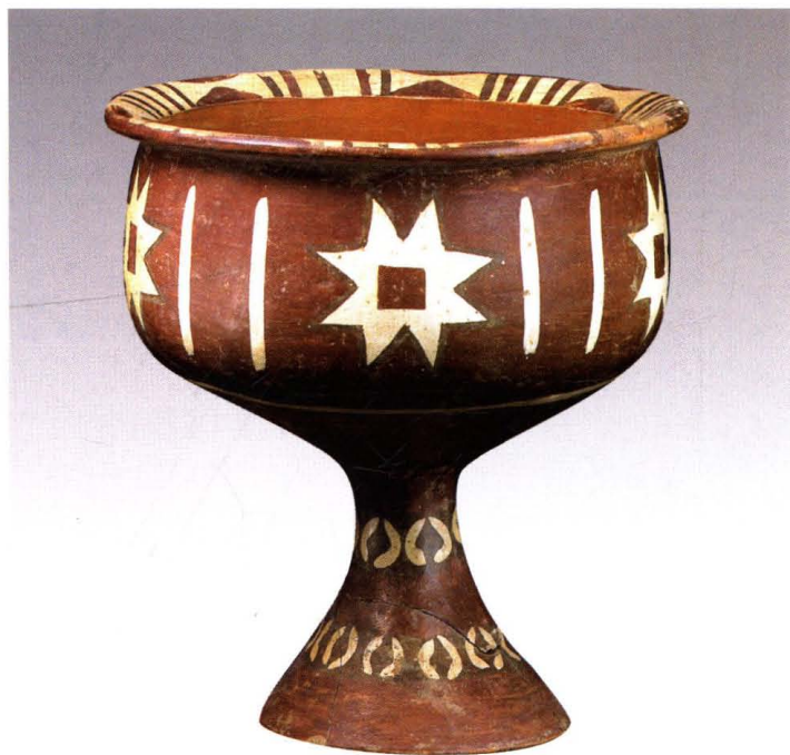
大汶口遗址出土彩陶豆