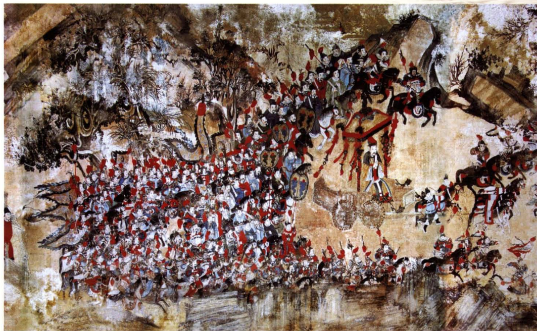
泰山岱庙天贶殿壁画《泰山神启蛰回銮图》局部