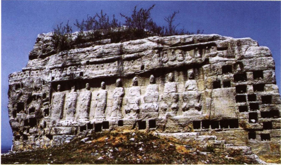
东平司里山摩崖造像