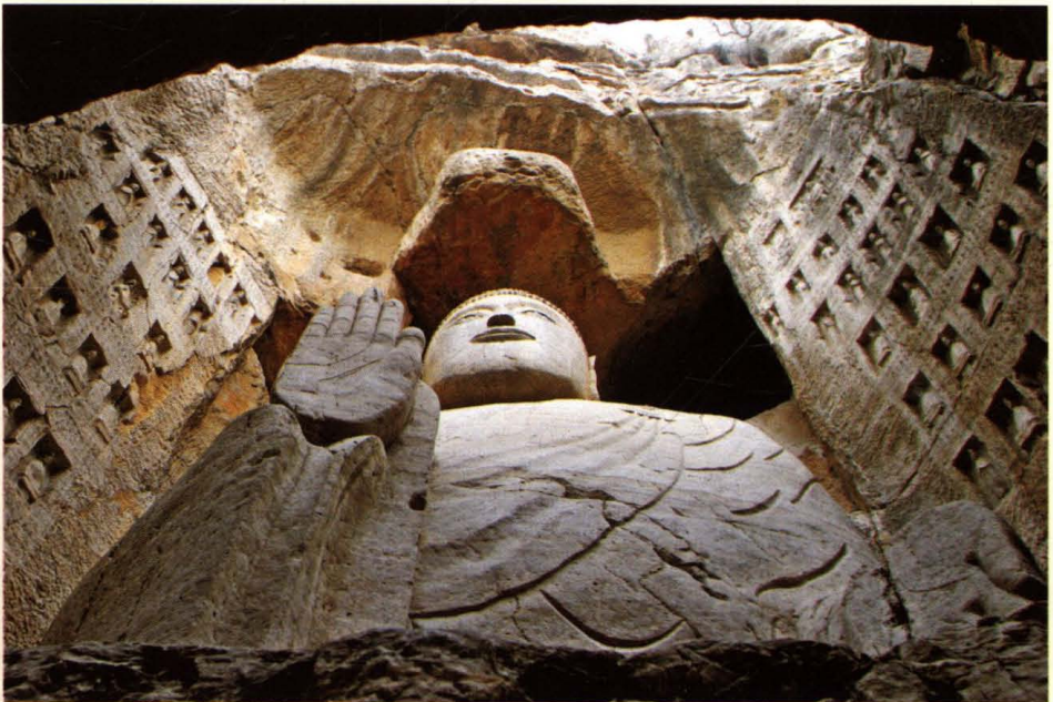
东平白佛山隋代石窟造像