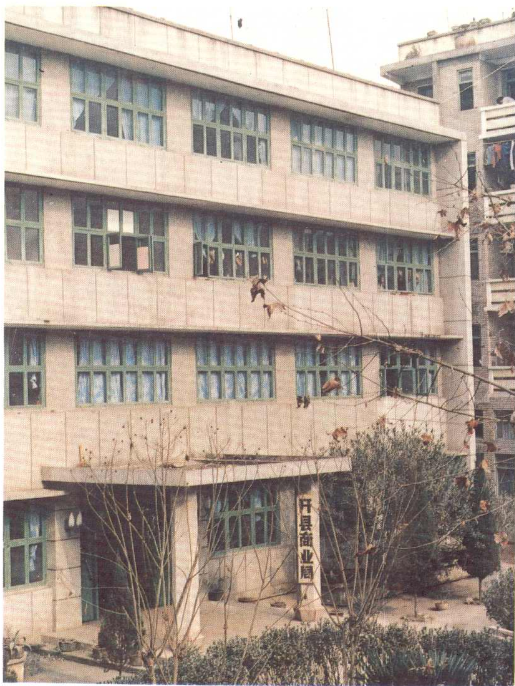
开县商业局办公大楼