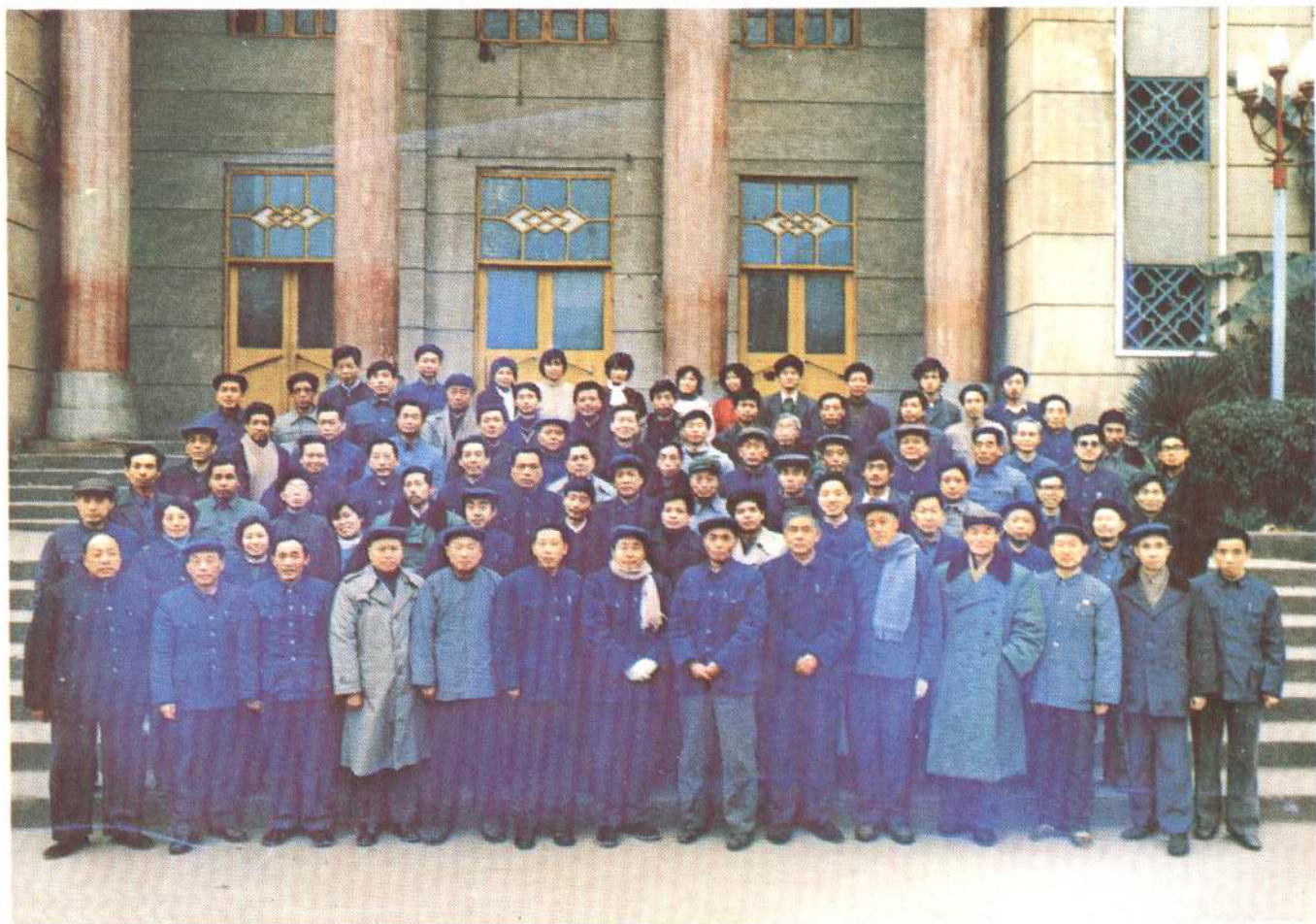
《开县商业志》会审工作会议全体代表、工作人员合影