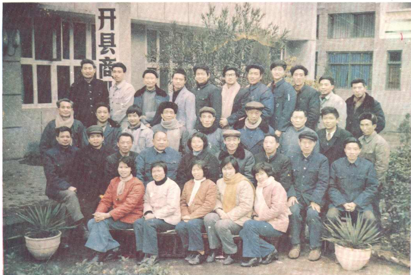
开县商业局 1985 年全体工作人员合影