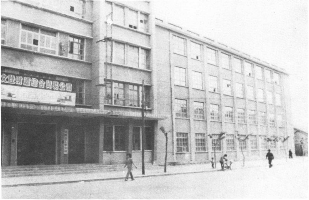
文登县工业公司办公大楼