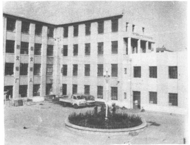
文登县印刷厂一角