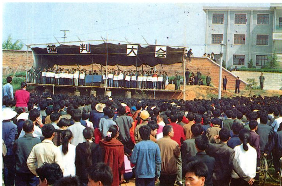
“严打”期间捕判大会会场一角