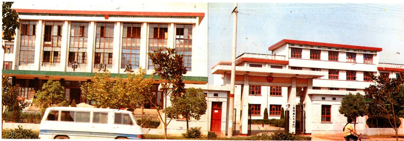
岳阳县人民法院机关大院