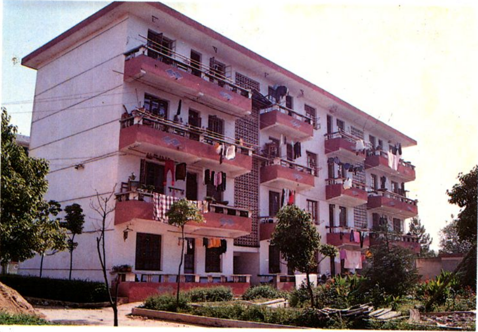
岳阳县人民法院机关宿舍楼第一栋