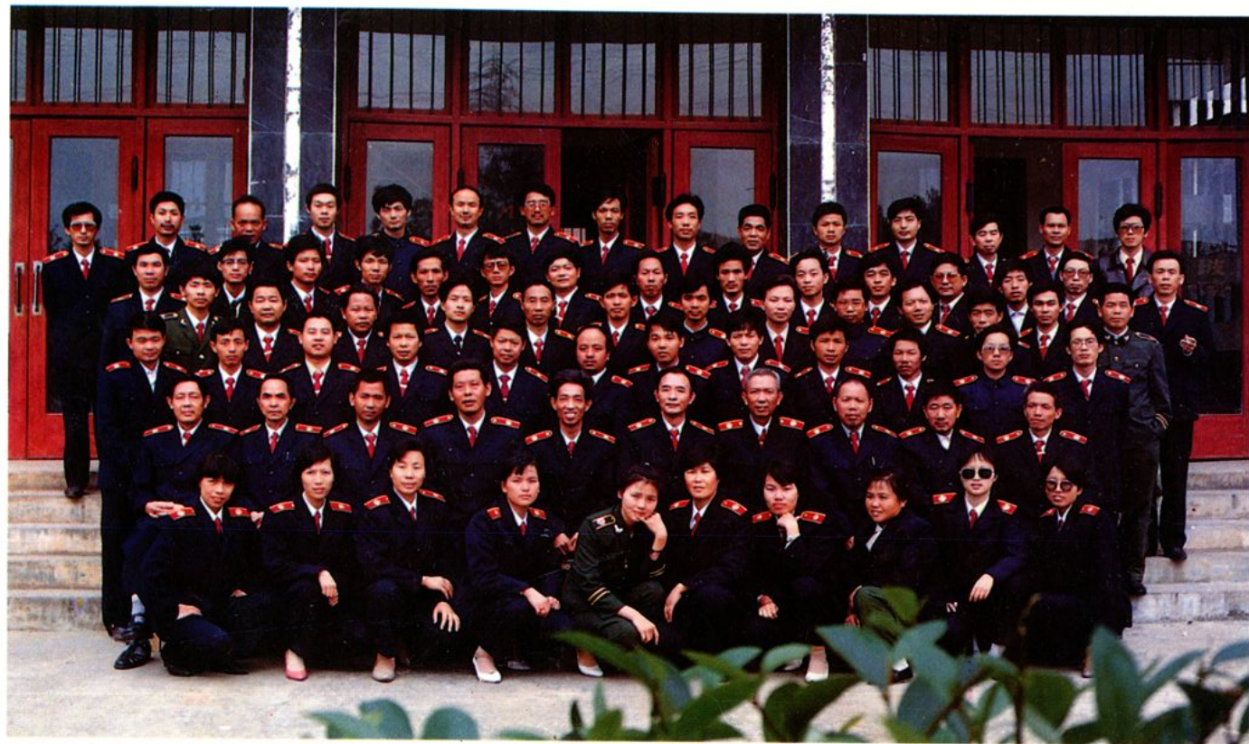
岳阳县人民法院全体干警合影