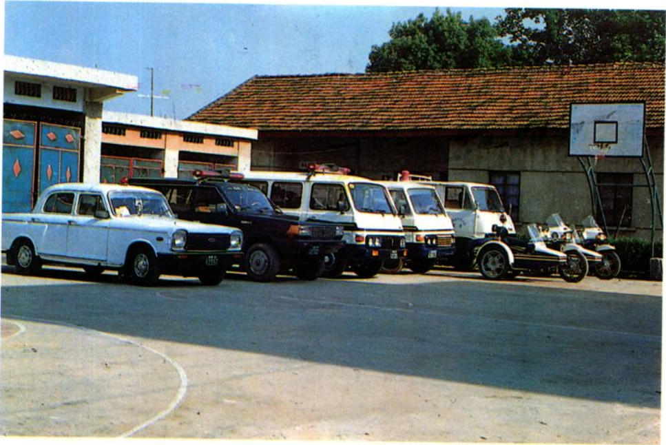
县人民法院机关办案交通工具