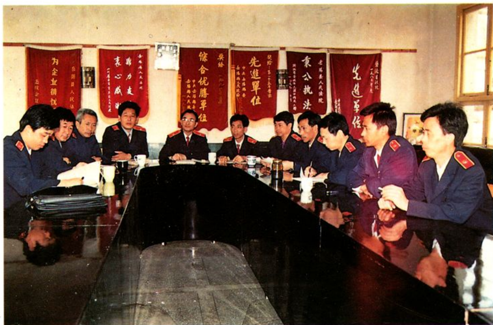
审判委员会讨论案件