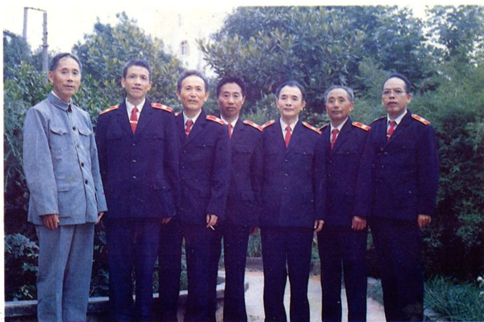
法院志编纂工作座谈会老同志合影