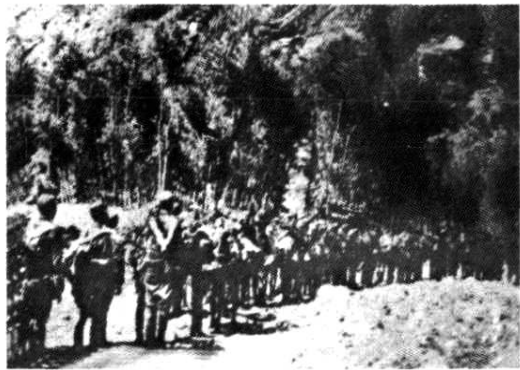
八路军115师开赴鲁南抗日前线

1939年1月,中共鲁南特委成立。在鲁南特委领导下,山东纵队及鲁南人民抗日武装初步开辟了抱犊崮山区东部及东南部活动