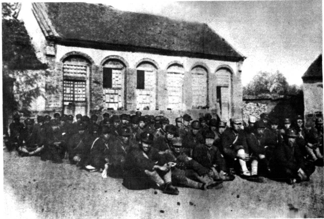
1938年5月，郭洪涛率约50名干部从延安到达鲁中山东省委驻地。之后，奔赴山东各个战场，成为开辟山东各抗日根据地的主要力量

下；林浩率第四支队第一团、教导队和政治部到蒙阴县的坦埠，与廖容标、姚仲明带来的1个团会师。8月28日，郭洪涛率南下部队北返，到达沂水县岸堤（今属沂南县），与林浩、廖容标所率部队会合。9月，边区省委在岸堤召开会议，研究开辟沂蒙山区抗日根据地问题，进一步确定在沂蒙山区建立根据地的方针。