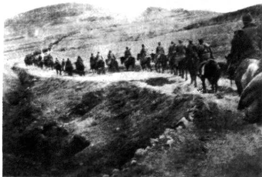
1938年，八路军鲁东抗日游击队第八支队由清河区开往沂蒙山区

水、安丘、临朐等县党的组织，所辖地区的区委、村支部以及农救会、青救会、妇救会、自卫团、儿童团等群众抗日团体也相继建立。这表明，鲁中抗日根据地已具雏形。