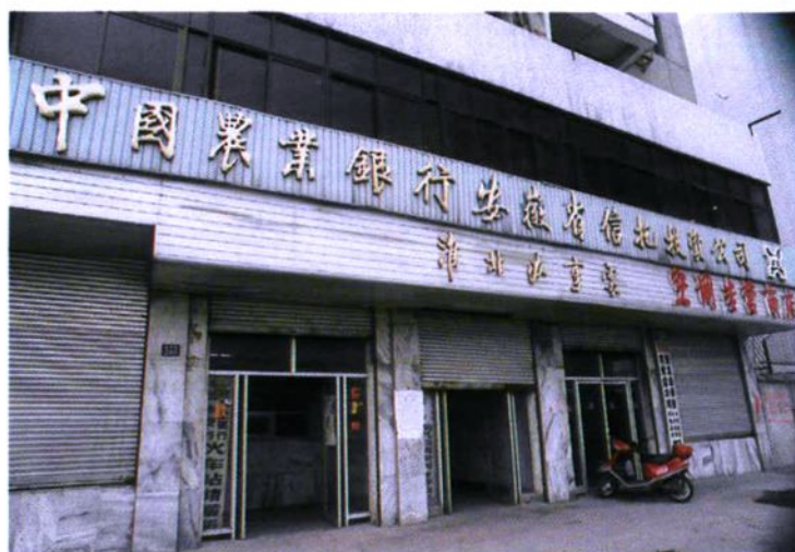
信托机构成为非银行金融机构的主力