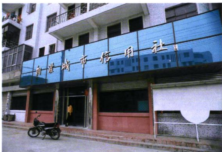
崛起中的城市信用社