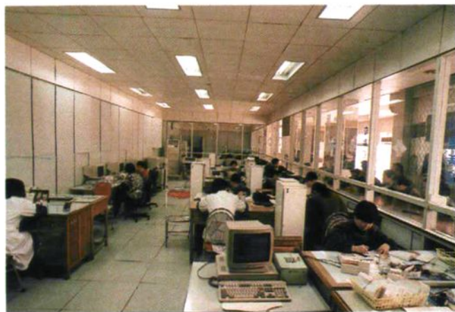
市工行营业部大厅