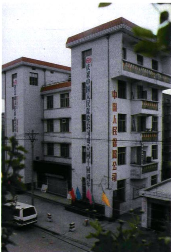
中国人民保險公司淮.北市支公司