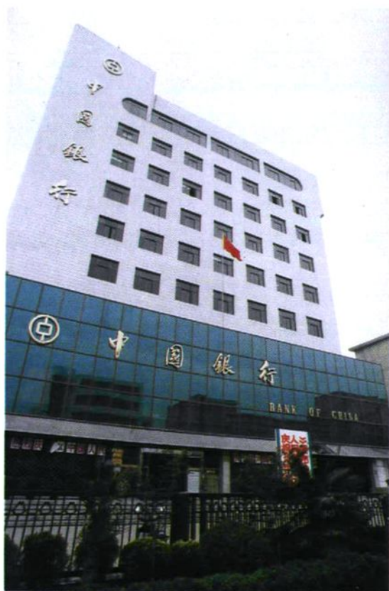
中国银行淮北支行