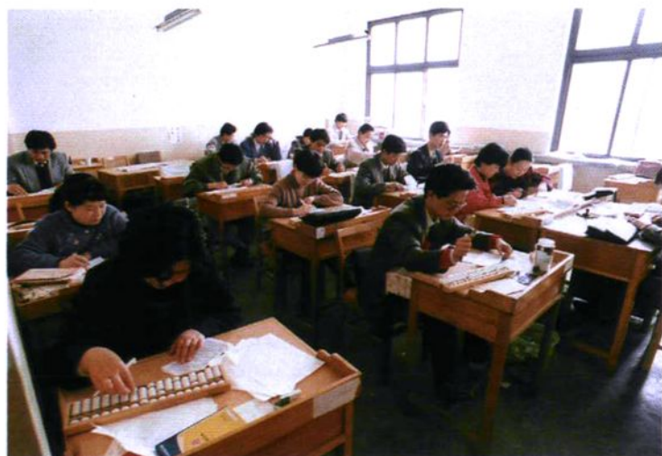
设在市人行的票据交换场