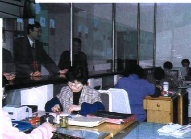
市保险公司营业厅一角