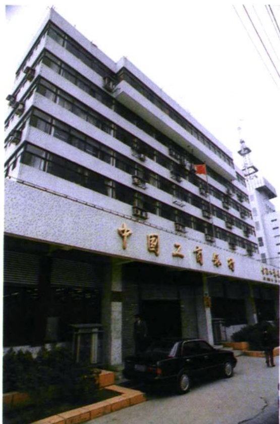
中国工商银行淮北市支行