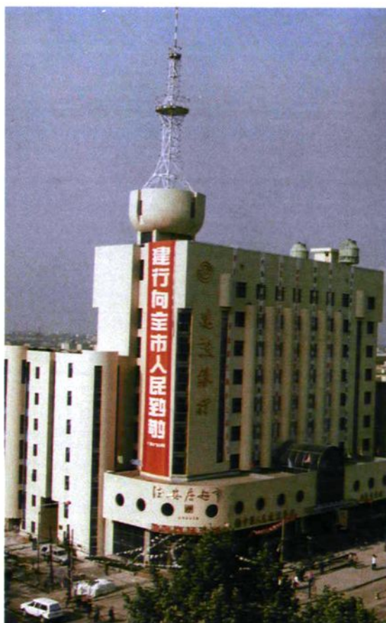
中国人民建设银行淮北市支行