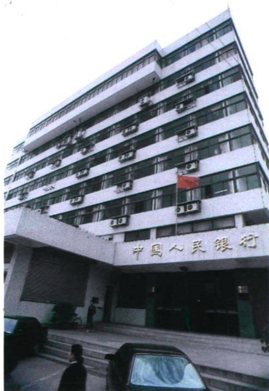
中国人民银行淮北分行