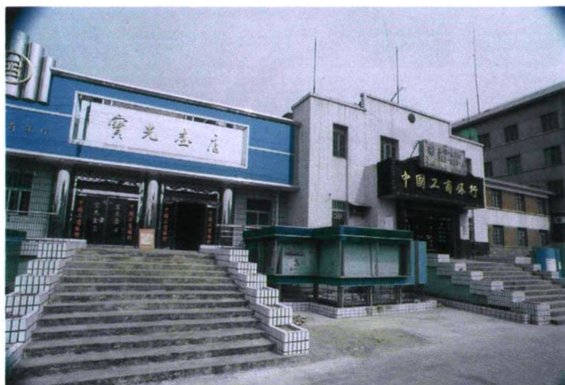
中国人民银行淮北市支行旧址(1964年启用,这是淮北市最早的银行办公用楼)