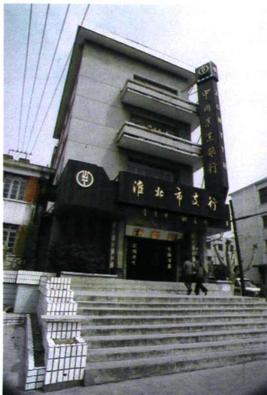
中国农业银行淮北市支行