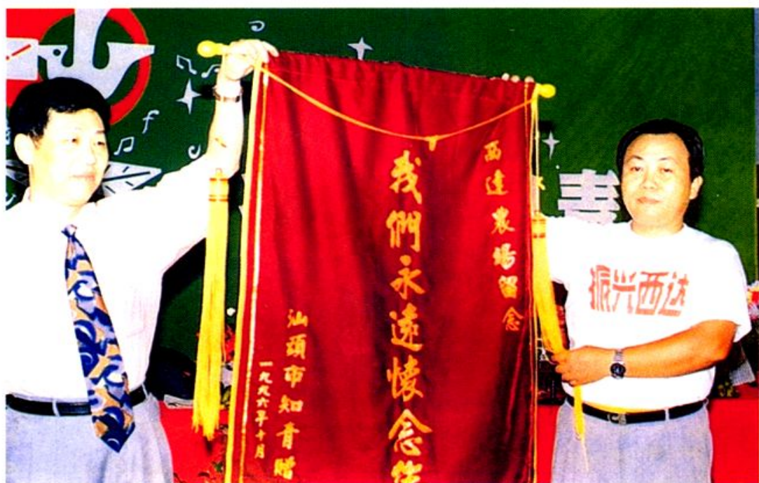
1996年10月7日，汕头市返场“知青”慰问团向农场赠送锦旗及 捐款人民币十万元。