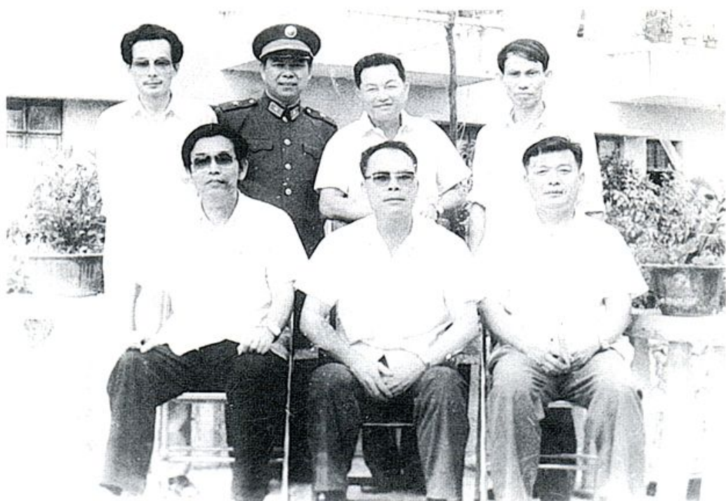
1986年5月1日，原海南军区司令员庞为强（前中）在原澄迈县委书记，现国务院港澳办副主任刘名启（前左一）的陪同下，亲临我场检查指导民兵工作时合影。