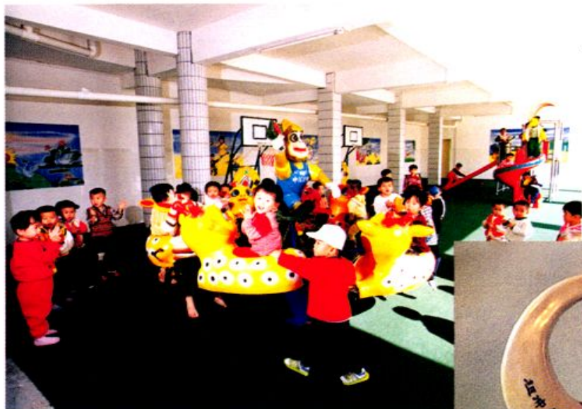
场部中心 幼儿园一角。