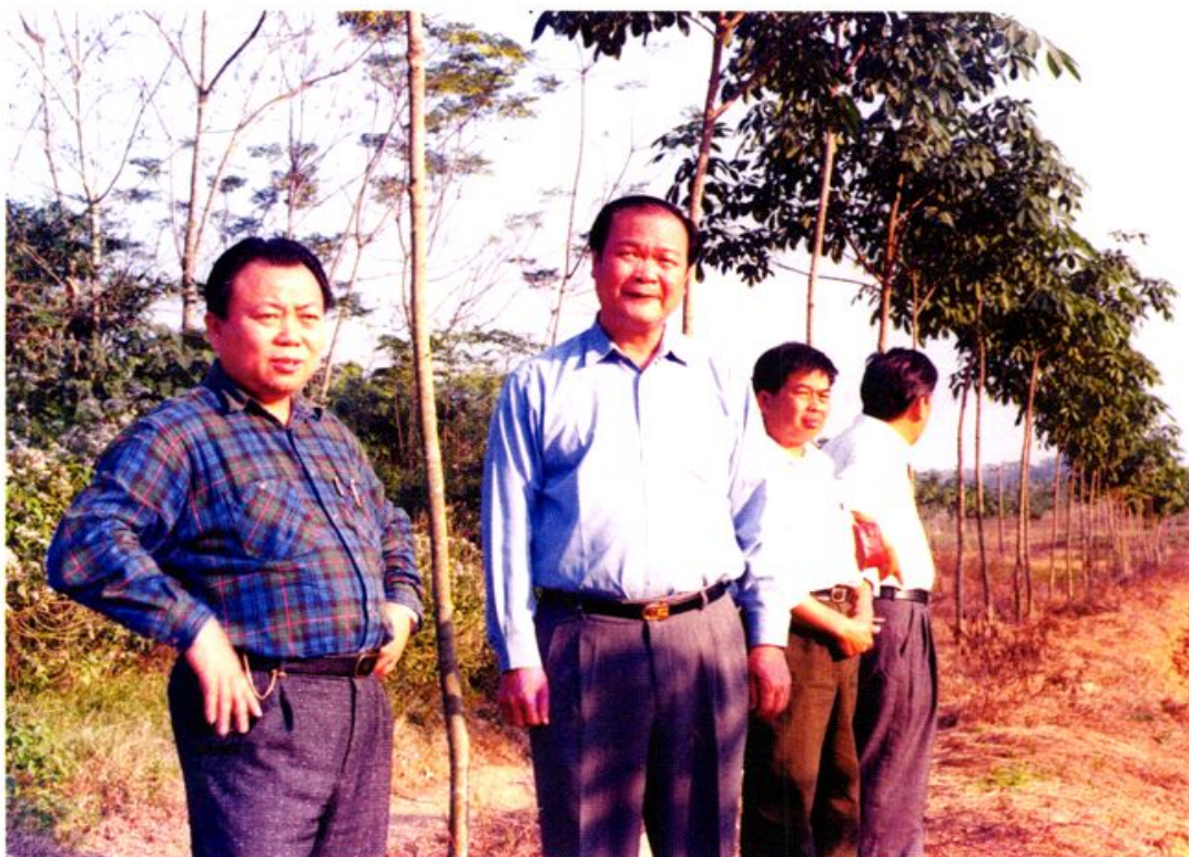
海南省农垦总局林玉权局长亲临我场中胶基地指导工作。