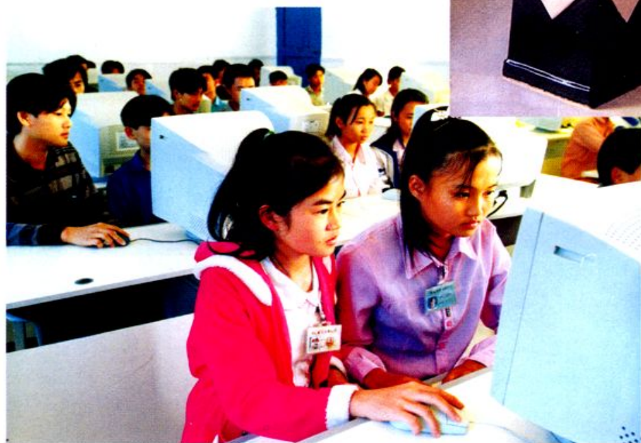
西达中学电脑教学。