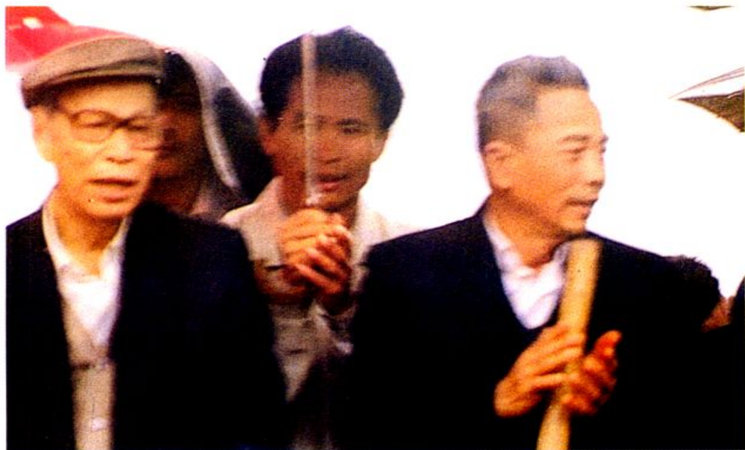
1992年1月25日，原琼崖纵队副司令员马白山（前左一）冒雨亲临我场，参加六芹山革命纪念馆奠基仪式。