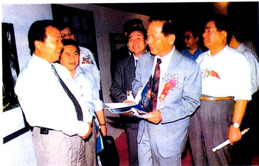
场长王天胜在九乐宫温泉招商会上向海南省原副省长现人大副主任陈苏厚介绍开发建设情况。