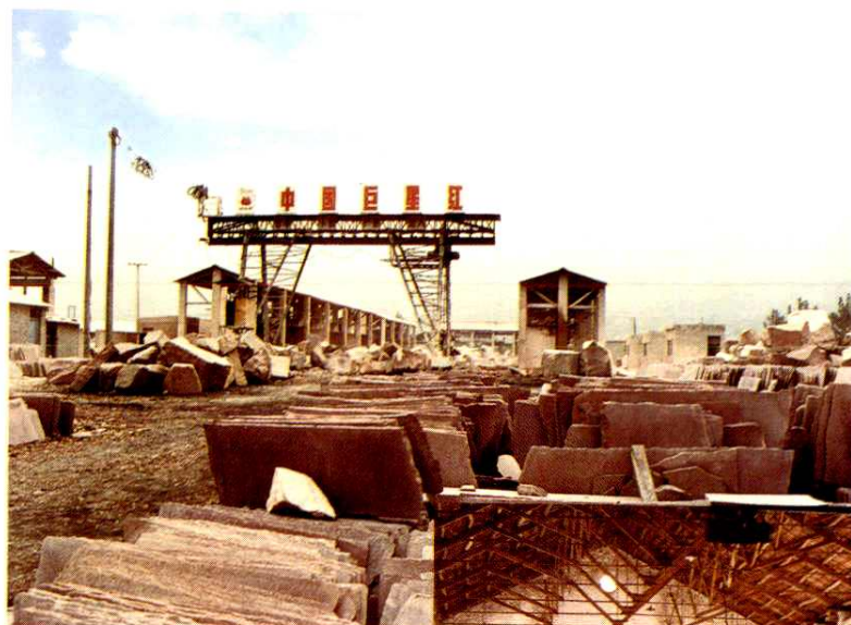
◀▼ 财政扶持的石材加工厂