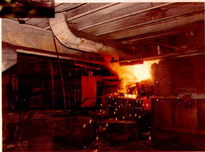
▶ 财政扶持的高耗能工业