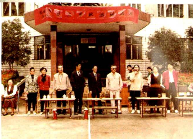
▶ 省财政厅、地区行署领导与地区财政局干部职工同乐