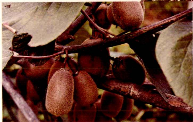
◀ 财政扶持的“三高农业”果实累累