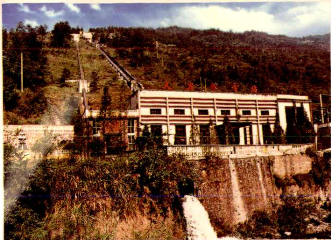
◀ 财政扶持的小水电站