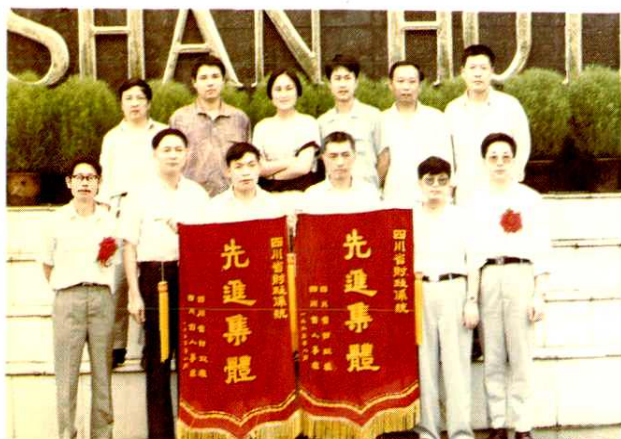
◀ 省财政厅厅长李达昌与雅安地区财政系统部分领导合影留念