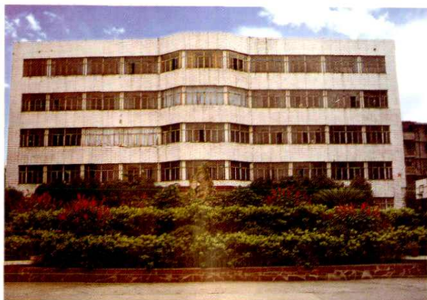
◀ 雅安地区财政局办公大楼