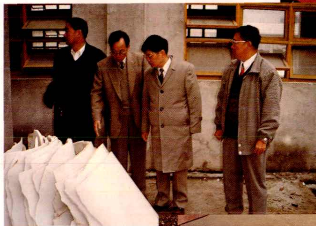
◀ 地委、行署、省财政厅领导视 察财政扶持项目 地委书记杨水源(右一)、行署 专员苟彦云(左一)、省财政厅 厅长黄工乐(右二)、行署副 专员李超凡(左二)