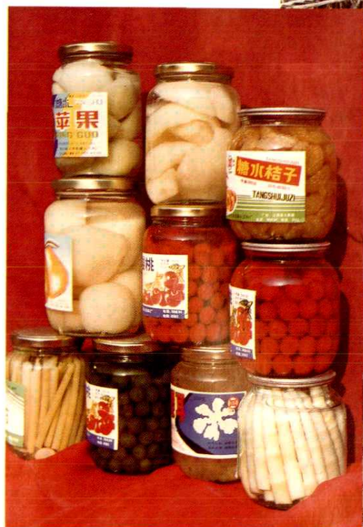
◀▼ 利用天然水果资源生产系列罐头、饮料食品，远销国内外