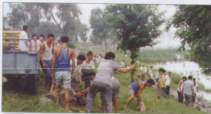
卫运河故城县前香坊 险工抛石护岸