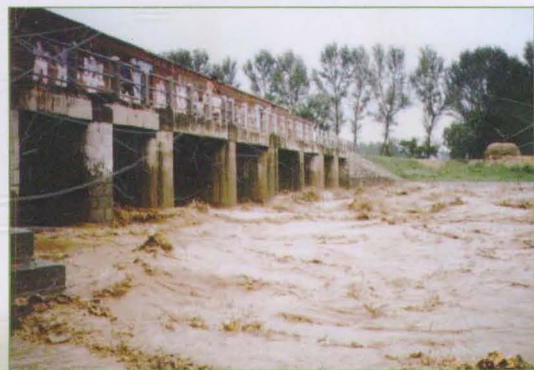
卫河刘庄闸下水情