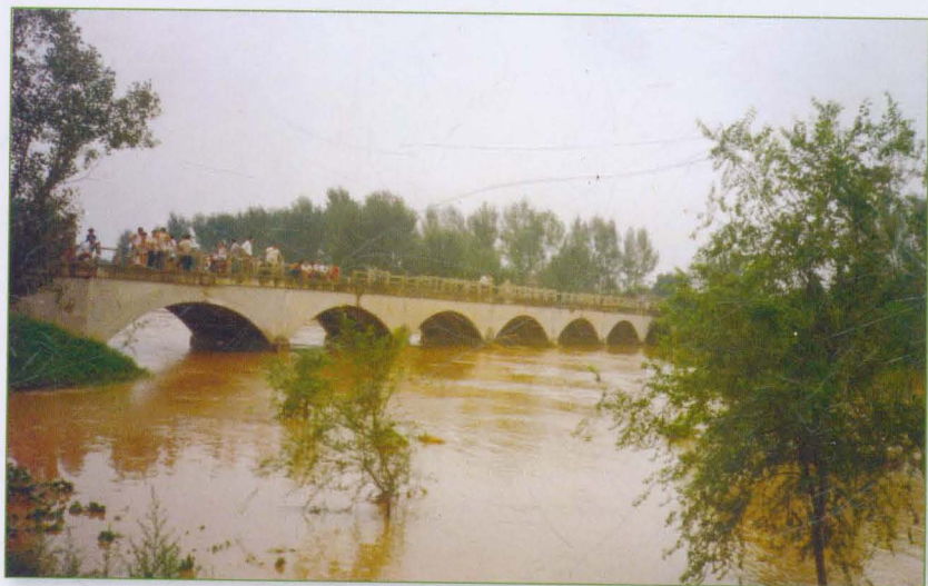
卫河小张庄桥过水场景