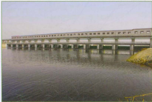
王营盘拦河蓄水闸