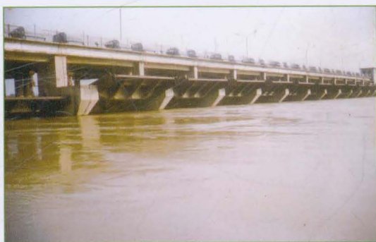
漳卫新河庆云拦河蓄水闸过水场景