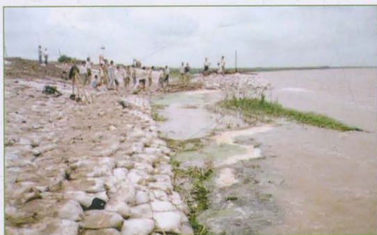
漳卫新河无棣段堤防加固