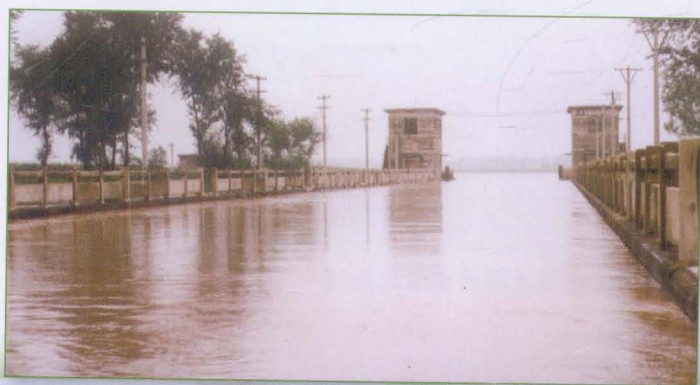
卫运河祝官屯枢纽水情