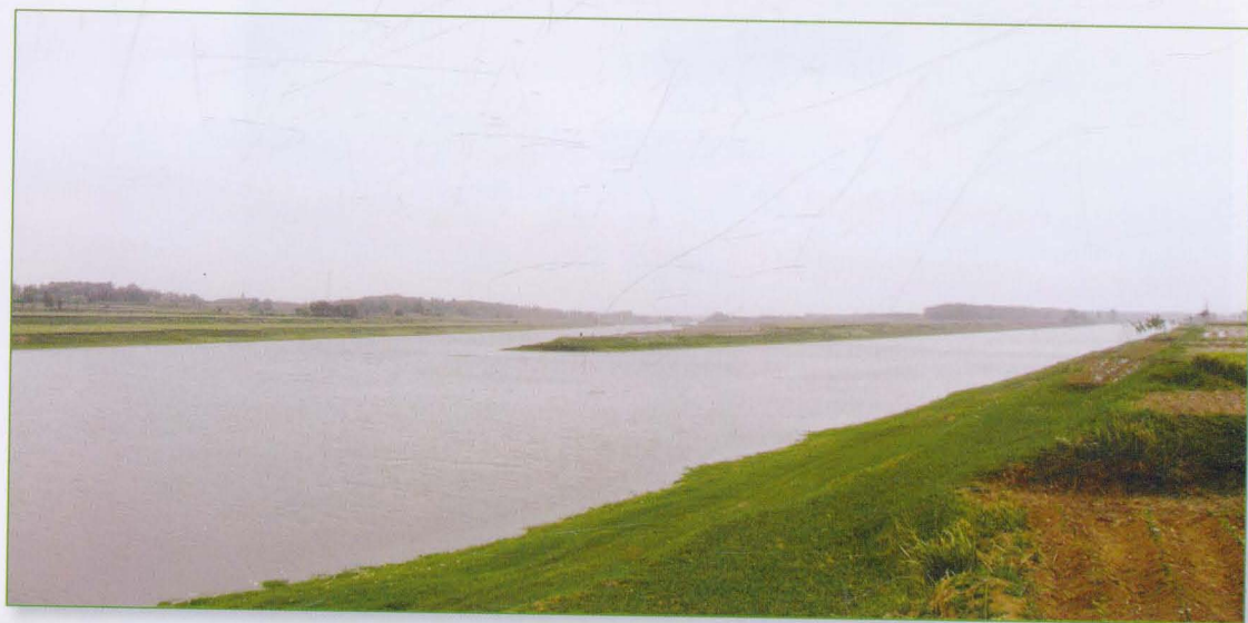
漳卫新河河道（汾河、减河汇合处）