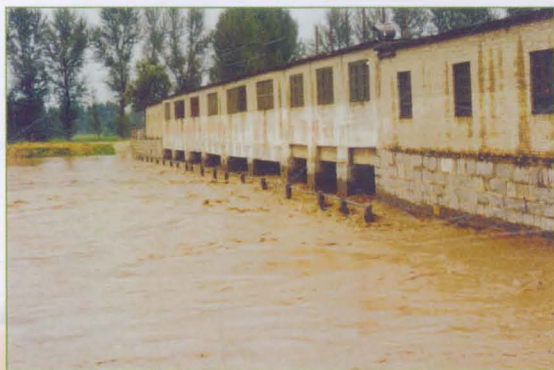
卫河刘庄闸上水情