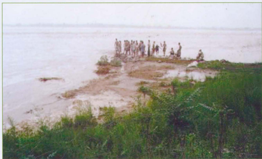
漳河陈村6号坝被洪水冲刷