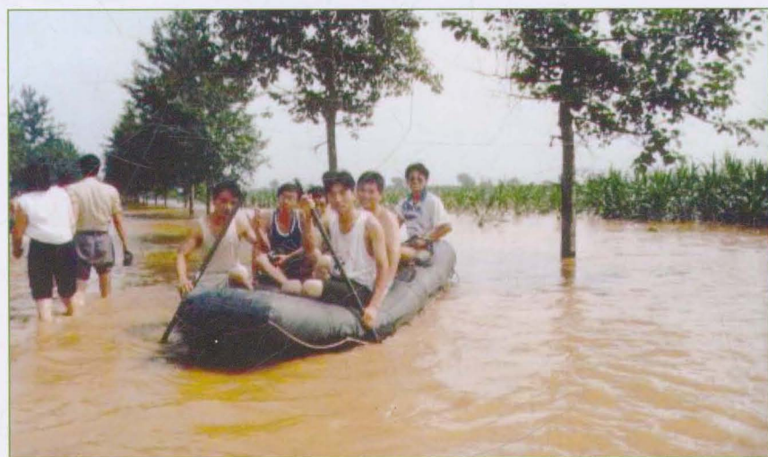
邯郸处职工划橡皮艇检查漳河险情