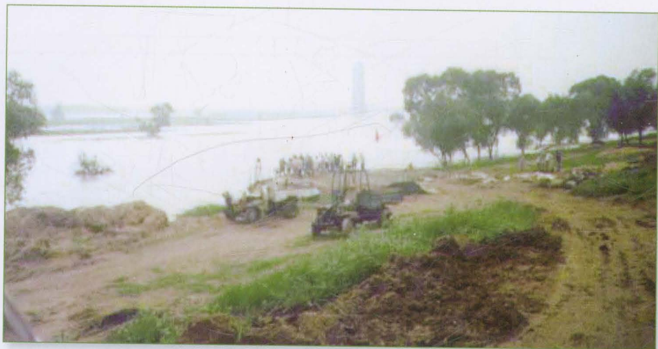
卫运河北大洼封堵现场