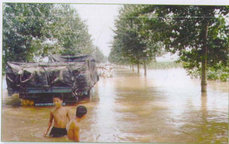
蔡小庄公路被漳河洪水淹没