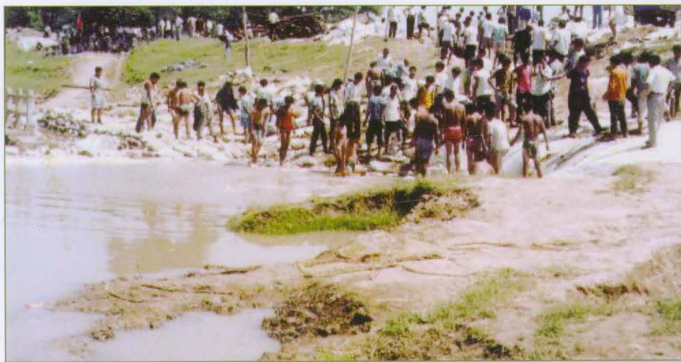
漳卫新河严务涵闸抢险加固