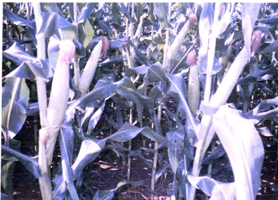
今日北大洼丰收景（之三）