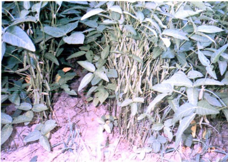
今日北大洼丰收景（之二）