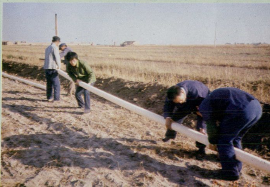
安装灌溉地下防渗管道