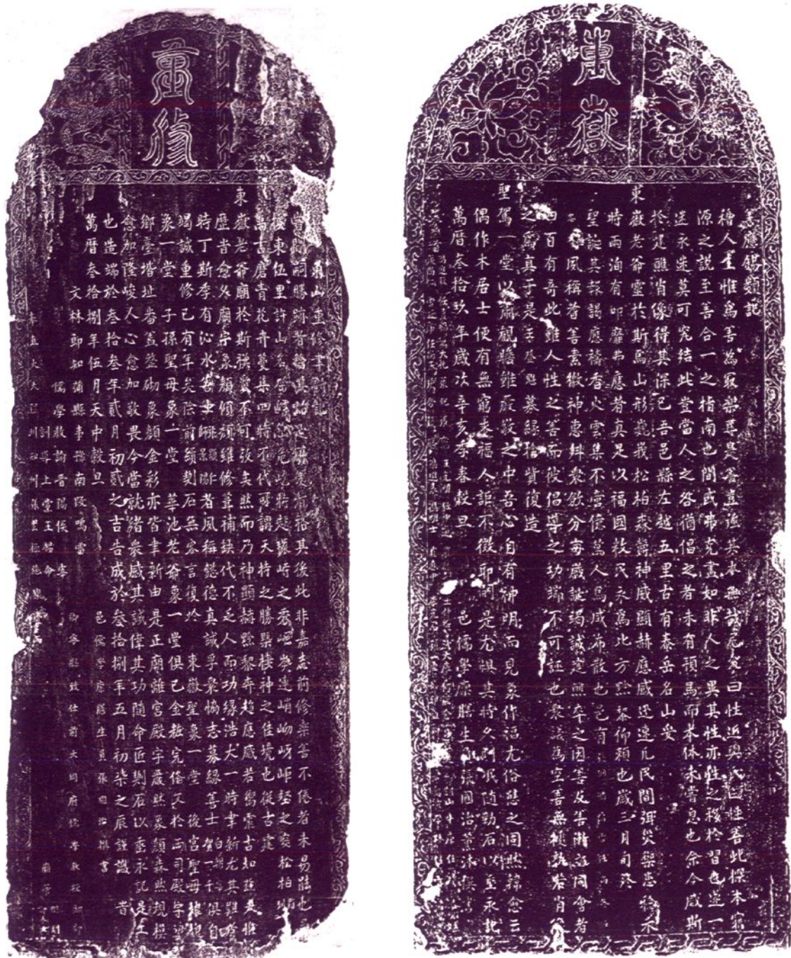
张国治，男生卒不详，明万历时蒲县人，县儒学禀膳生，曾任广昌教谕，擅长书法篆刻，行草精妙，尤小楷见长，曾多次为东岳庙撰写碑文，文词简洁流畅，书法端庄大气，为后代仰慕。