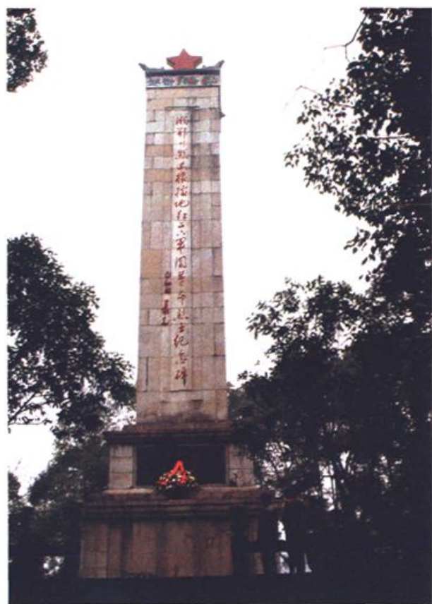
肖克同志题写的塔卧烈士纪念碑