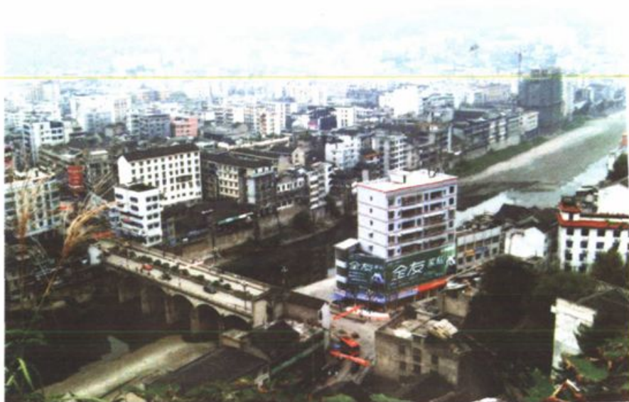
永顺县城全景(2006年10月)