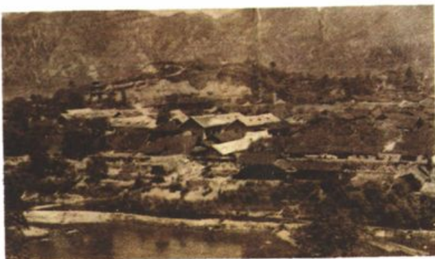
▶ 永顺县城旧貌 (1950年)