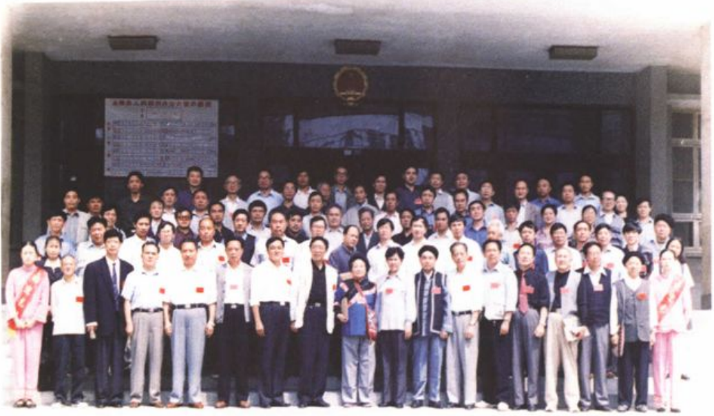
出席全国土家族经济文化研究协作会第四届年会代表合影 2000年9月20日于永顺