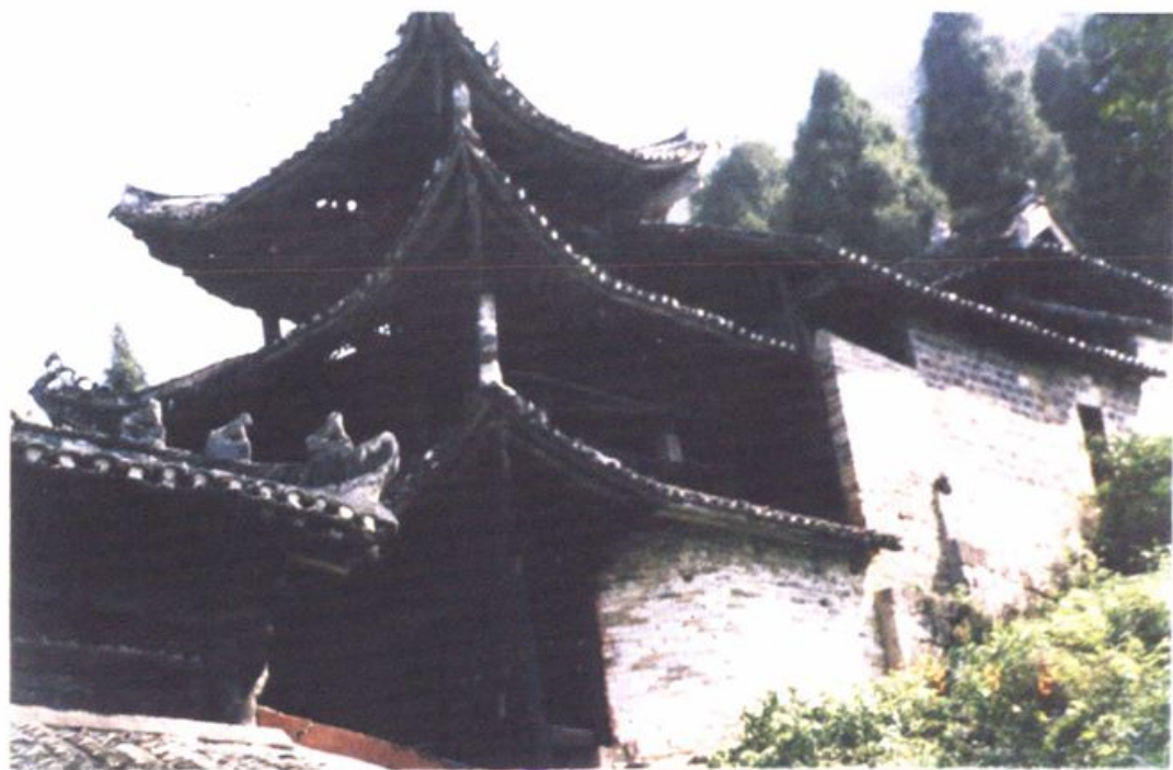
土司古都老司城之祖师殿