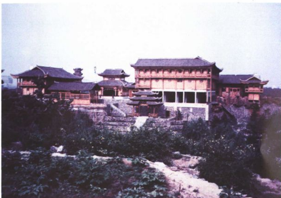
北京修建的“土家山寨”全貌