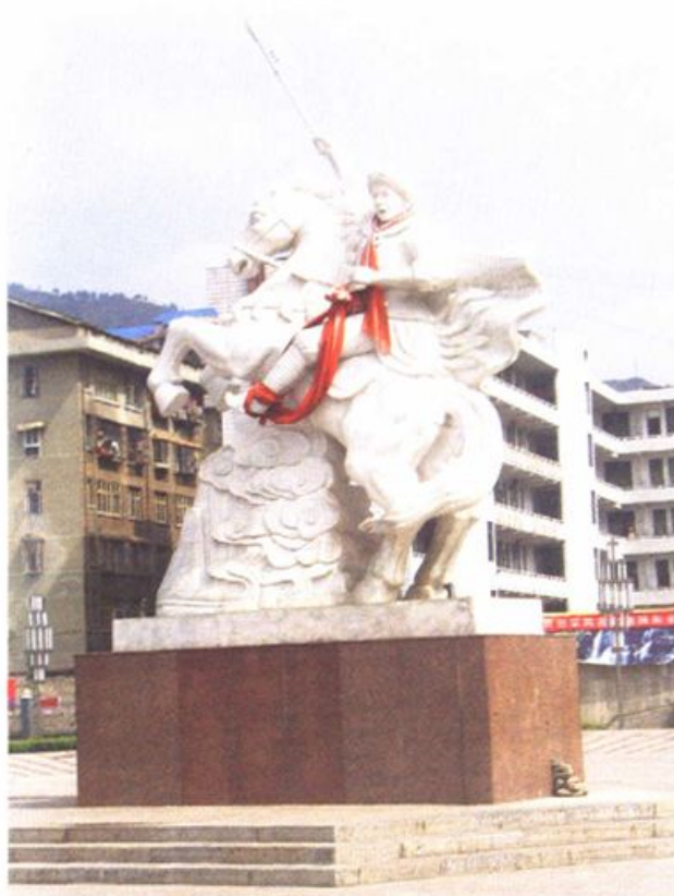
明朝抗倭英雄彭翼南