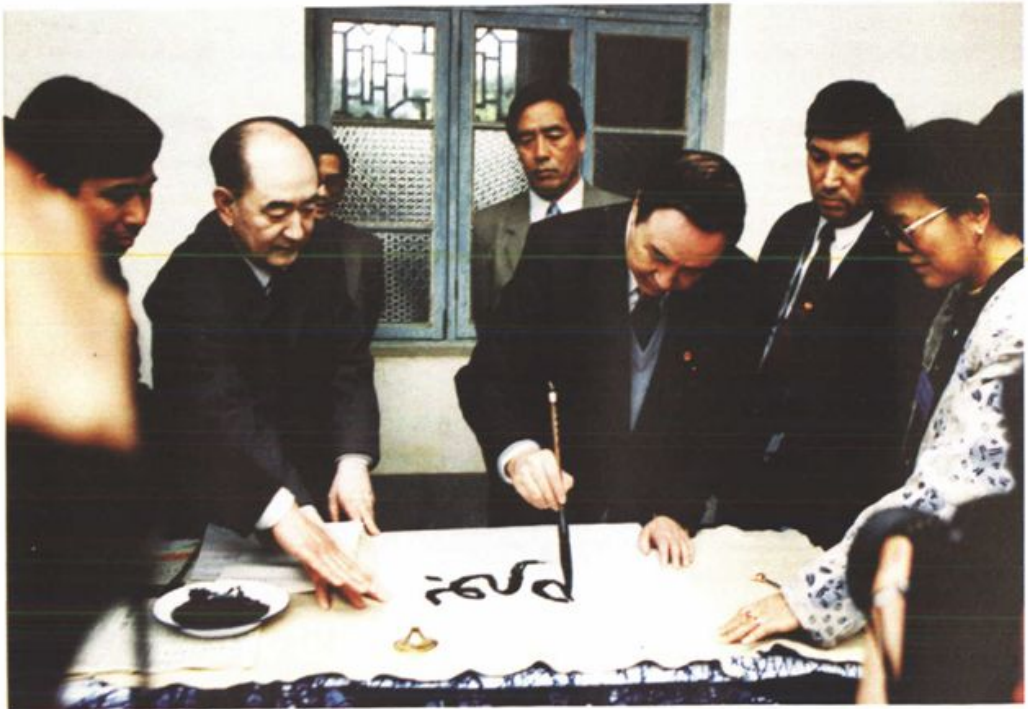
国家民委主任司马义、艾买提来永顺县视察工作