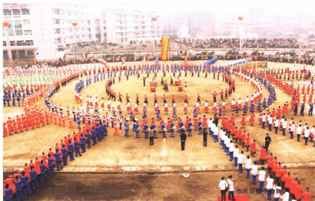
永顺县于2005年12月举行的千人摆手舞活动