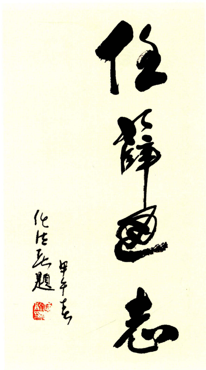
任法融 中国道教协会会长、全国政协常委、 第十届全国政协民宗委副主任