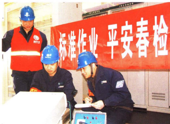
装表接电二班春检现场