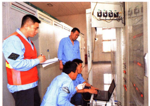
装表接电三班变电站作业现场