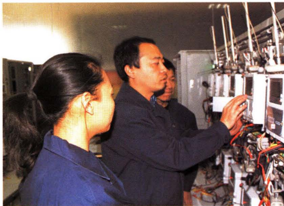
采集小组终端异常处理培训