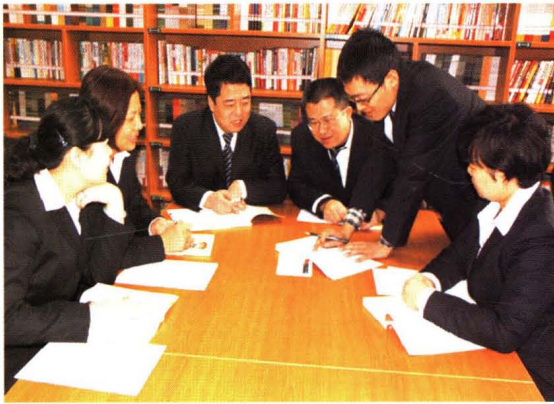
综合小组讨论绩效方案