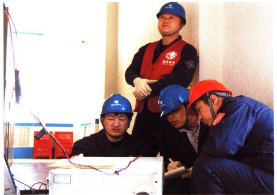
装表接电一班变电站测试现场