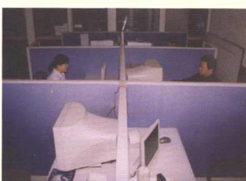
综合信息网数据中心