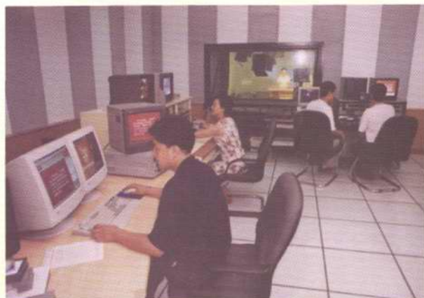
新闻演播厅及导演室