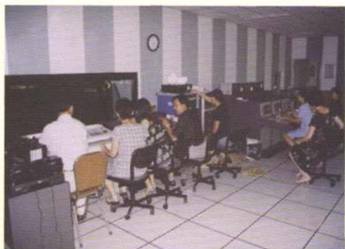
400平方米演播厅导演室