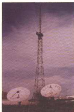
原广播电视发射塔