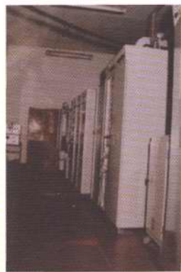
原塘沽电视台发射机房