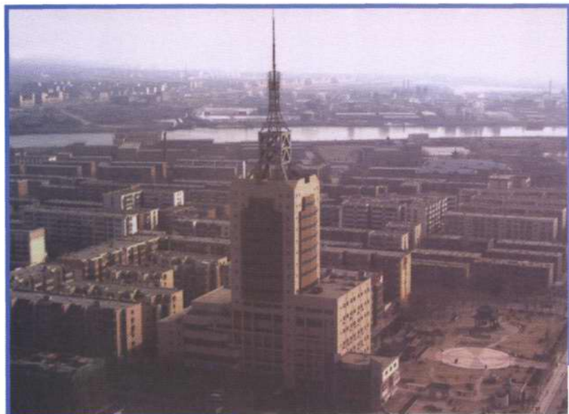
鸟瞰塘沽广电大厦全貌