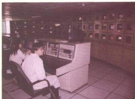
有线电视节目播出机房