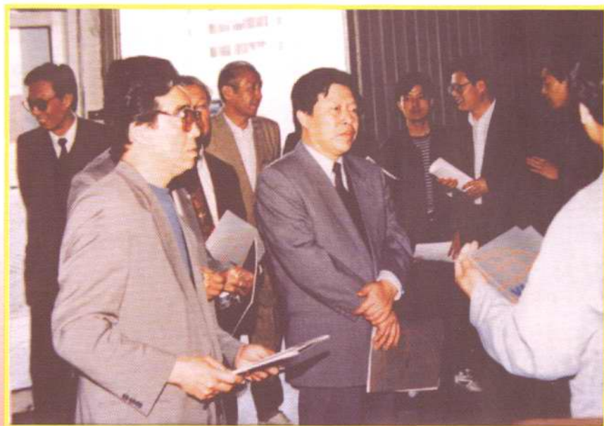
1995年5月14日，国家广电部部长孙家正同志（左四）到塘沽区考察，了解塘沽区广播电视事业发展情况，时任区广电局局长孙福祥同志（右一）陪同。