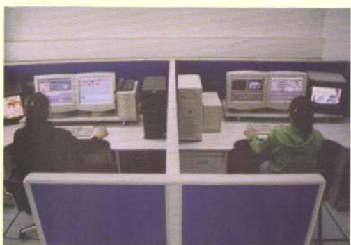
电视节目非线性编辑室