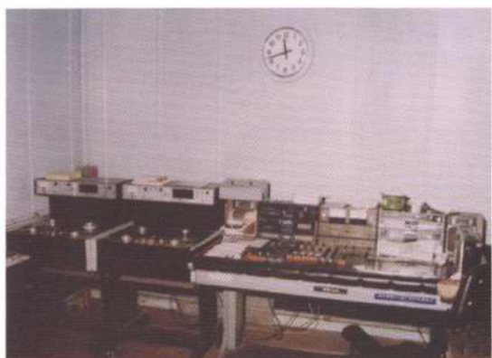
原塘沽人民广播电台机房