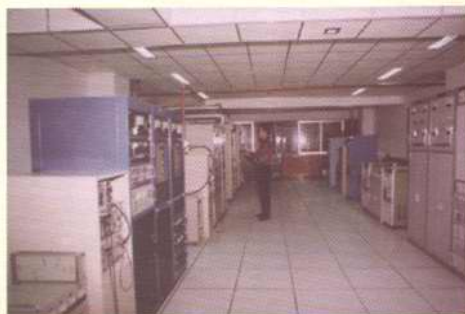
无线电视节目发射机房