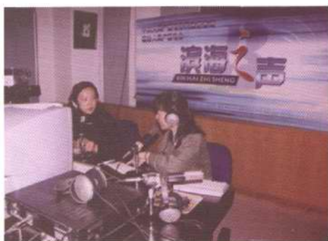
《滨海之声》广播直播间