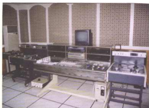
广播节目播出机房