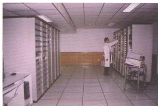
有线和数字电视节目前端播出机房