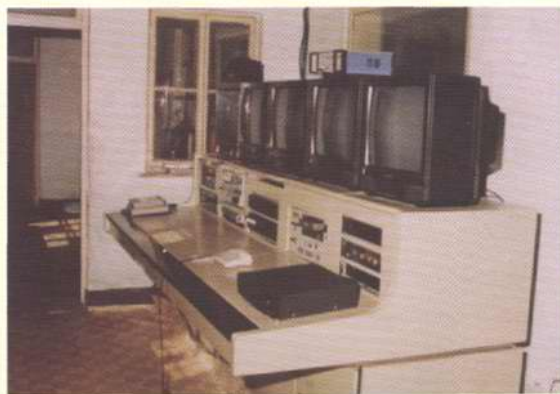
原塘沽电视台播出机房