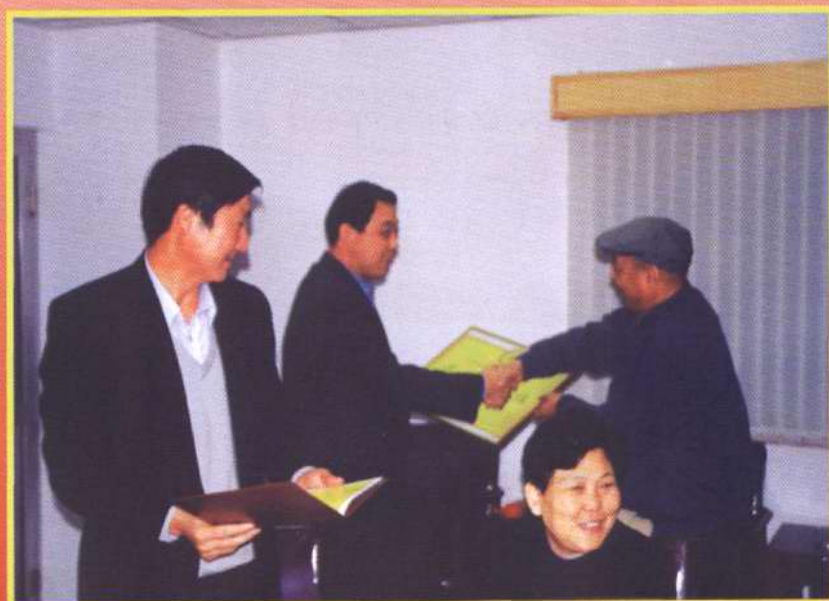
2000年11月16日，市、区档案局联合对区广电局的档案管理工作进行考核，区广电局成绩达到了市一级标准。市档案局局长孙志廉（右一）向区广电局局长马连华（左二）颁发“天津市档案工作目标管理考核定级证书”和“天津市档案工作目标管理达标单位”奖牌。