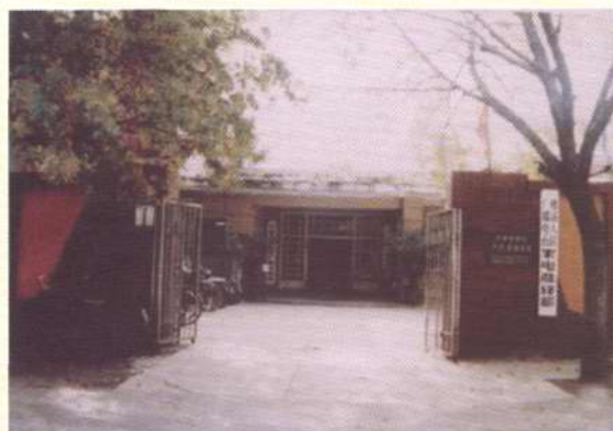
改造前的广播电视局原貌