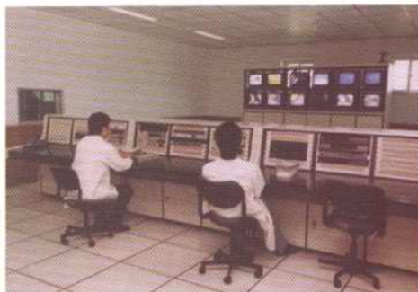
无线电视节目播出机房