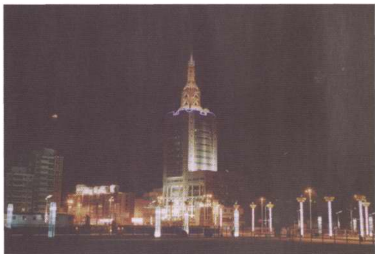
塘沽广电大厦夜景