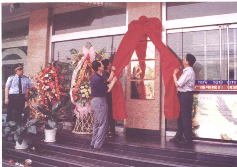
区领导为天津市滨海广播电视产业发展有限公司揭牌。