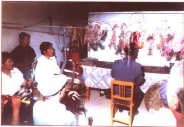
后台演职人员情景

在传统北鹵道情唱腔里，不论大段还是小段，甚至是一句叫板的演唱中，总离不开“麻簧”帮唱的辅衬。“麻簧”虽不能独立成章，却变化最为丰富，个性最鲜明，影戏人物表现力也最强。