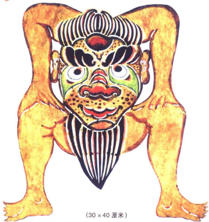
(30 × 40 厘米)