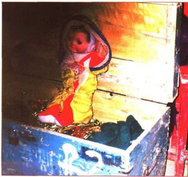
皮影戏箱中的庄王爷

是啼哭不止，人们拿他没有一点办法。后宫有一位宦官，用箩面粉的箩底当帷幕，剪树叶为影人，在灯光下为小王子演影戏，逗哄小王子。说来也怪，小王子再也不啼哭。小王子长大后，不喜欢坐王位，整天泡在影戏班里，当了汉宫影戏领班，人们尊称他是“庄王爷”。再后来小王子真正坐了皇帝，便金口玉言封影戏帷幕是“三皇五帝的脸面”，把演影