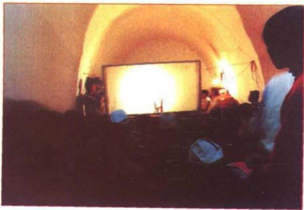
百余人挤在一个窑洞观影戏，回声宏亮，震颤强烈。

戏的大灯封为“佛掌”，灯中的五根捻子封为“佛指”，发出的光叫“佛光”，因而北幽人把影戏的一切用具当作神物来敬奉。敬奉庄王爷的习俗是在演出前给帷幕（即纸亮子）外面罩一层大红纸或黄表纸，保护帷幕，为“三皇五帝面孔”习俗的遗存。