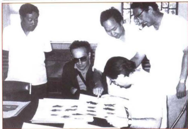
法国友人考查幽地皮影

皮影戏是中国戏剧之祖，也是电视、电影的鼻祖。北幽神怪皮影艺术品造型奇特，保存的纹样也非常完整，被国内外专家称为“国宝”、“国粹”。但是这种民间传统北幽神怪皮影已濒临灭绝，所以保护、研究、收藏这些珍贵的艺术品刻不容缓。