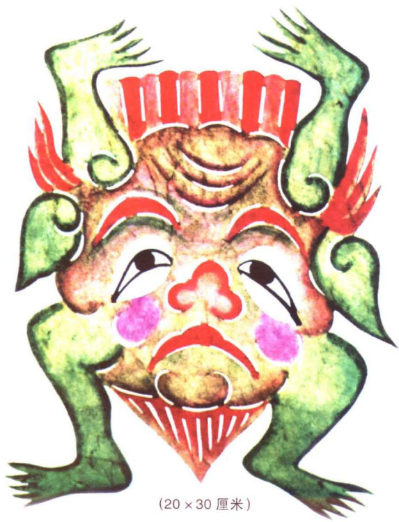
(20 × 30 厘米)