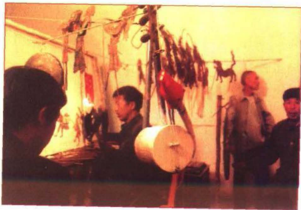
中央悬挂的是“四弦琴”

北幽神怪戏道情板式唱腔有三大类：一弹板类板式唱腔；二飞板类板式唱腔；三散板类板式唱腔。北幽道情弹板是主体板式和抒情性板类，基本呈现出一板三眼（4/4记谱）的规律。“弹板”为上下句结构，一个上下句便是一个基本单元，通过变化重复构成一段完整唱腔，而且多与飞板联套，以此形成节奏和腔速的前后对比。弹板有花音弹板和伤音弹板，语言情态甚浓，甚至全然就像说出来似的，却依然有着鲜明的调性和独特的音乐美，不是干涩的说明，是逻辑严谨的艺术创造。