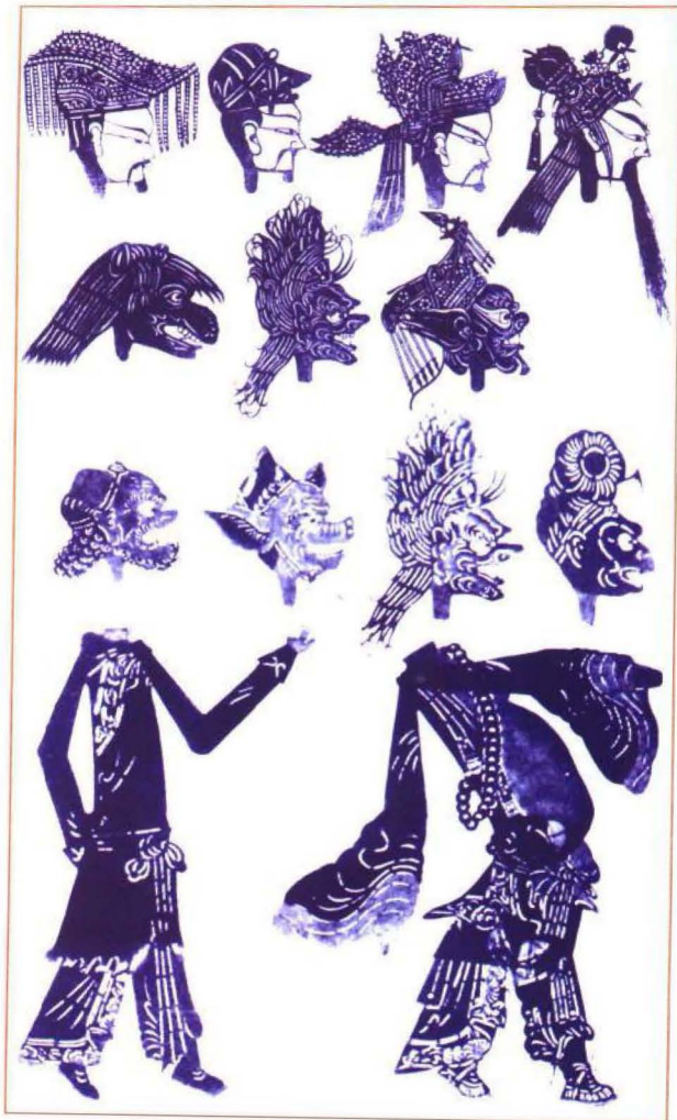
神怪皮影拓片(明末清初)

北幽有许多雕铍的艺人，当地群众称他们“线匠”，一般的线匠多是演唱挑线子好手。这些雕铍皮影的线匠，都有自己雕铍使用的专用部册，他们称为“线谱”。线匠在集市上出现，常常脖子后插着一个雕铍非常精