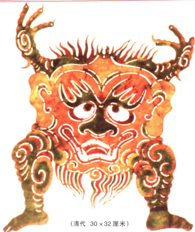
(清代 30 × 32 厘米)

刑天神，又名邢天、形天。曾与天帝争夺神位，败后帝斩其首，葬于常羊山，他不甘屈服，乃以乳为目，以脐为口，操干戚以舞。