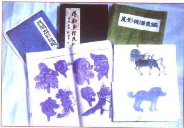
北鹵皮影线谱及拓片图册

北鹵神怪戏班子，一般坐前台的就是这个影戏团的班主，班主多是箱主，能挑能唱的老艺人，其他演奏人员多是班主的传世弟子，这些传世弟子又多是多面手。乐器虽然有四弦琴、渔鼓、干鼓、二胡、笛子、棒子、大锣、铜钹等，但乐队伴奏多是一人同时使用几种乐器。