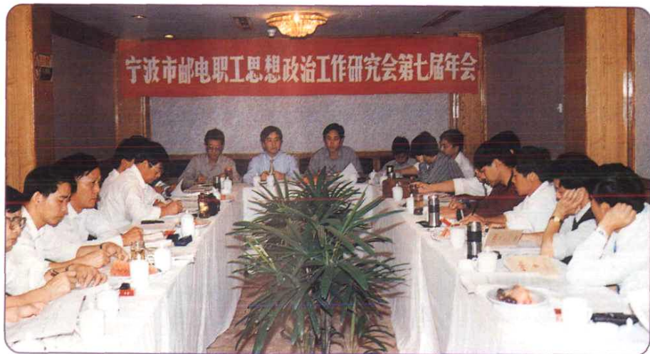
1996年10月，宁波市邮电职工思想政治工作研究会第七届年会召开。