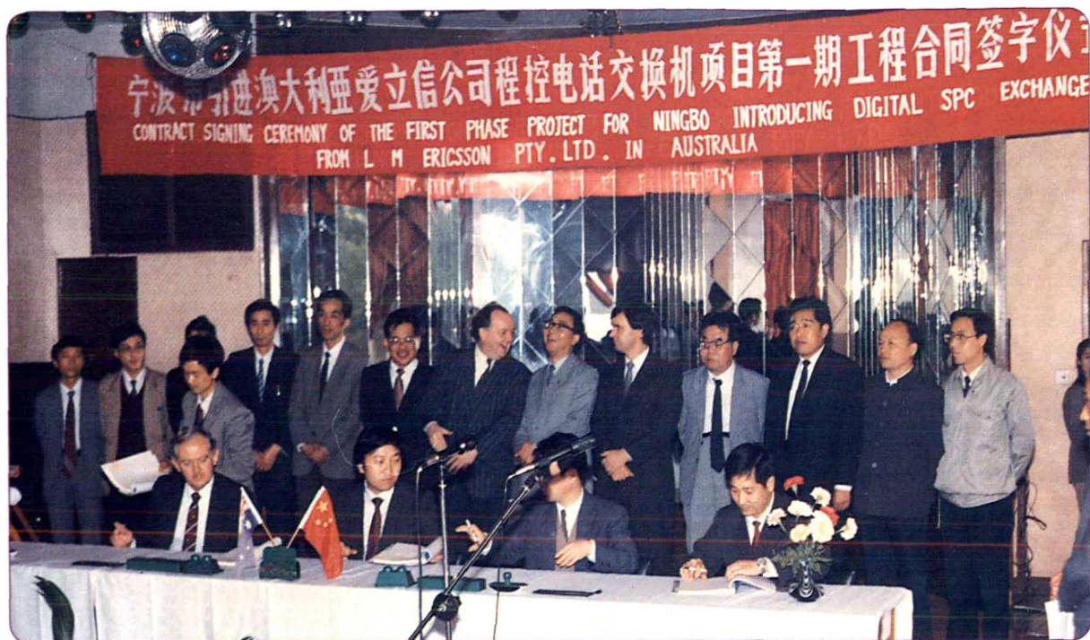
1989年，宁波市第二轮引进程控电话工程协议签订。