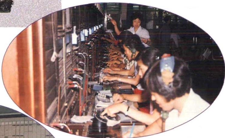
长途电话人工话务台。