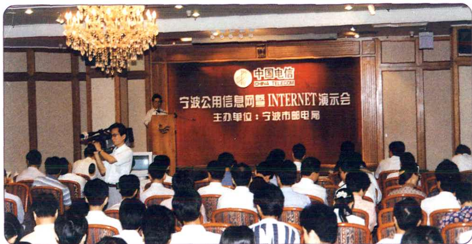
1997年5月，宁波公用信息网暨 Internet 正式开通。