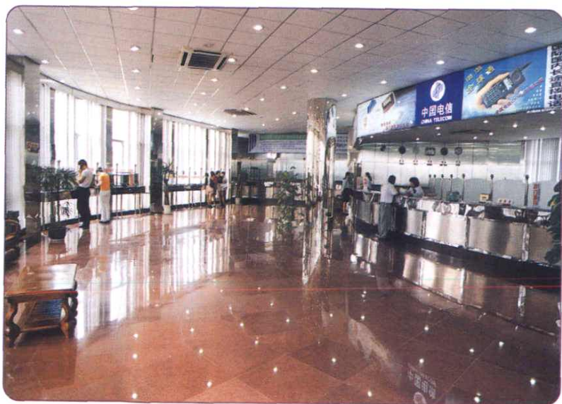
1997年9月，中山东路邮电支局二楼装修一新的电信营业厅投入使用。