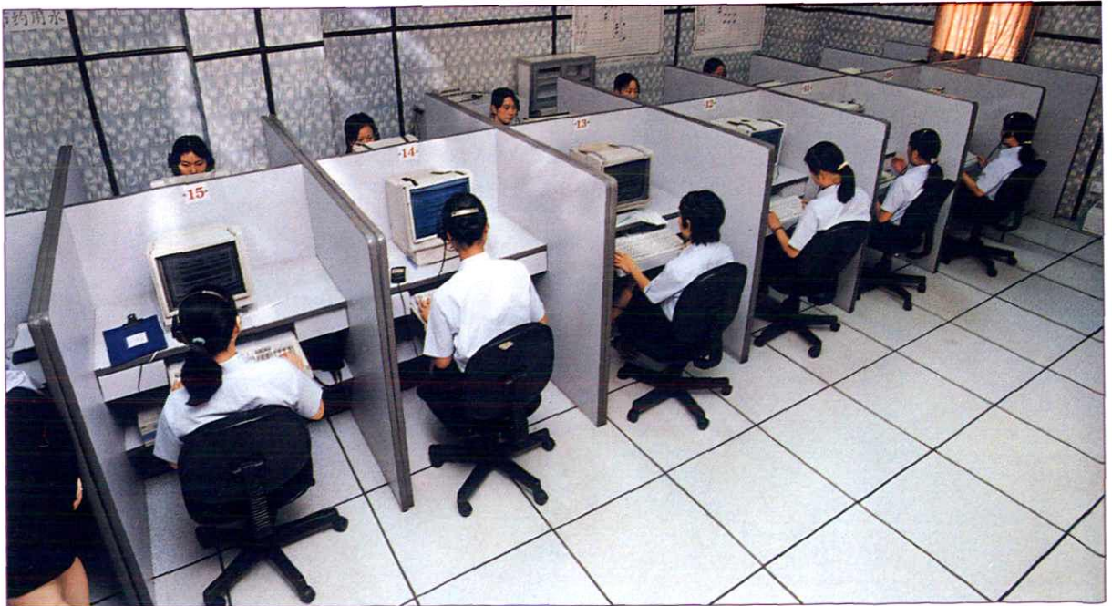
无线寻呼话务机房。