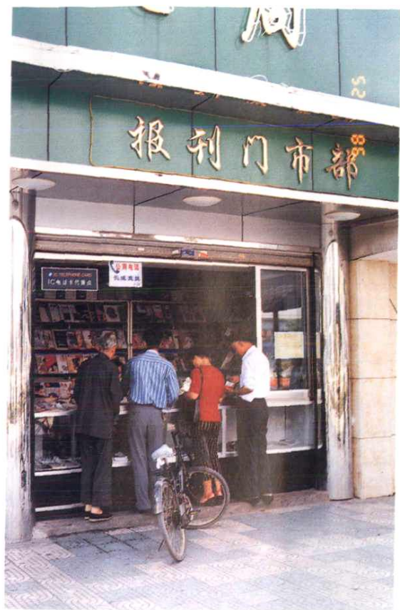
中山东路 124 号报刊门市部。