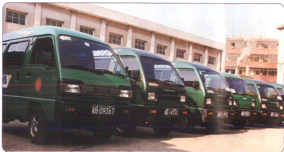
崭新的特快专递专用汽车促进了邮政业务的发展。