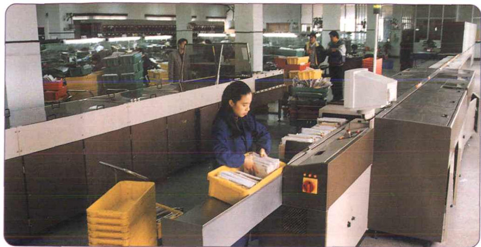
1996年，引进比利时BELL公司OVCS信函自动分拣系统开通。