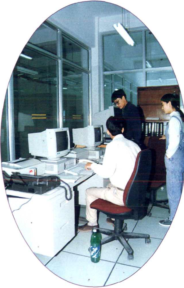
市内电话交换机控制机房。