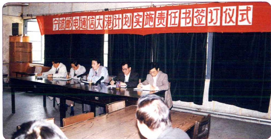
1997年4月25日，局领导与各部门负责人签订责任书，确保“通信大港计划”各项任务完成。