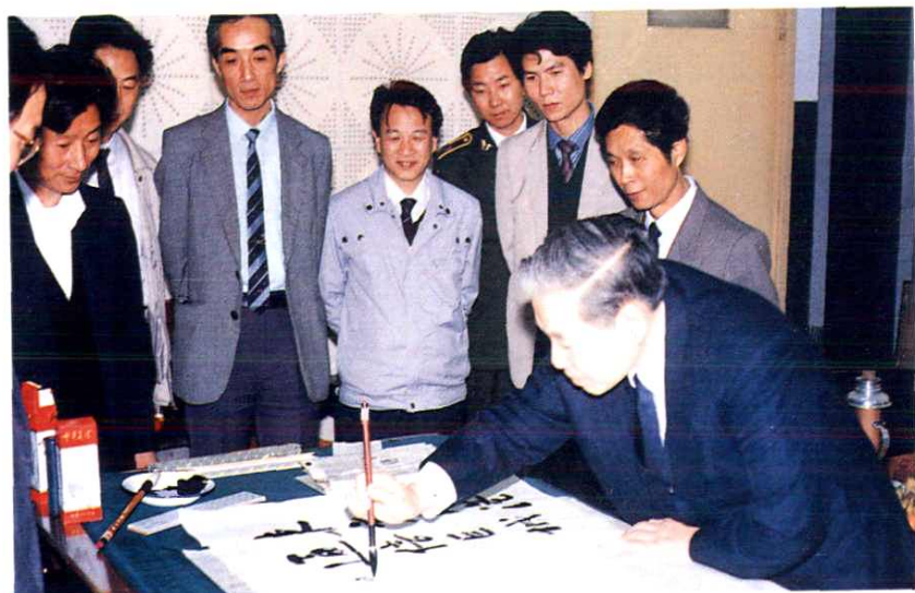
1992年5月，邮电部部长杨泰芳视察宁波邮电。