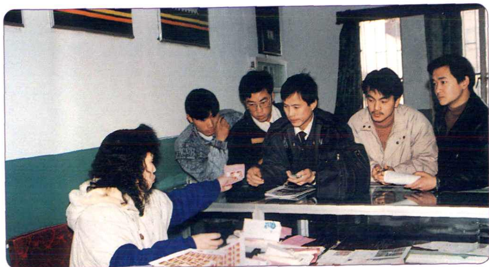
集邮既是人民群众文化活动内容，也是邮政的主要业务之一。