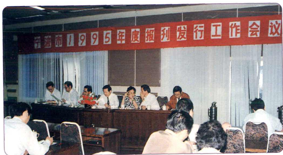
1994年10月，全市1995年度报刊发行会议召开。