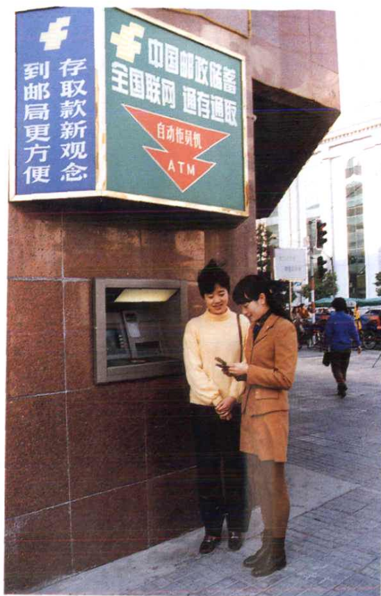
邮政营业网点的自动柜员机。