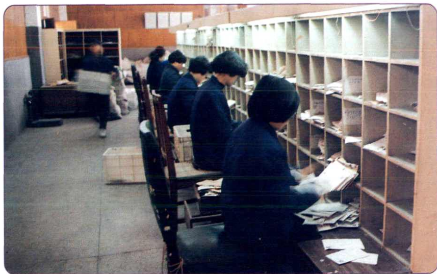
人工分拣邮件现场。