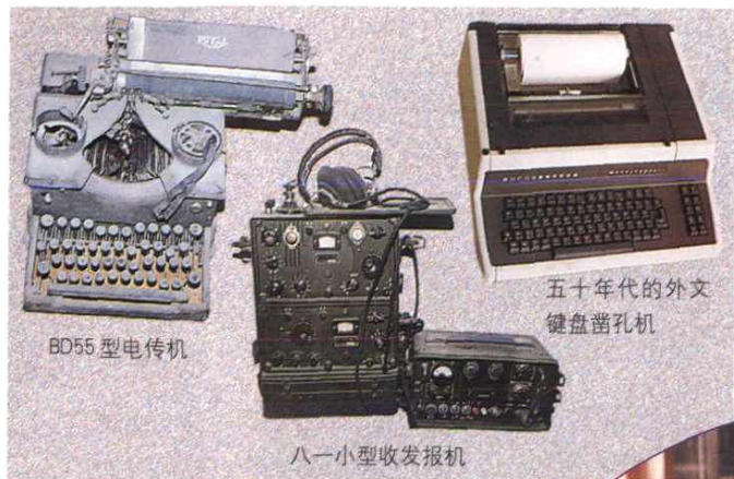
早期使用的电报设备。