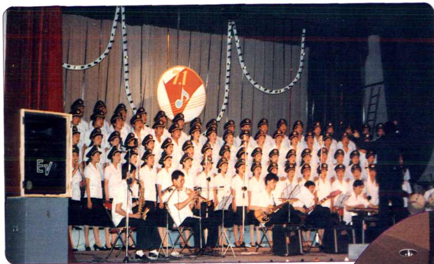
丰富多采的职工 文娱活动。