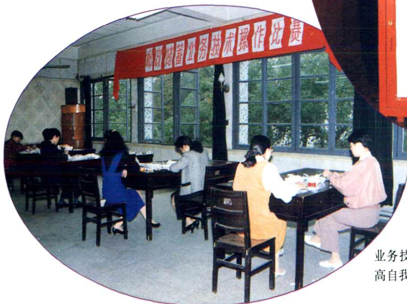
业务技术操作比赛为职工提 高自我素质的创造条件。