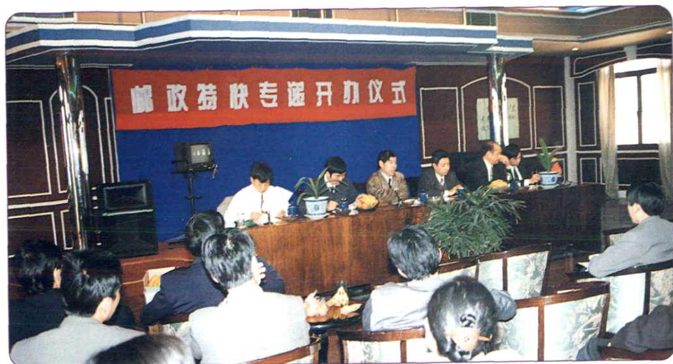
1995年，邮政特快专递业务在鄞县农村支局开办。