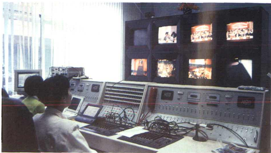
1995年5月17日，宁波市会议电视电话系统开通。图为主控机房。