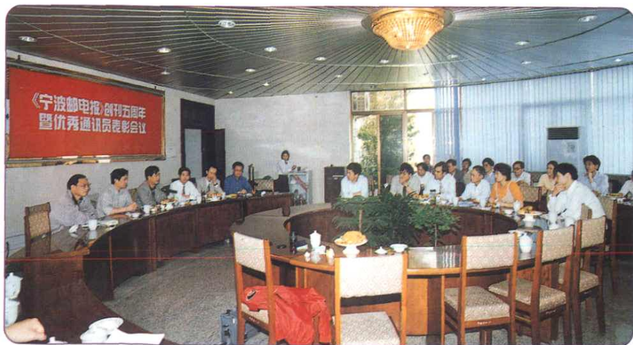
《宁波邮电报》成为职工思想政治工作、文化生活、业务学习的有效载体，促进了企业的发展。