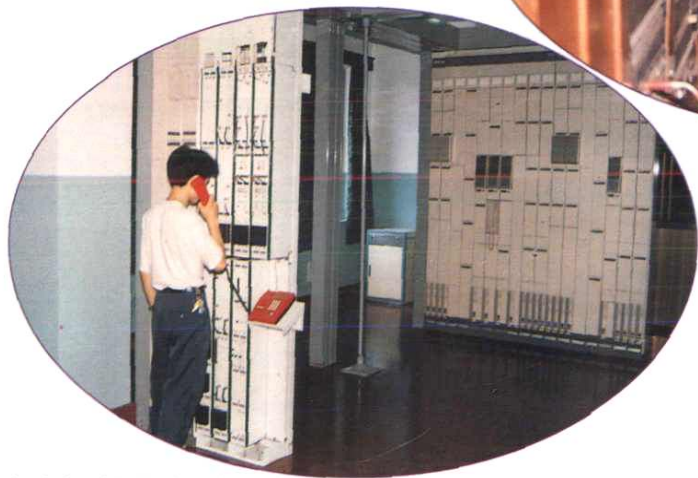
长途电话光传输机房。