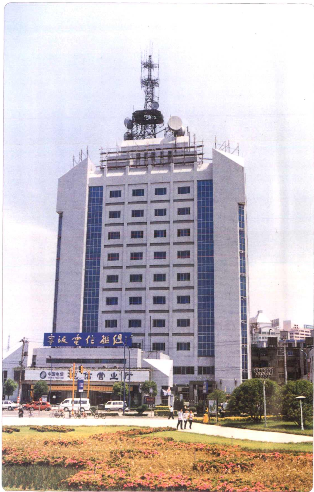
1993年建成的宁波电信枢纽大楼外景。