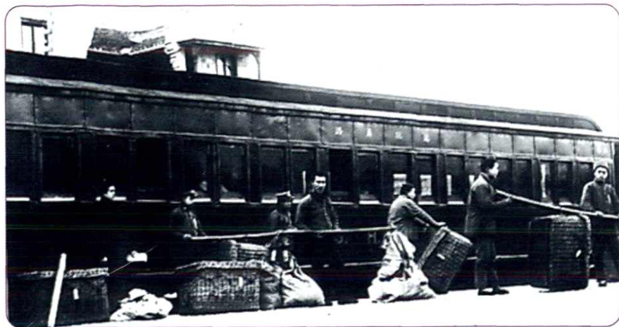
民国时期，邮差在火车站接发邮件。