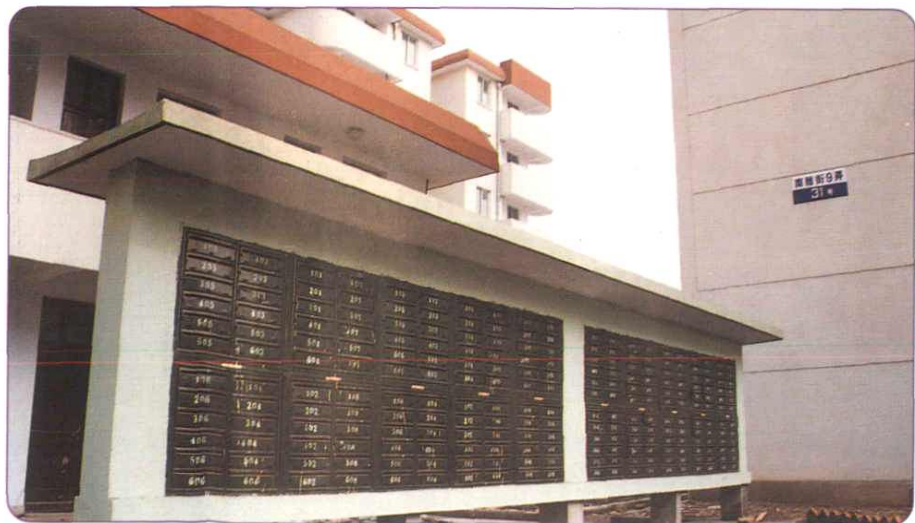
住宅小区标准的信报箱改善了居民通邮条件。