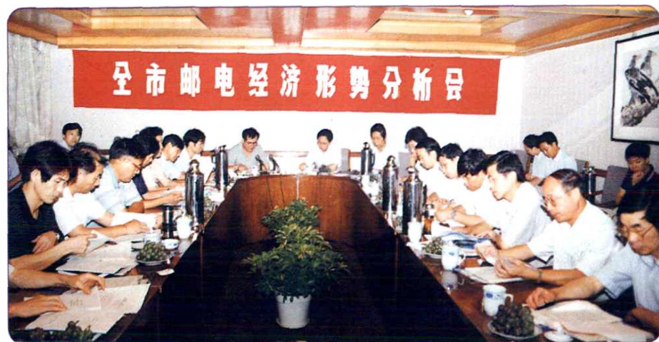
1997年8月26日，全市邮电经济形势分析会召开。