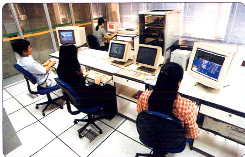
1996年，邮政储蓄“绿卡工程”开通。图为“绿卡”主机房。