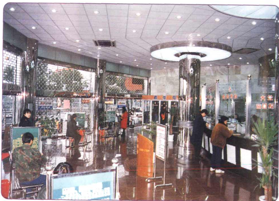
1997 年 2 月，装修一新的中山东路邮电支局一楼邮政营业厅投入使用。