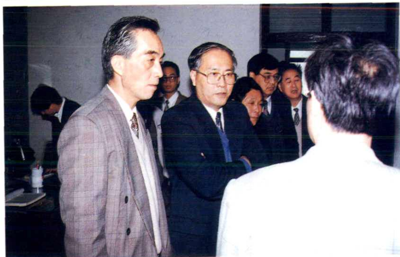
1996年11月，邮电部副部长周德强(前左二)视察宁波邮电。