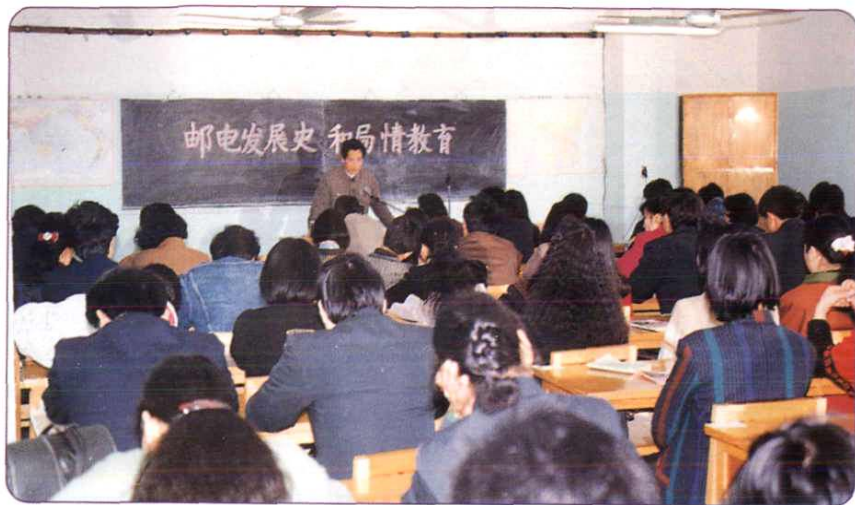
1992年3月，党委在35周岁以下青年职工中开展“双基教育”。