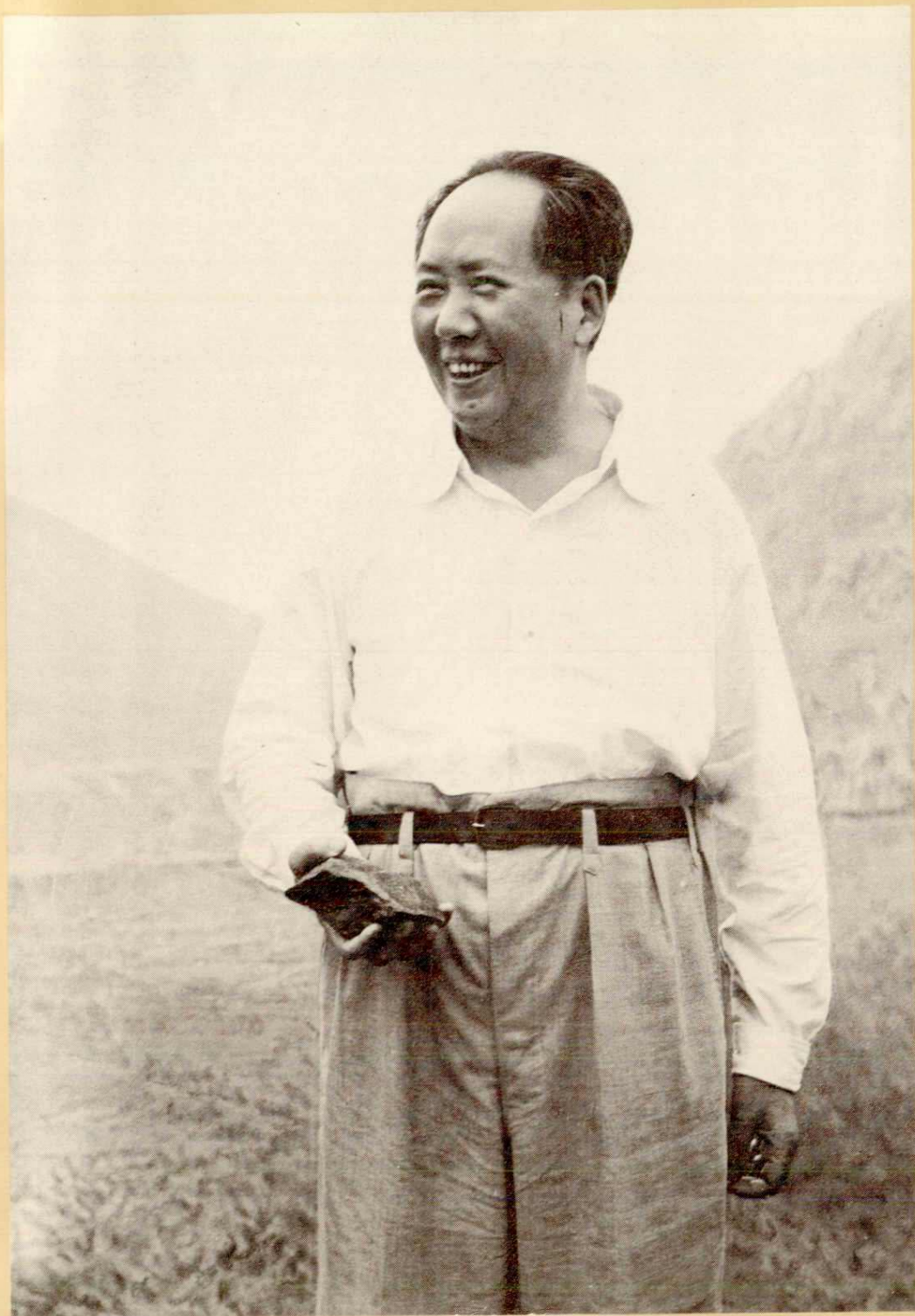
1958年9月15日毛泽东主席视察大冶铁矿