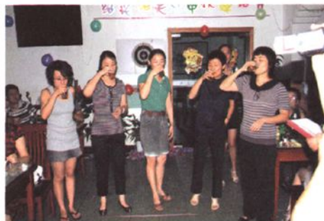
举办“迎中秋‘啤酒节’”