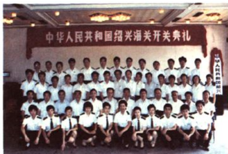
1991年6月26日，绍兴海关开关典礼