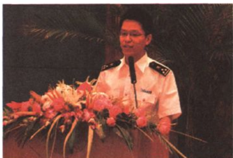
参加关区英语演讲比赛