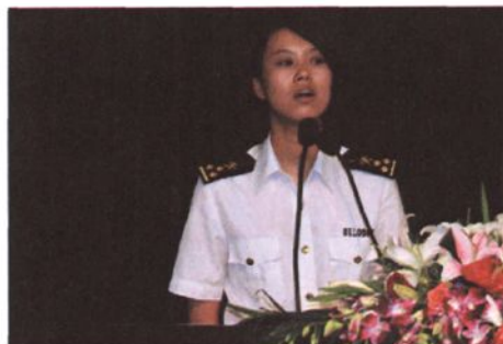
开展“说身边的人，讲身边的事”演讲比赛