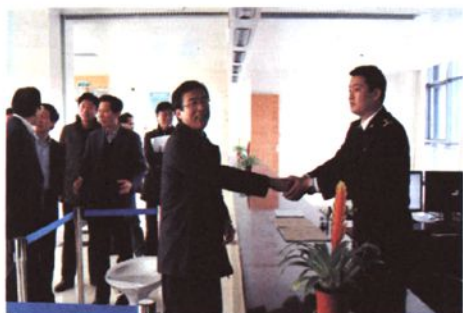
2011年3月，绍兴市委书记张金如看望海关关员