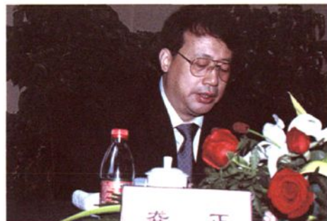
2010年1月，浙江省副省长龚正在绍兴参加杭州海关关区关长会议