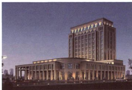
绍兴海关驻新嵛办事处（筹）大楼效果图