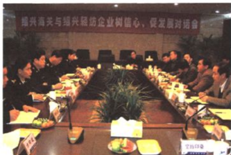
召开与绍兴轻纺企业“树信心、促发展”对话会