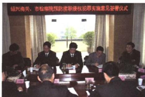
与绍兴市人民检察院签署《关于共同加强预防渎职侵权犯罪工作的实施意见》