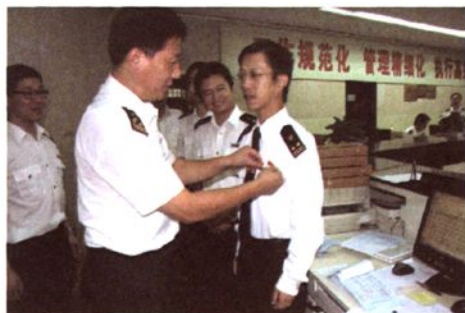
统一佩戴党徽上岗