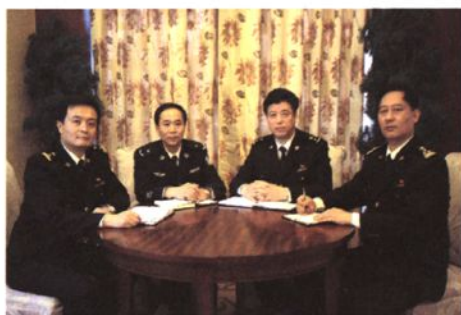
绍兴海关党组班子