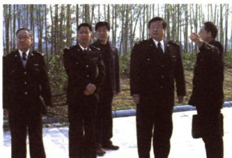
2005年12月，杭州海关原关长张志南（右二）到绍兴海关指导工作