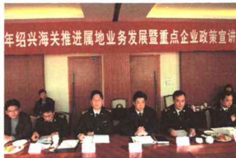
开展推进属地业务发展暨重点企业政策宣讲会