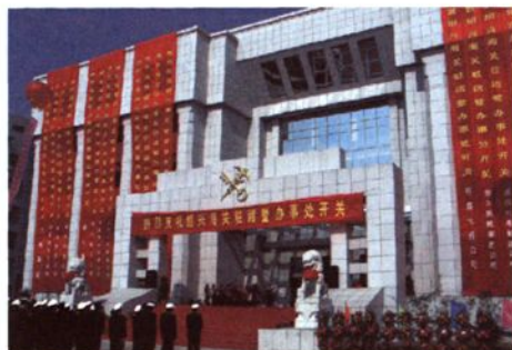
2005年11月，诸暨办事处开关仪式