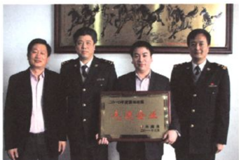
表彰属地纳税先进企业