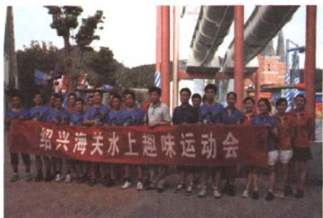
开展水上趣味运动会