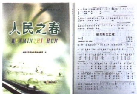
由陈钢作词的《绍兴海关之歌》由中国广播电视出版社公开发行