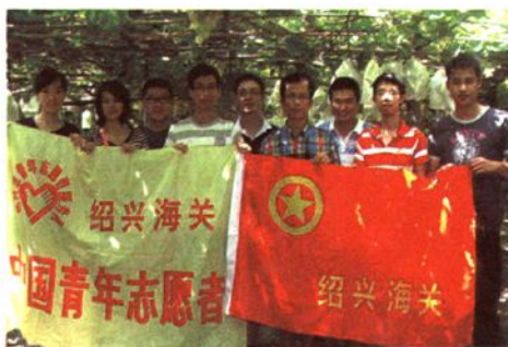
绍兴海关青年志愿者在行动