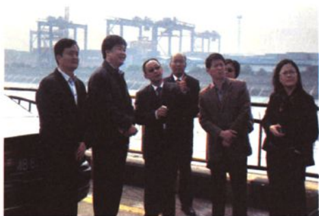
2010年11月，绍兴市副市长何中伟考察绍兴海关通关物流工作