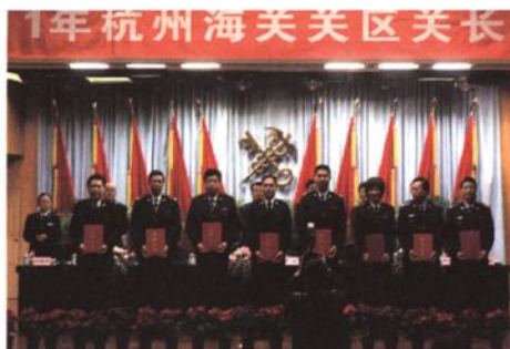
绍兴海关党组被评为2010年度优秀领导班子