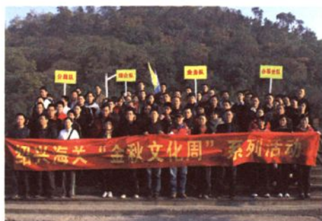
开展“金秋文化周”系列活动