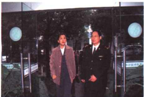
2007年11月，绍兴市纪委书记王文序到绍兴海关指导工作