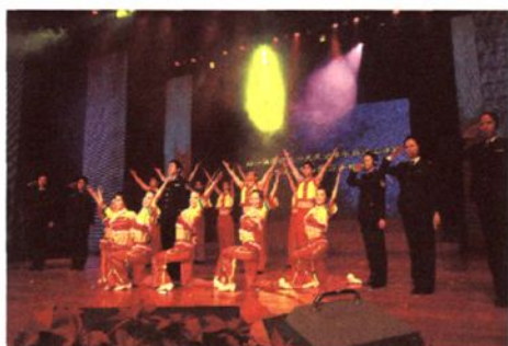
《绍兴海关绍兴情》在关区新春联欢会上精彩演出