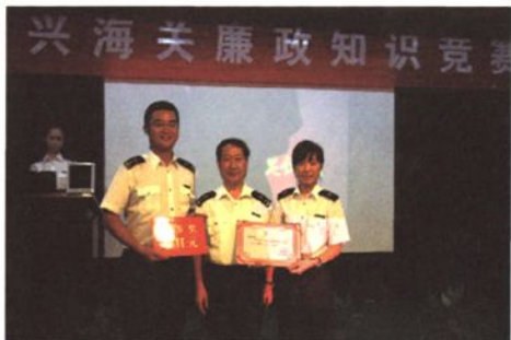
举办廉政知识竞赛