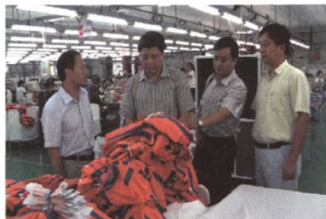
关领导走访调研辖区进出口企业