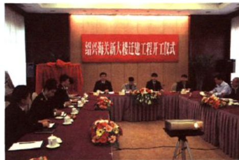
2011年4月，绍兴海关新大楼迁建工程开工仪式