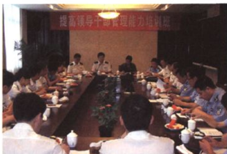
举办提高领导干部管理能力培训班