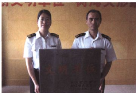
2009年，绍兴海关被评为省级文明单位