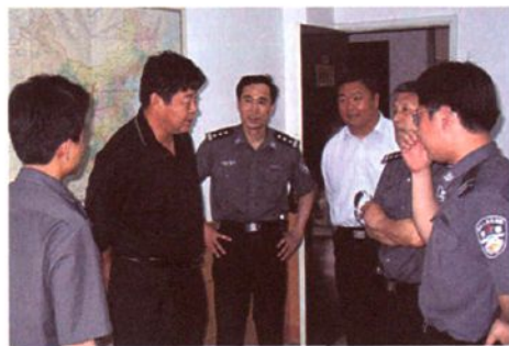
2004年5月，海关总署副署长吕滨（左二）视察绍兴海关缉私分局