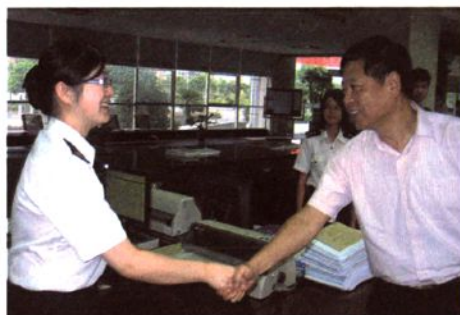
2010年8月，杭州海关原副关长史济越到绍兴海关指导工作