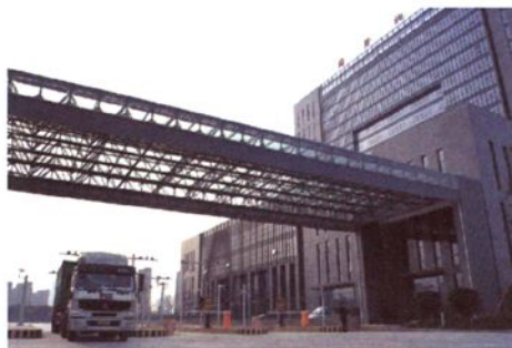
绍兴县中国轻纺城仓储物流中心海关监管点