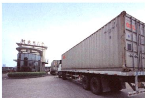
绍兴国际物流中心海关监管点