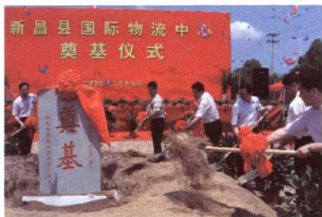
2010年6月，新昌县国际物流中心海关监管点奠基仪式