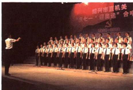
获绍兴市直机关“庆七一、迎奥运”合唱比赛二等奖