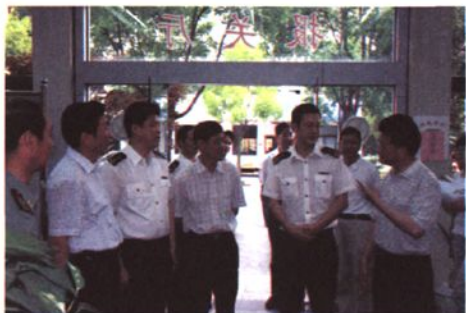
2009年5月，绍兴市人大代表视察绍兴海关