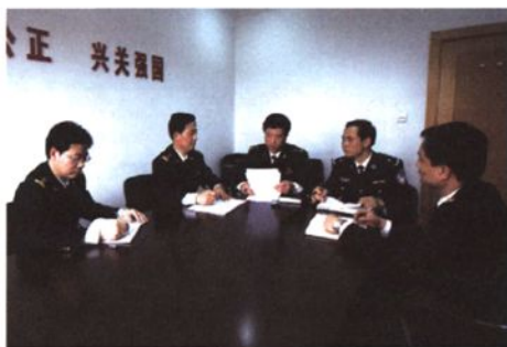
党组中心组学习贯彻两级关长会议精神