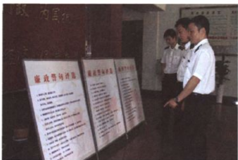
开展廉政警句评选