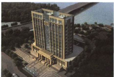
绍兴海关新大楼效果图