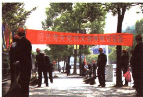
党员义务奉献日活动