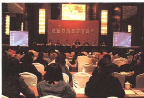
举办海关业务培训