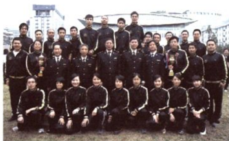
勇夺杭州海关建关30周年运动会团体第二名