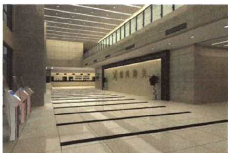
新大楼报关厅效果图