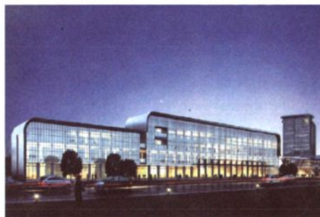
新昌县国际物流中心海关监管点效果图