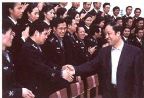
2003年4月，海关总署原署长牟新生视察绍兴海关