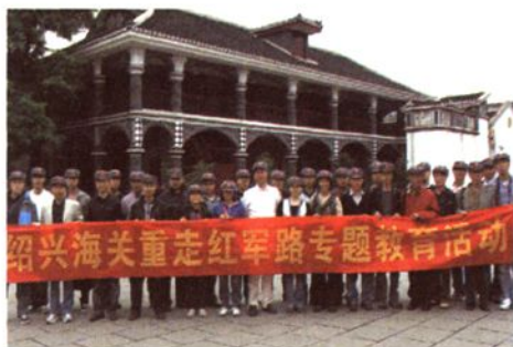
革命传统主题教育