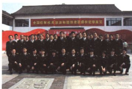
参观惩治和预防渎职侵权犯罪展览