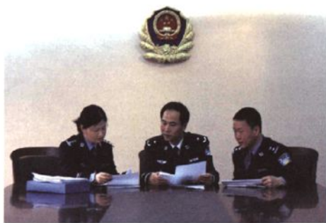
分局领导研究工作