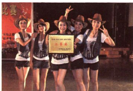
获绍兴市直机关女干部职工排舞比赛二等奖