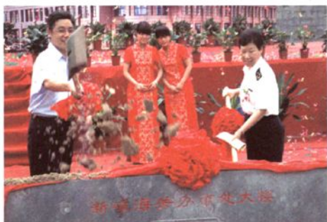
2010年6月，新嵛办事处（筹）大楼奠基仪式