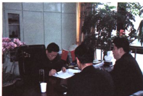
2009年3月，绍兴市市长钱建民听取绍兴海关工作汇报