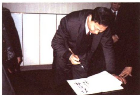
1994年1月，海关总署原署长钱冠林视察绍兴海关时为绍兴海关题词