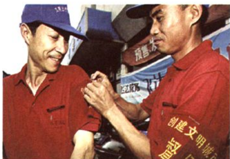
党员参加创建文明城市义务督导活动