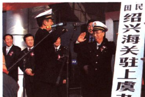
2005年11月，上虞办事处开关仪式