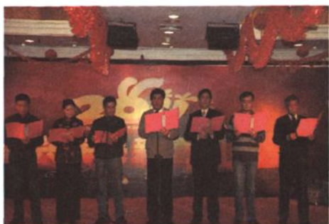
关局领导表演诗朗诵