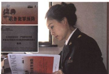
廉政建设经验介绍文章被《绍兴预防职务犯罪》刊载