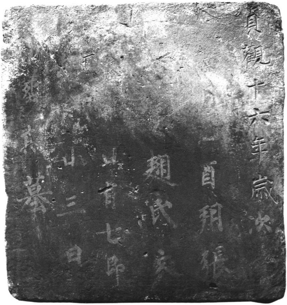
彩圖六 唐貞觀十六年(642)張隆悅妻鞠文姿墓表