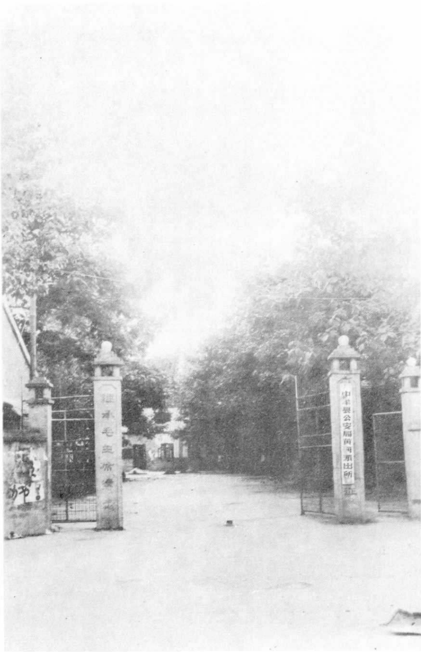
中牟黄河段机关西院大门