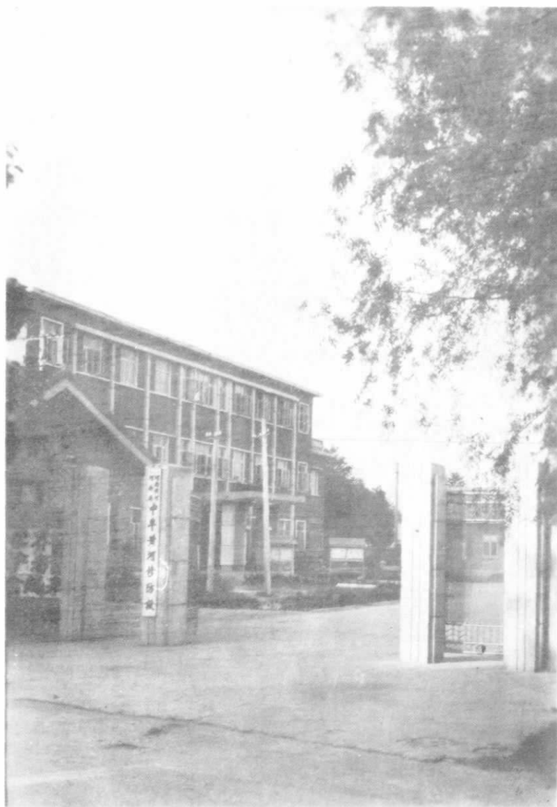
中牟黄河段机关东院大门