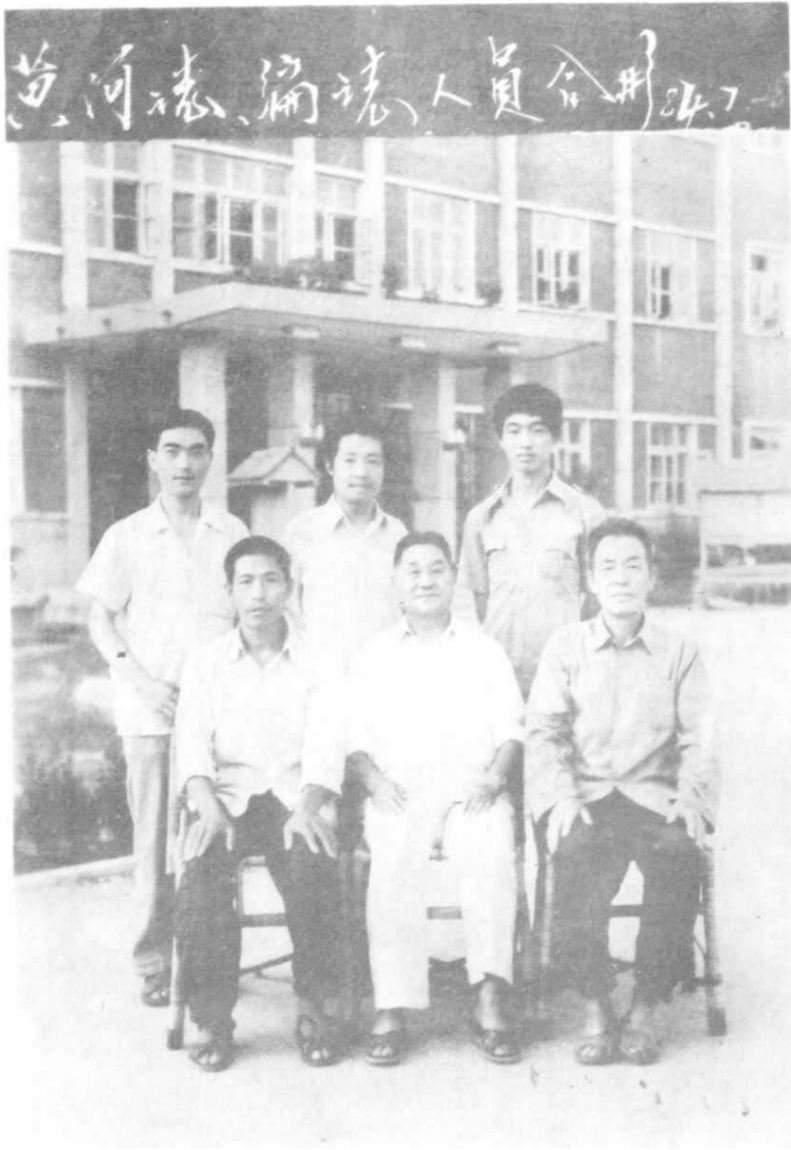
中牟黄河志编志人员合影