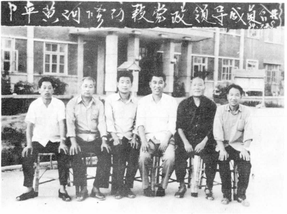
中牟黄河段党政领导成员合影