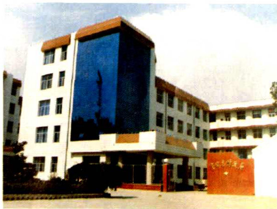
一九九七年新落成的财政局办公大楼