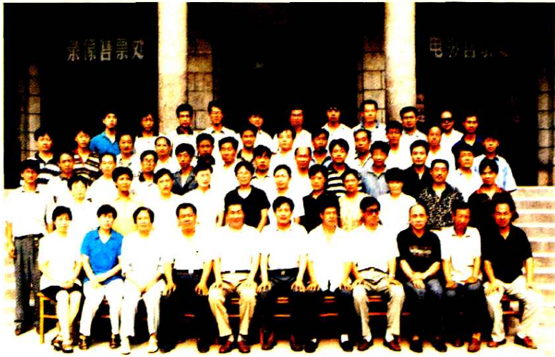
财政局全体工作人员合影