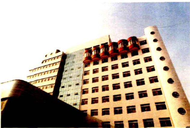
筹资兴建的科技大楼