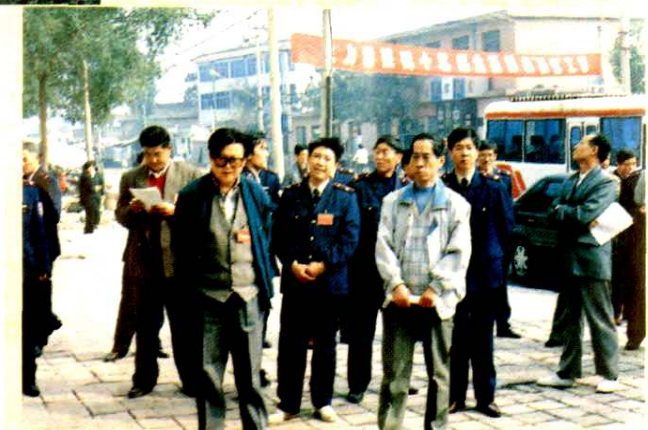
原地区国税局局长陈赵戟到基层检查工作