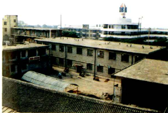
八十年代财政局办公旧址（府前广场）