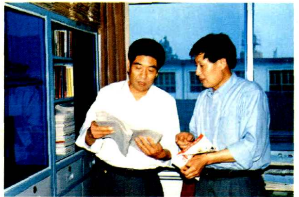
市财政局局长张传华到基层调研