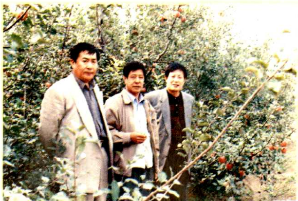
财政局班子调研农村经济