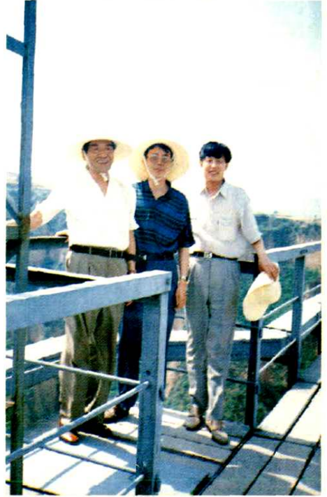
省、市、县三级财政领导考察财源建设项目