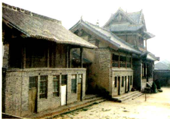
建国初期财政局办公旧址（城内小关帝庙）