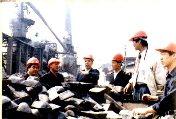
地税局领导到企业调研