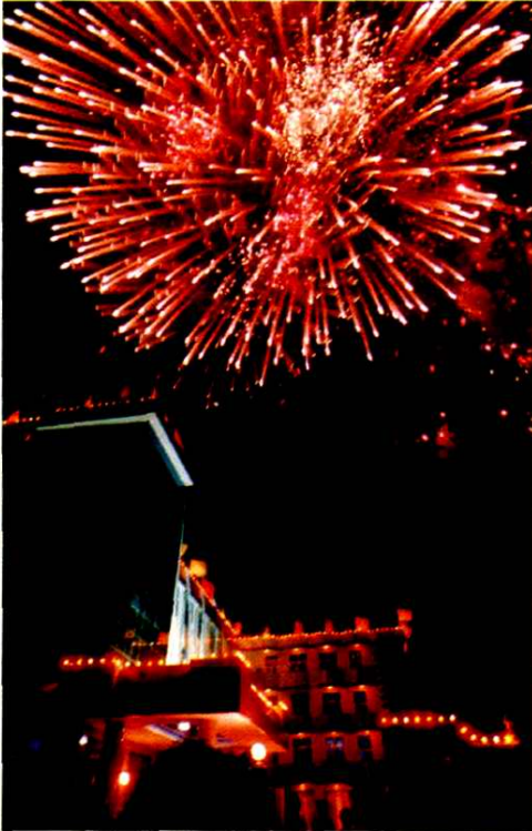
新建财政办公大楼夜景