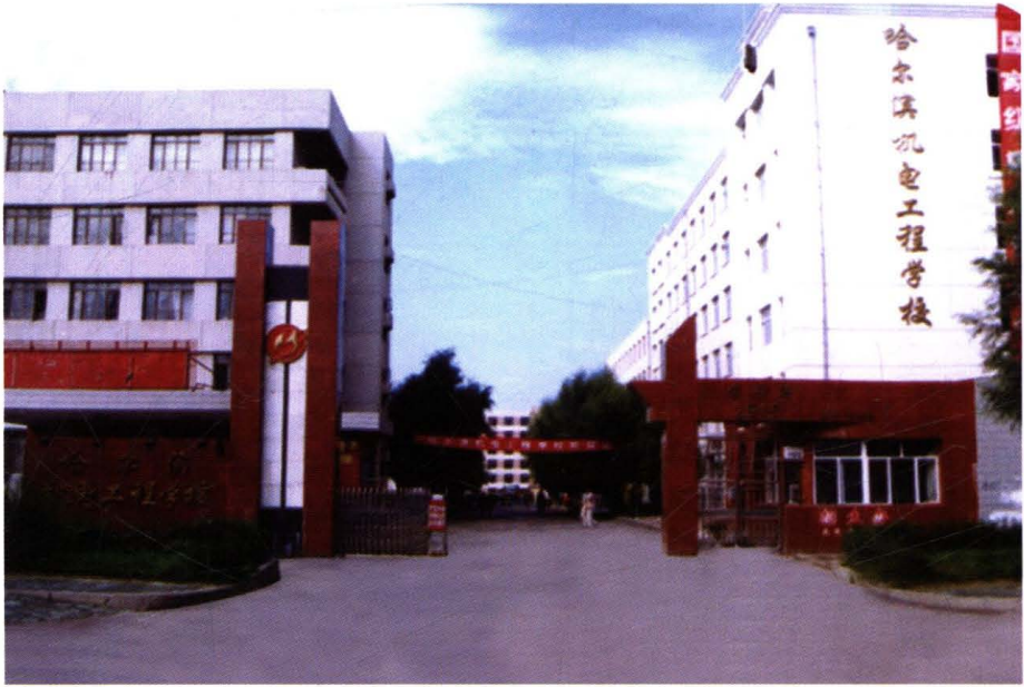
哈尔滨市机电工程学校原址（1999年）