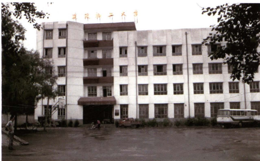
哈尔滨市建设职工大学原址（1989年）