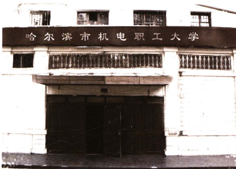
哈尔滨市机电职工大学原址（1990年）