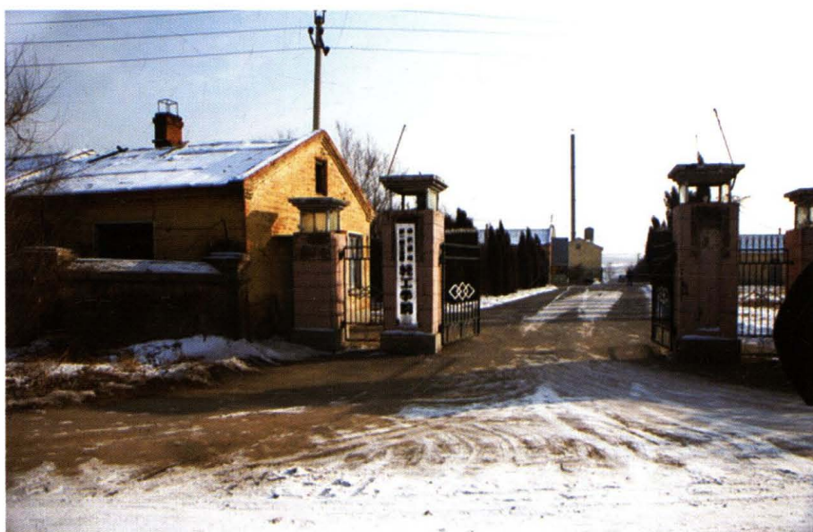
哈尔滨市职工轻工学院原址（1983年）