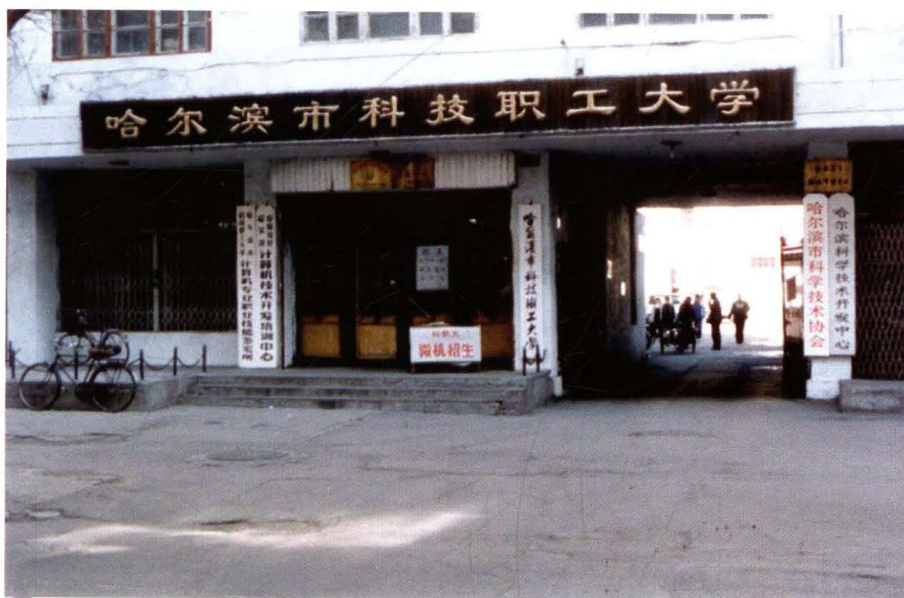
哈尔滨市科技职工大学原址（1984年）