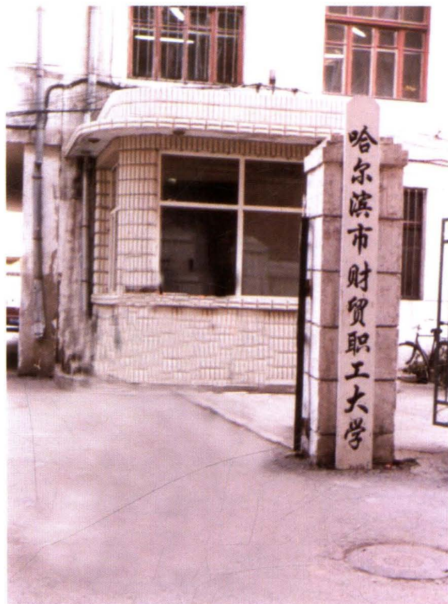
哈尔滨市财贸职工大学原址（1981年）