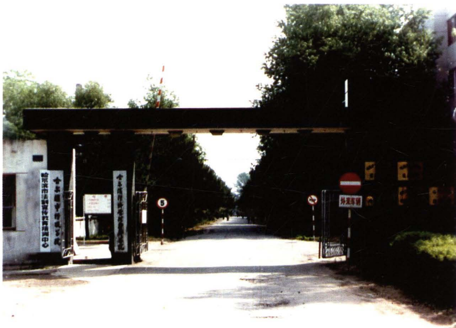
哈尔滨市经济管理干部学院原址（1989年）