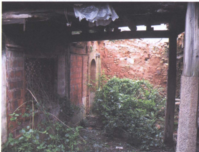
插图：惠安庄氏旧民居