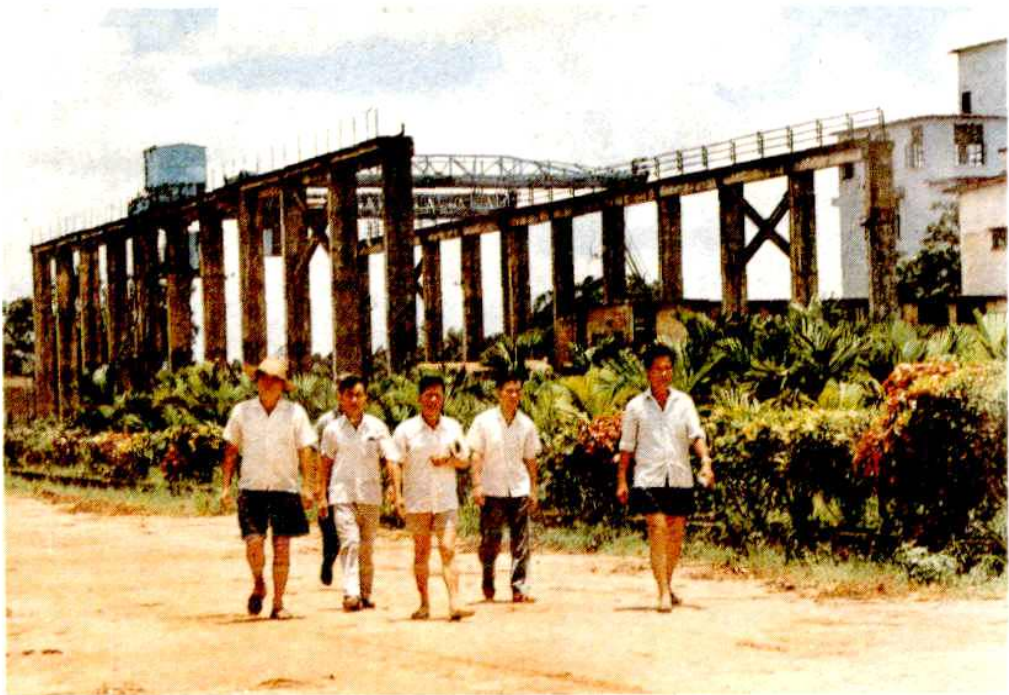
琼山县甲子糖厂领导成员深入车间