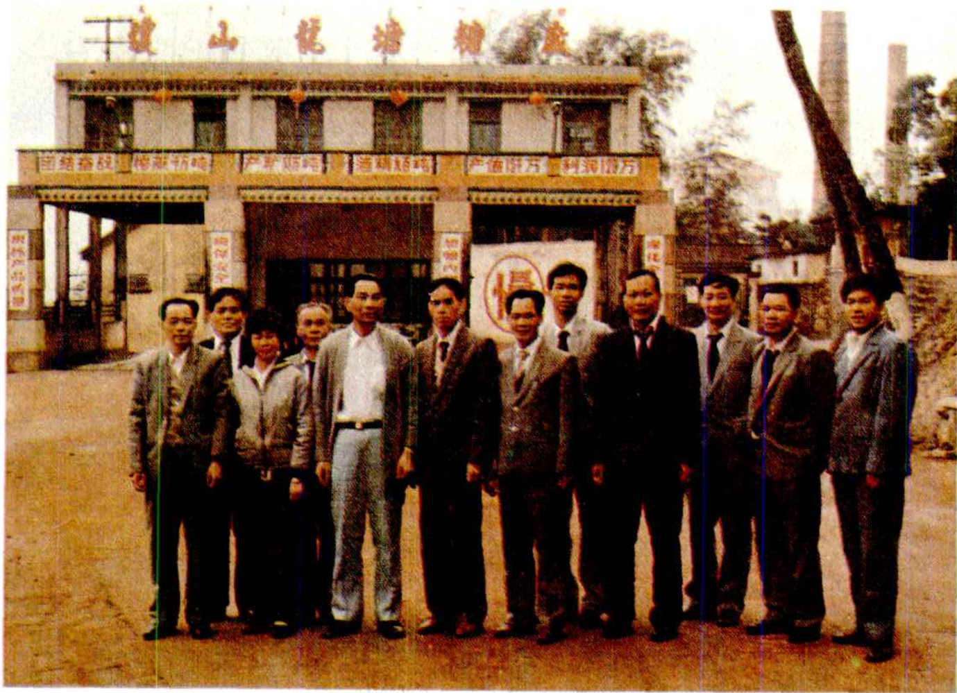
海南省副省长王越丰（前左三）、中共琼山县委书记林尤芳（前左四）、副县长林莲花（前左二）、县经委主任王科洋（前左一）于1988年春节到龙塘糖厂慰问生产工人后同该厂领导留影