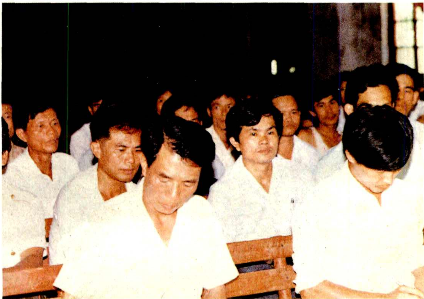
琼山县红旗糖厂召开职工代表大会，共商榨季生产方案