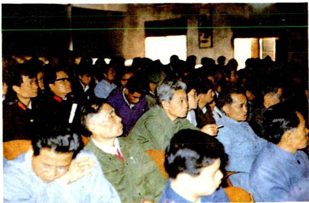
表彰大会会场一角