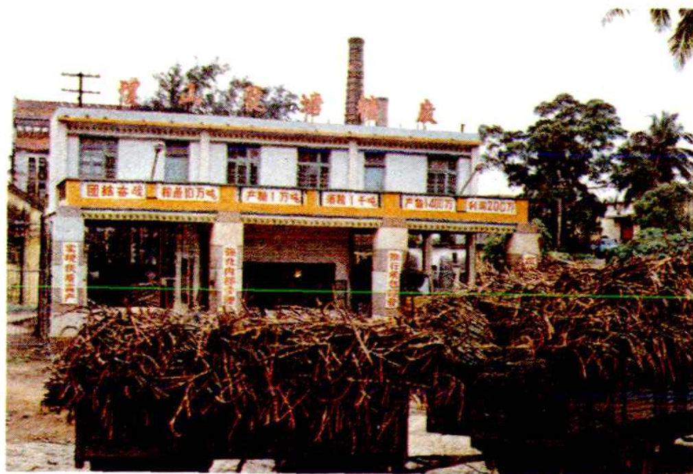
琼山县龙塘糖厂榨季生产期间，甘蔗缓缓进场