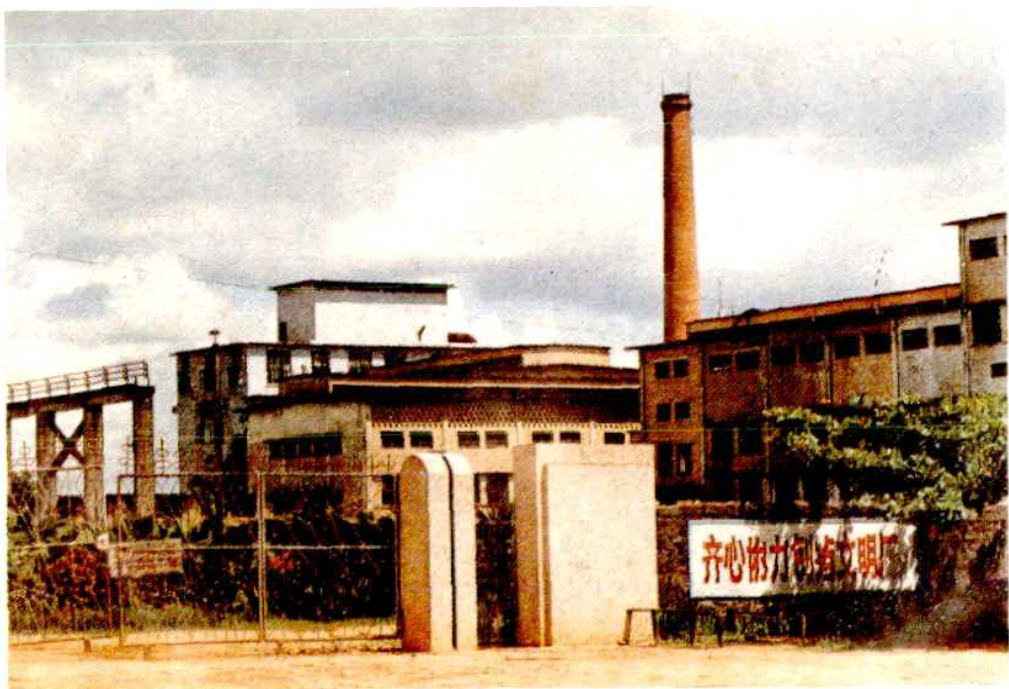
琼山县甲子糖厂生产车间