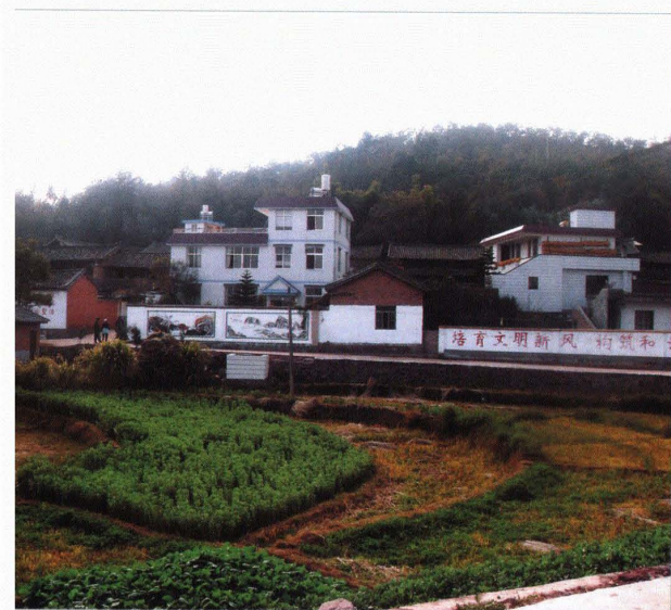
苍岭镇马石铺村外景