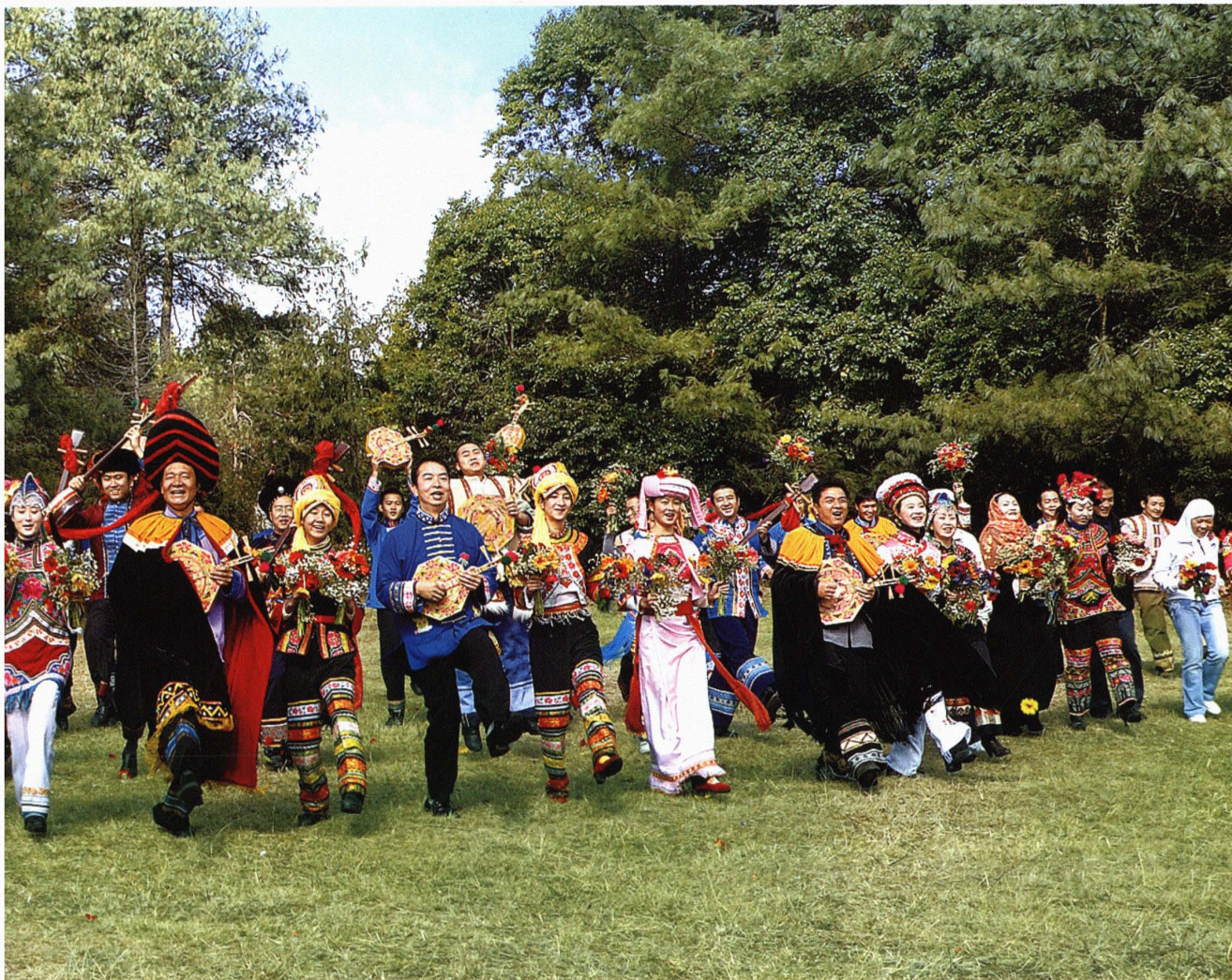
各民族大团结歌舞联欢