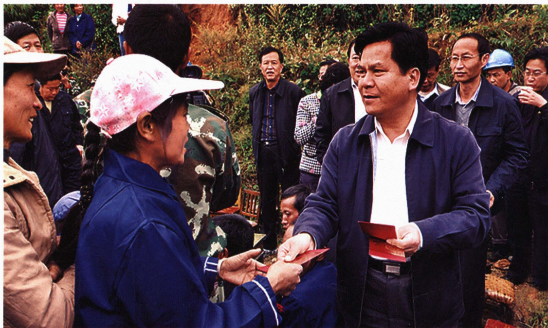
中共云南省委副书记李纪恒亲赴灾区慰问灾民