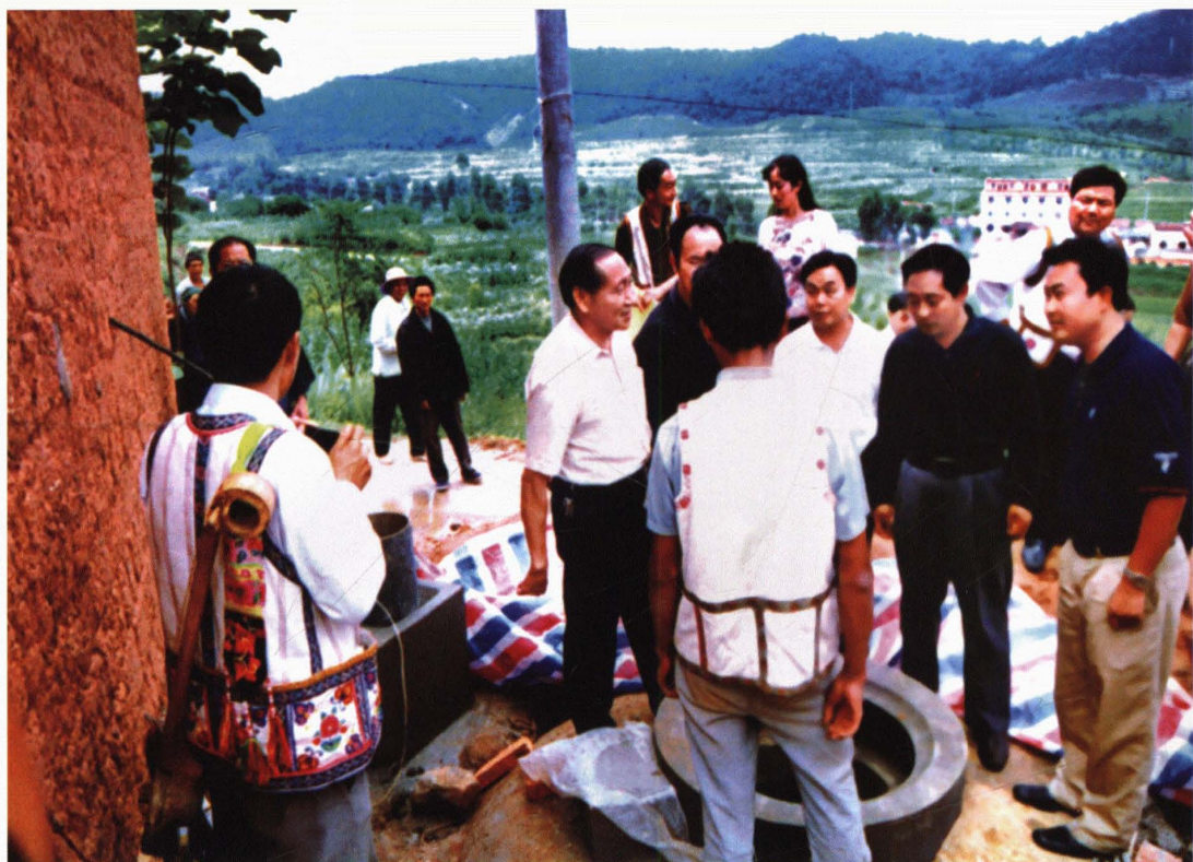
省委常委、常务副省长罗正富到紫溪彝村调研民族工作