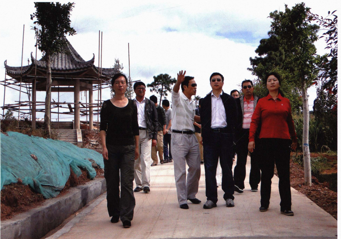
州长李红民到楚雄市调研紫溪彝村特色村寨建设工作