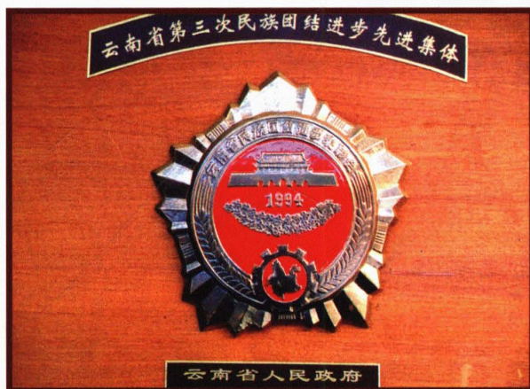
1994年11月，楚雄市民委被云南省人民政府表彰为“全省民族团结进步模范集体”