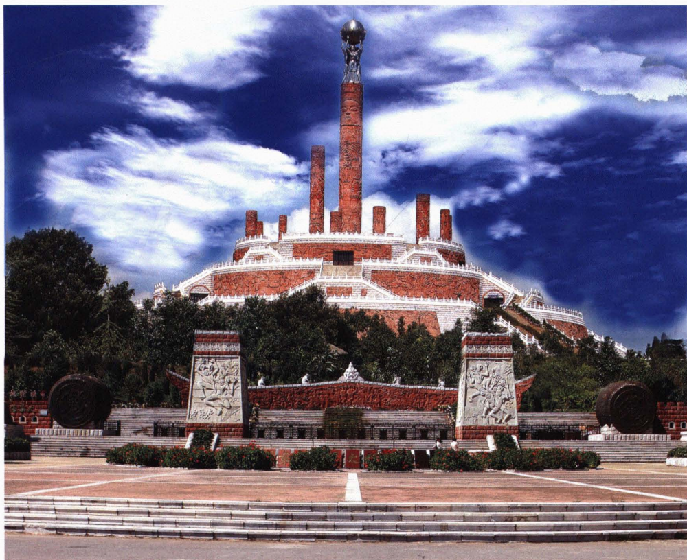
中国彝族十月 太阳历文化园