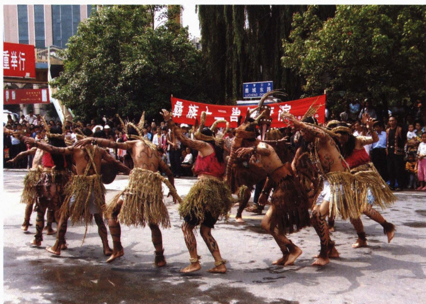
彝族十二兽舞表演