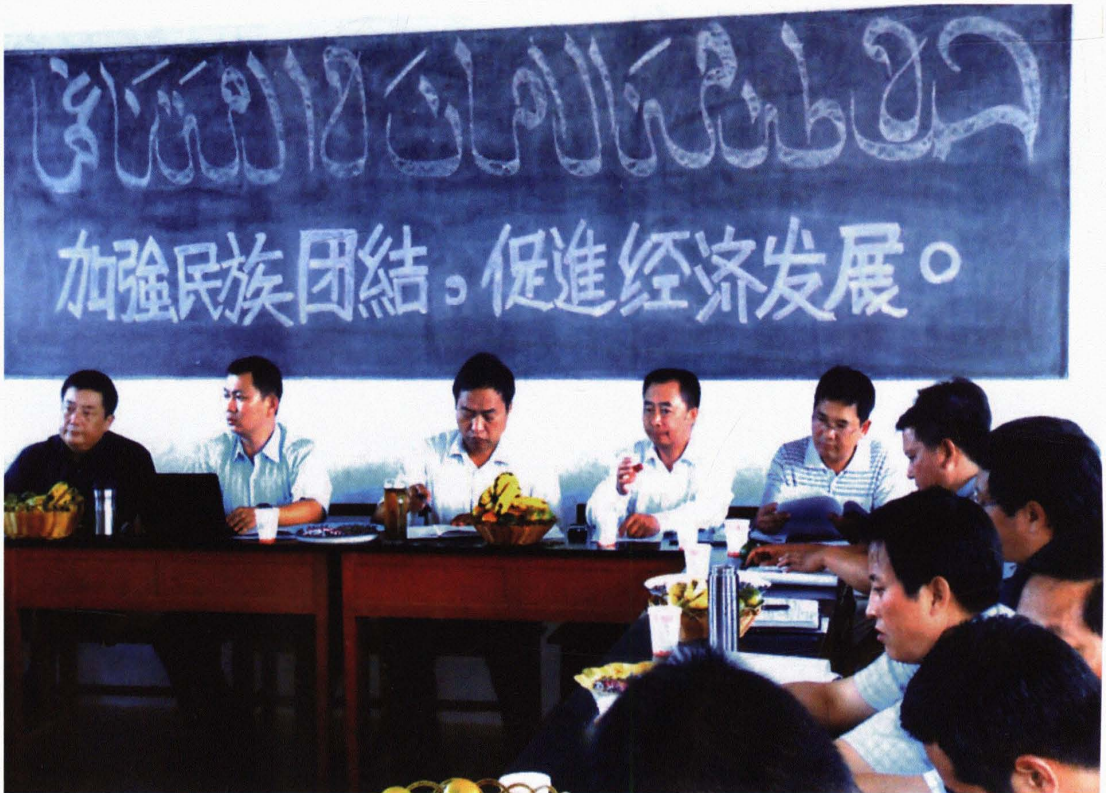
市四班子主要领导到苍岭镇黄草村委会罗苴美九队研究民族工作