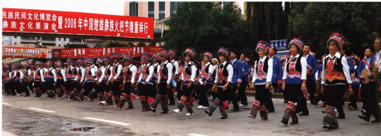
第二届云南民族民间文化博览会,首届中国彝民族文化展演会暨 2006 年中国楚雄彝族火把节迎宾仪式民族文艺队伍