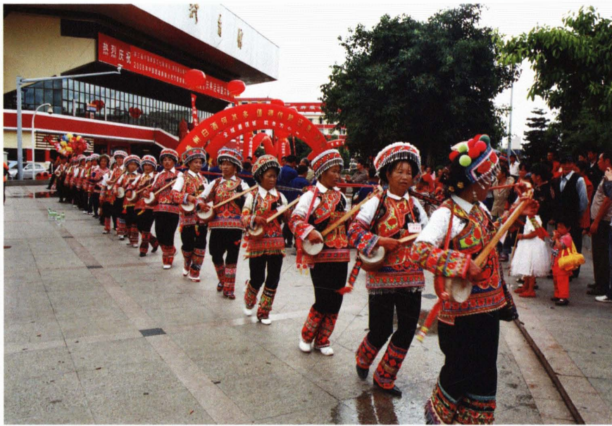
彝族妇女同胞表演大三弦舞