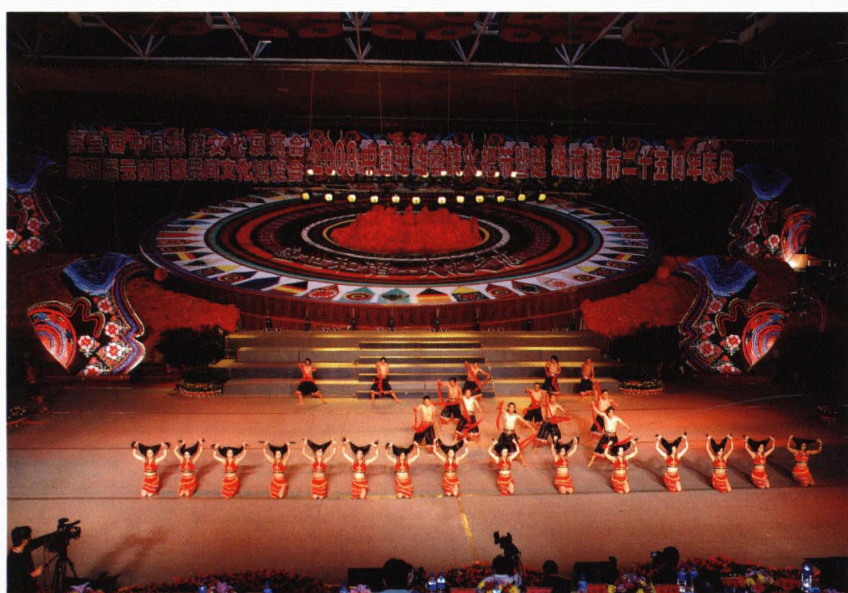
“两会一节”暨楚雄市 建市 25 周年庆典