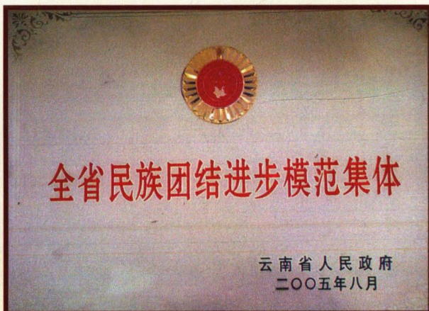
2005年8月，楚雄市民宗局被云南省人民政府表彰为“全省民族团结进步模范集体”