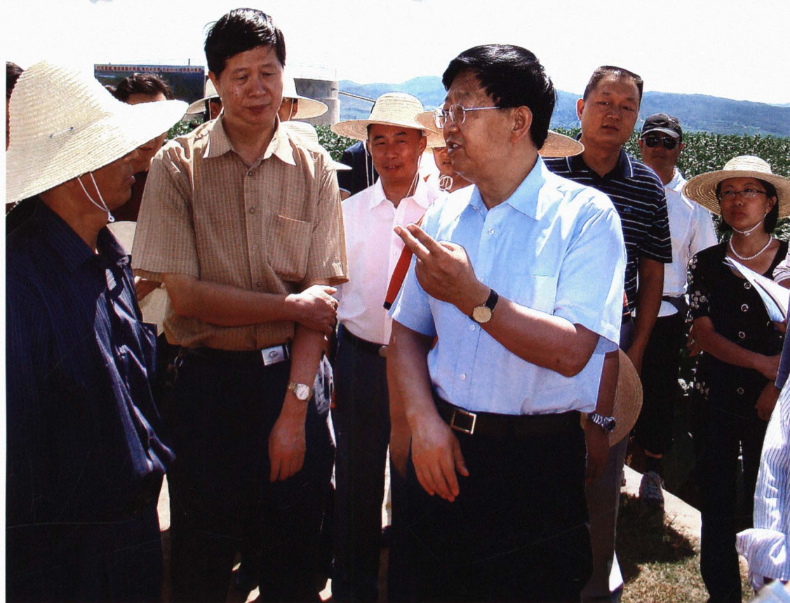
中共云南省委书记白恩培深入楚雄市调研