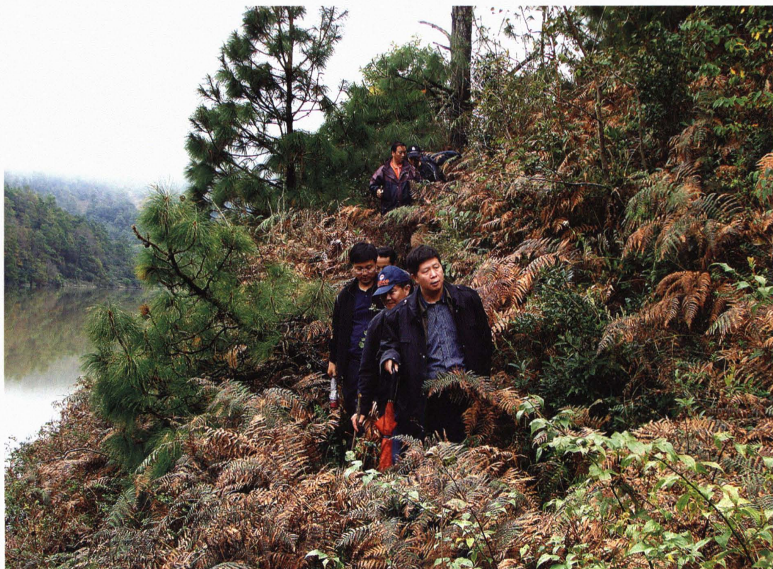
中共楚雄州委书记邓先培奔赴西舍路重灾区