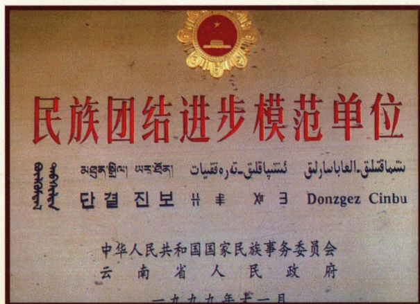
1999年11月，楚雄市民宗局被国家民委、云南省人民政府表彰为“民族团结进步模范单位”