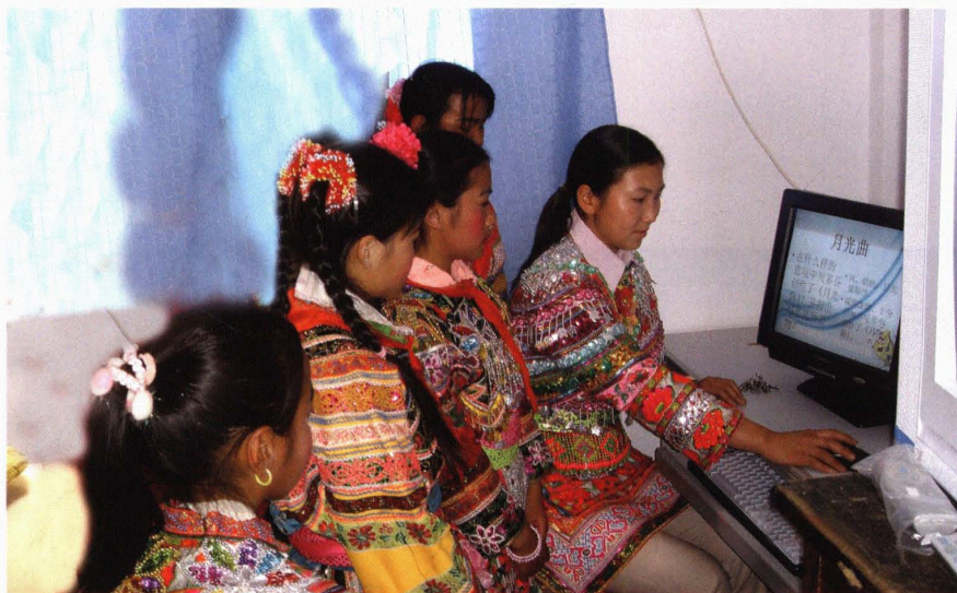
彝族小学生在学习电脑