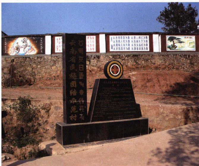
民族团结示范村标志牌