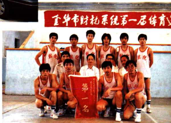
1989年7月在金华市财税系统第一届运动会上获男篮第一名