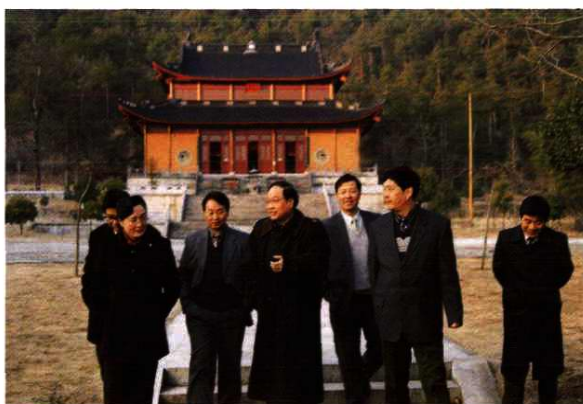
原省财政厅厅长翁礼华考察浦江仙华山