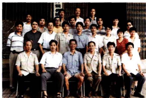
1997年8月，原浦阳所国地税分设前干部职工