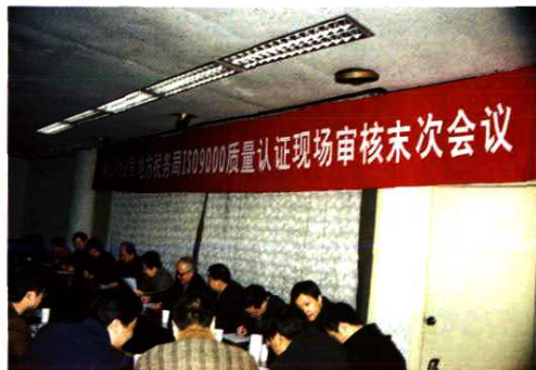
2002年12月，通过ISO9000质量认证