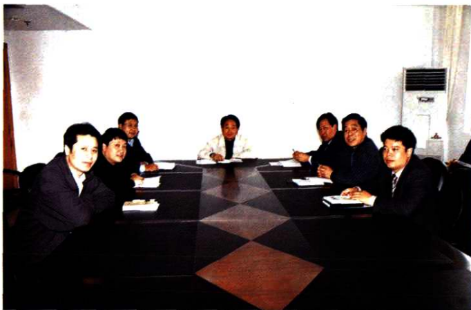
局领导班子成员 (2003年3月)