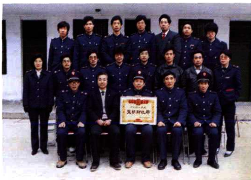
1992年2月，原浦东所干部职工合影