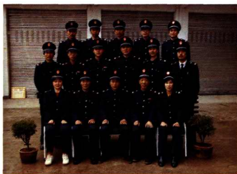
1993年12月，原城关所干部职工