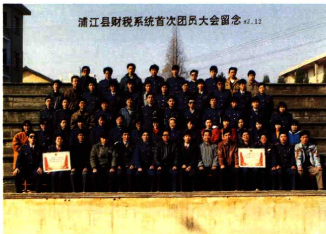
1992年12月，浦江县财税系统首次团员大会留念