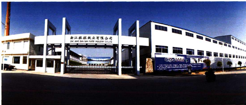
浙江班班纸业有限公司