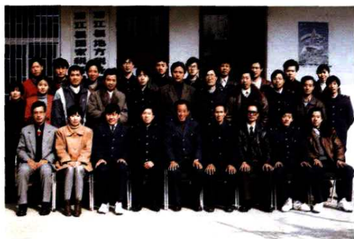
1996年12月，原黄宅所干部职工