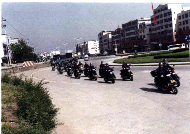
摩托车巡回宣传税法