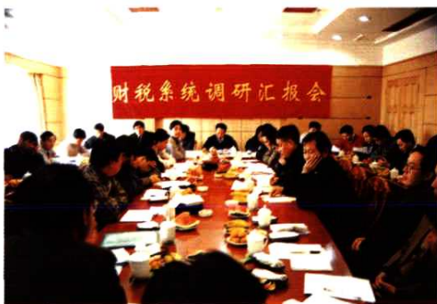
2001年11月，召开财税系统调研汇报会