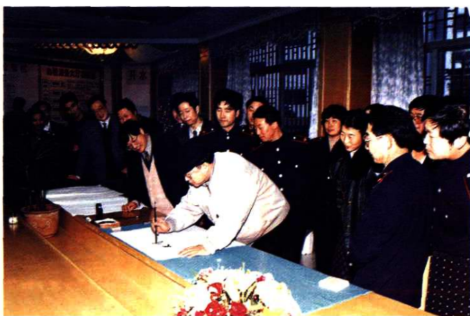
项怀诚同志题词：“文明办税、秉公执法”