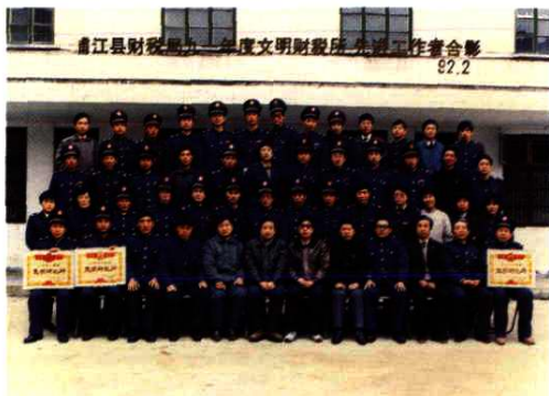
1992年2月，浦江县财税局1991年度文明财税所、先进工作者合影