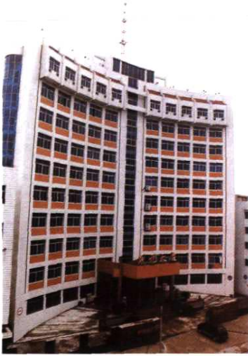
原财税大厦（人民东路128号）