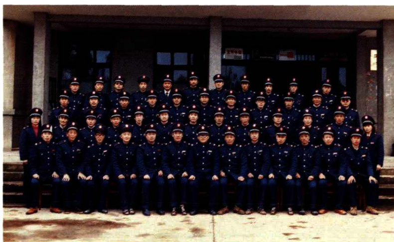
1990年2月，浦江县第一届税务学会全体会员合影