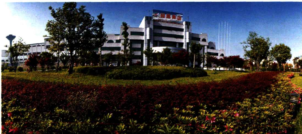
浙江恒昌工贸集团有限公司