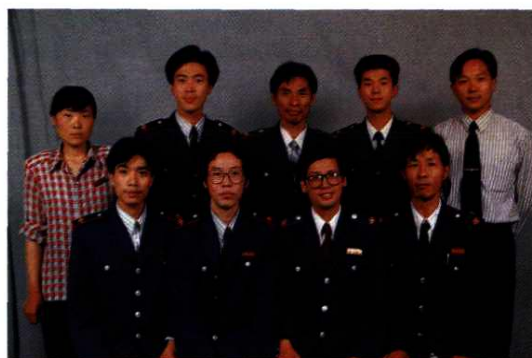
1997年2月，原平湖所干部职工