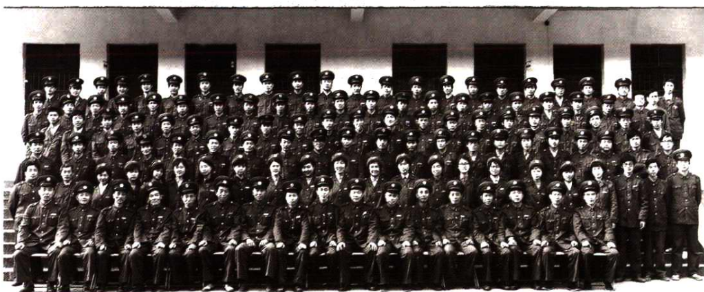
1987年全系统财税干部职工合影留念