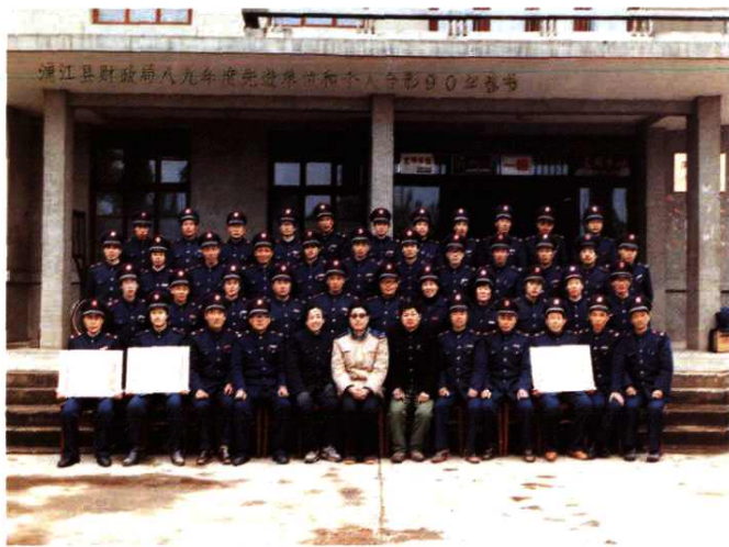
1990年春节，浦江县财税局1989年度先进单位和个人合影