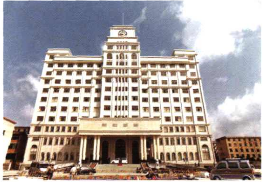
现办公大楼（东山路76号）