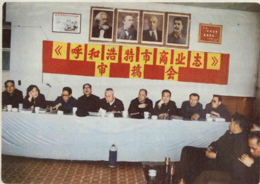
《商业志》审稿会主席台