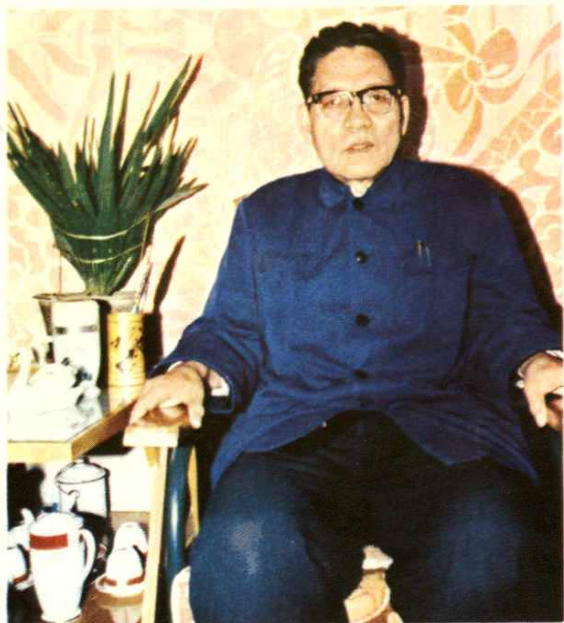
唐志高 曾任呼市副市长、 市人大常委会付主任