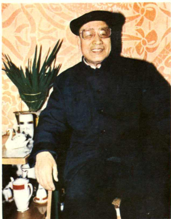
曹文玉 曾任呼市市委副书记、 内蒙财办副主任。