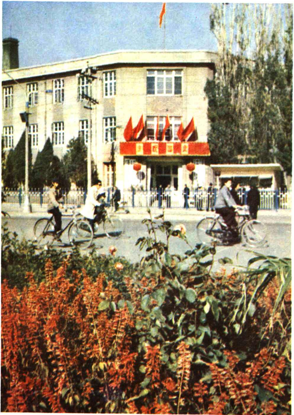
呼和浩特市商业局办公大楼