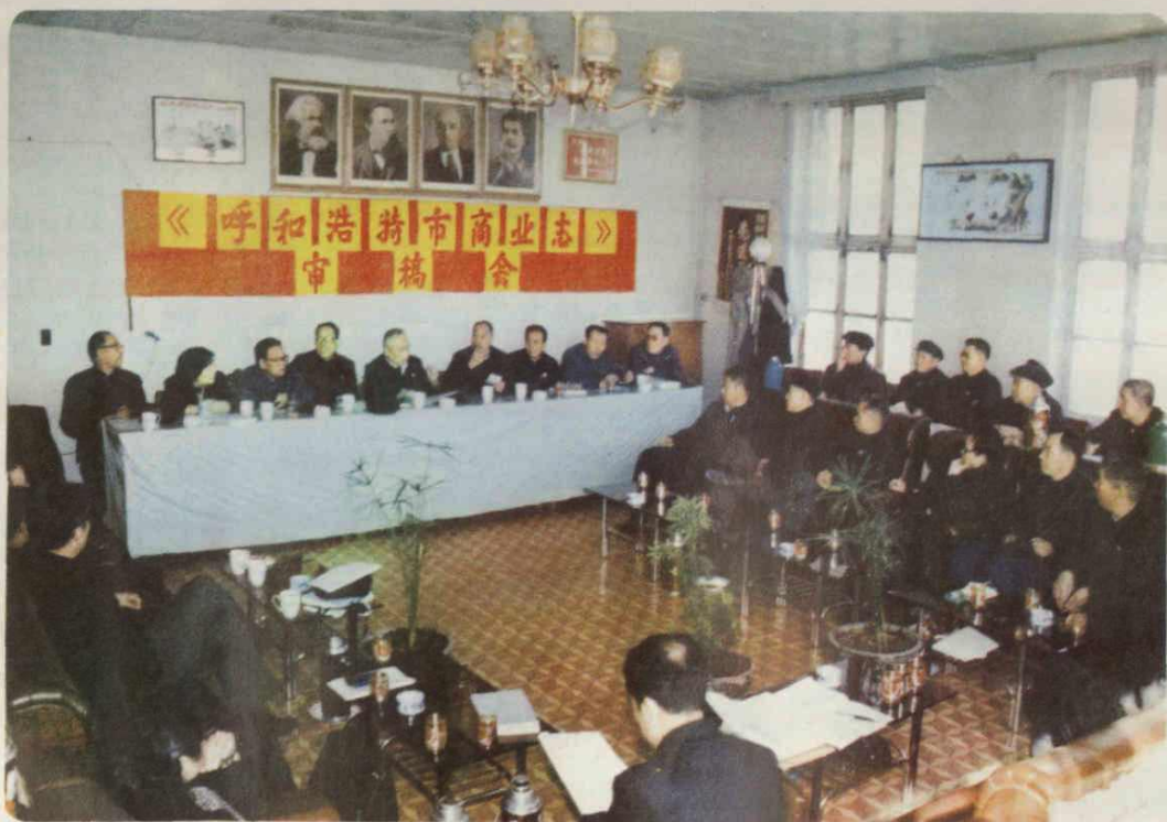
《商业志》审稿会会场