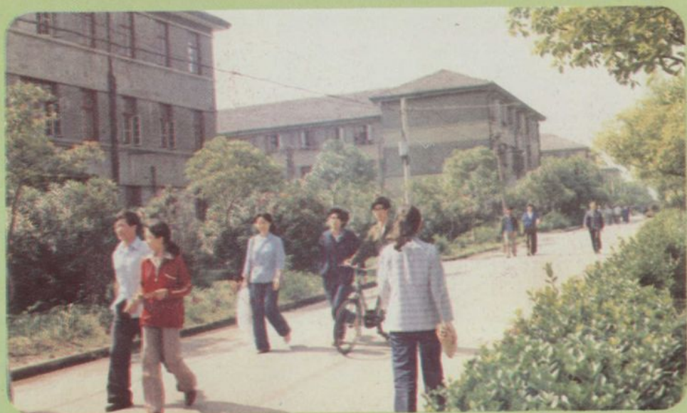
1957年前建成的教学大楼