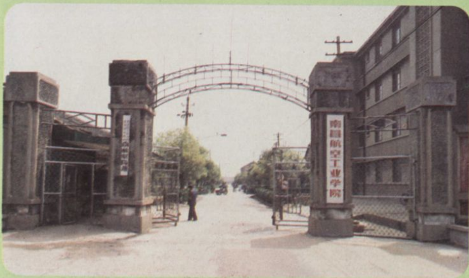
南昌航空工业学院大门（1985）