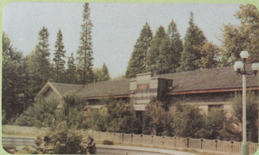
汉口航空工业学校校部办公室（1952）