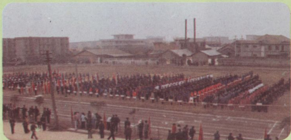
田径运动会开幕式 (1982)