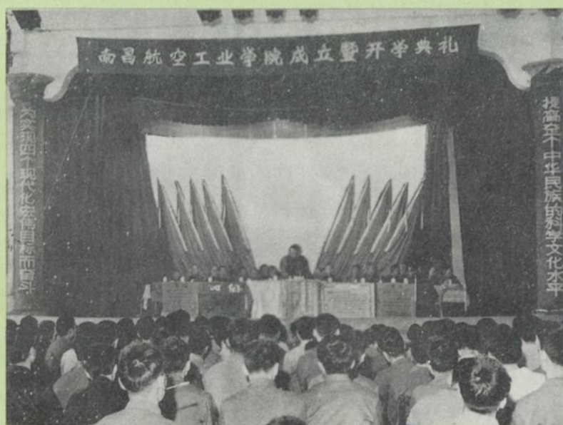
学院成立暨开学典礼（1978）