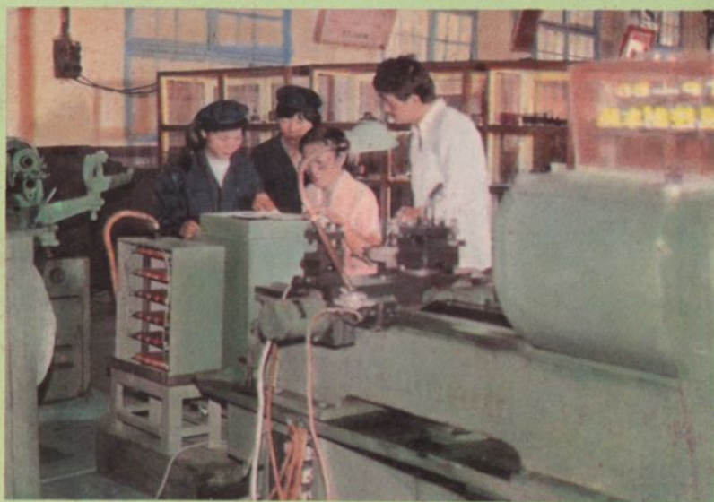
学生在进行数控车床编程实习（1985）