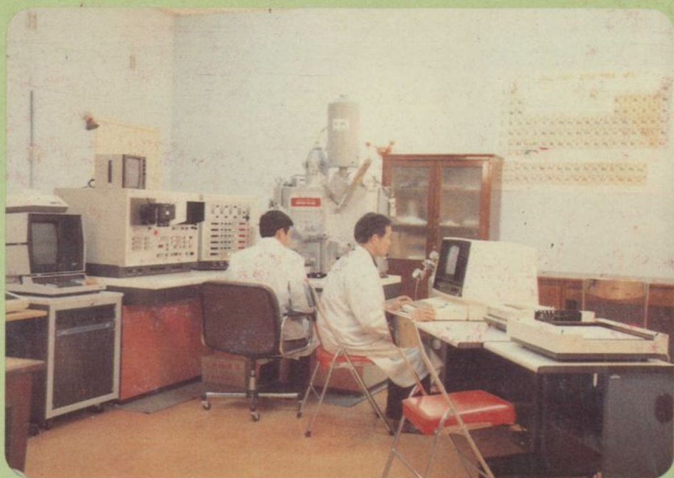
实验室一角——电子探针室（1984）