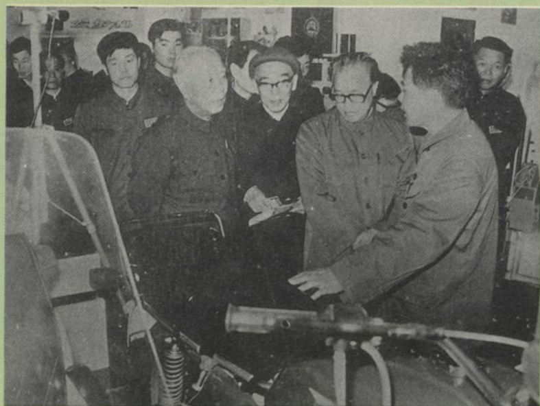
赵紫阳、万里等党和国家领导人参观 全国新产品展览会展出的校办工厂生 产的长江750A 型摩托车（1983）