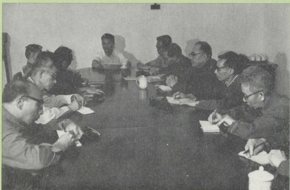
学院主要领导人召开部分老教师座谈会（1981）