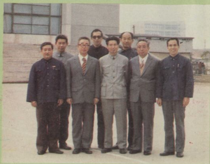
学院部分领导同志合影（1985）