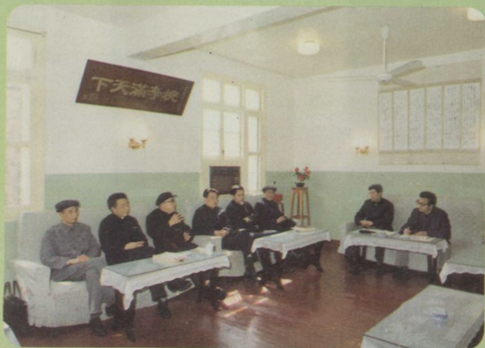
院史编审领导小组在研究工作