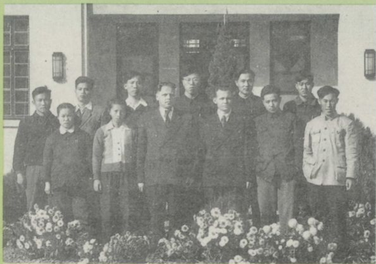
苏联专家与专家工作办公室人员合影 (1956)

自力更生奮發圖強艱苦奮鬥勤 儉辦校為建成一個具有現代工 業現代農業現代科學文化和現代國 防的偉大的社會主義國家而奮 鬥 南昌航空工業學校 成立十週年紀念 邵式平題