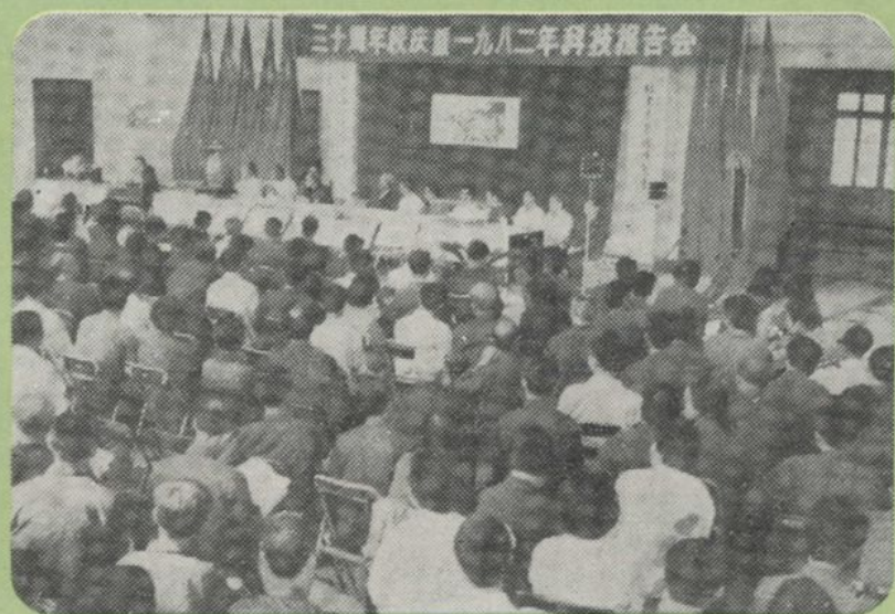
三十周年校庆暨科技报告会（1982）