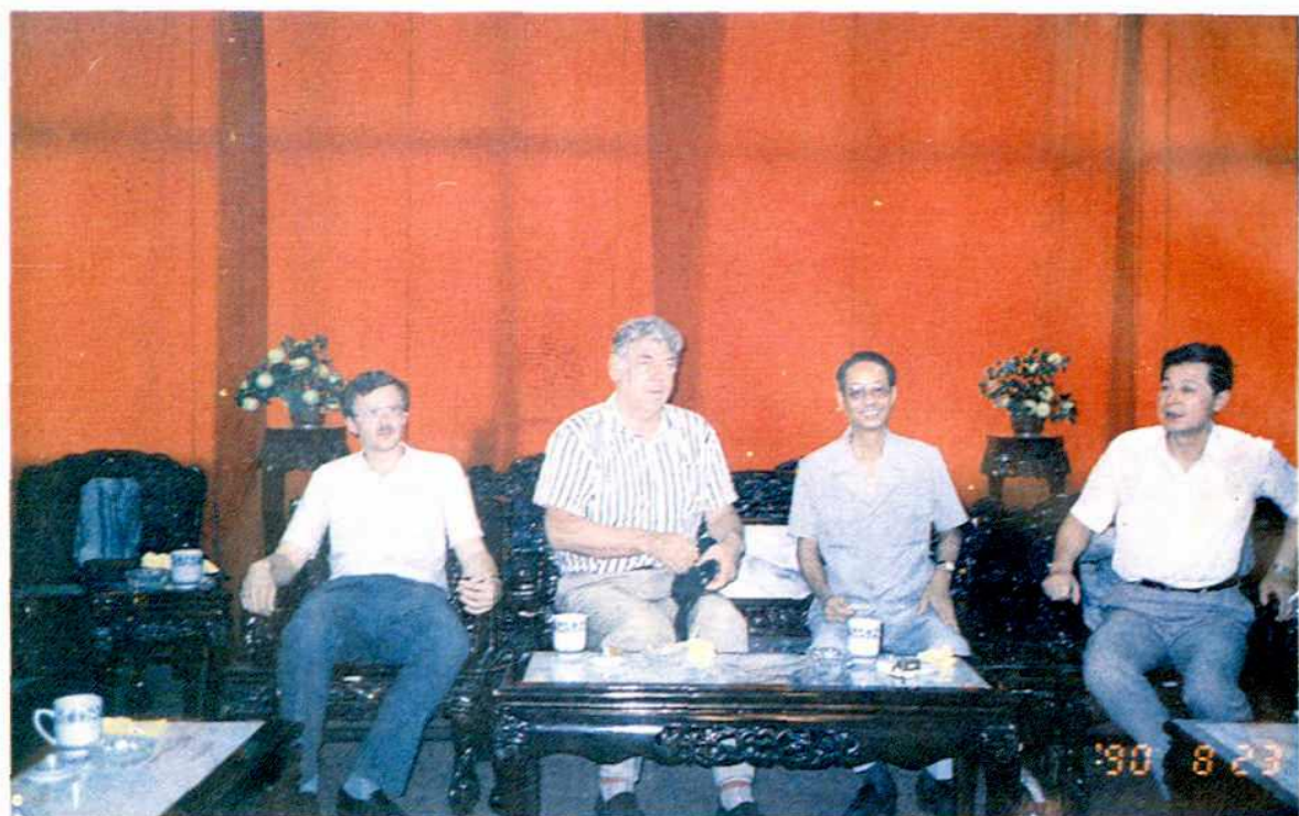
1990年苏联经贸代表团访问南昌