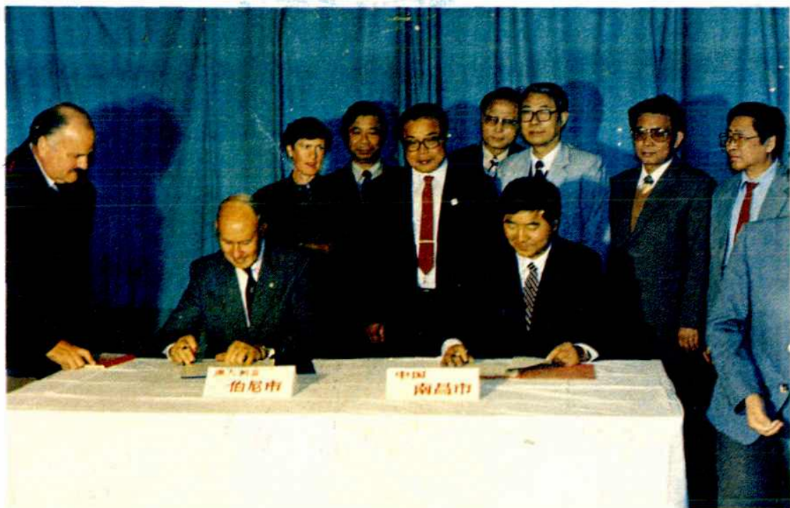
1988 年程安东市长与澳大利亚塔斯马尼亚州伯尼市市长雷克斯·考林斯签署友好交流备忘录