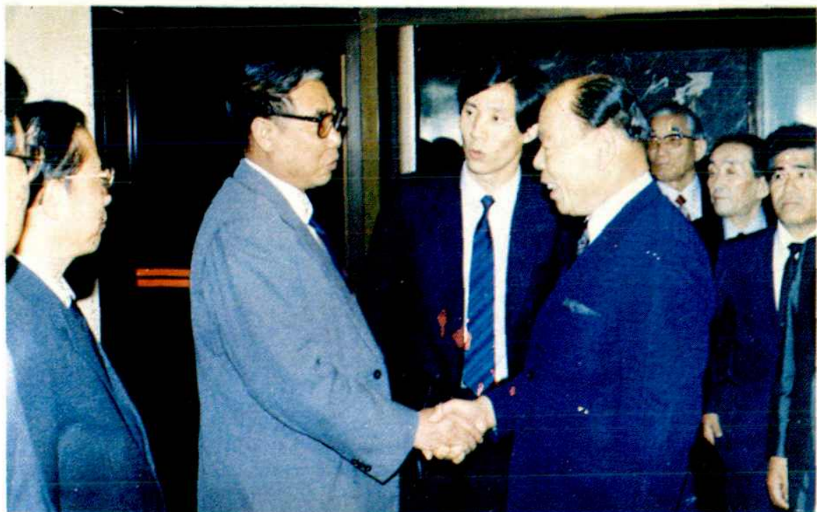
1990年日本高松市代表团访问南昌