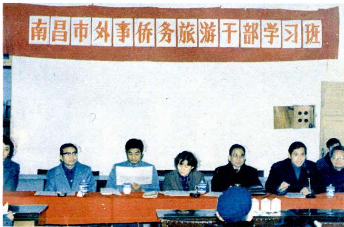
1988 年南昌市外事、侨务、旅游干部学习班