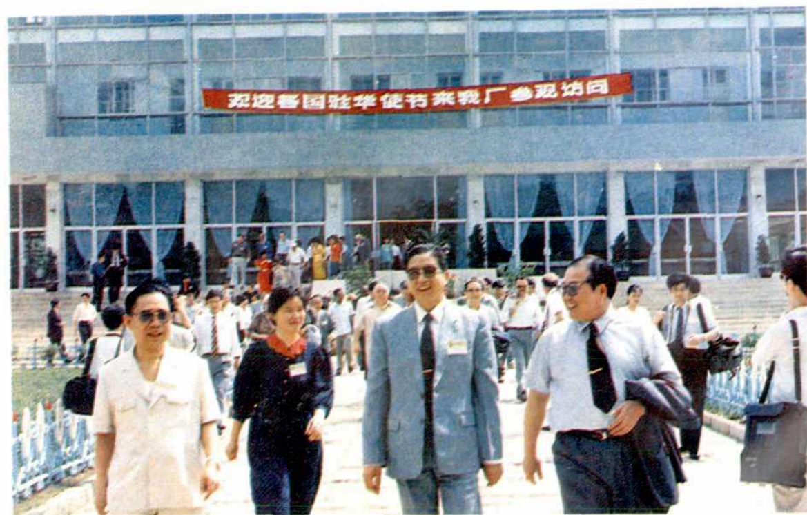
1988年各国驻华使节来南昌参观