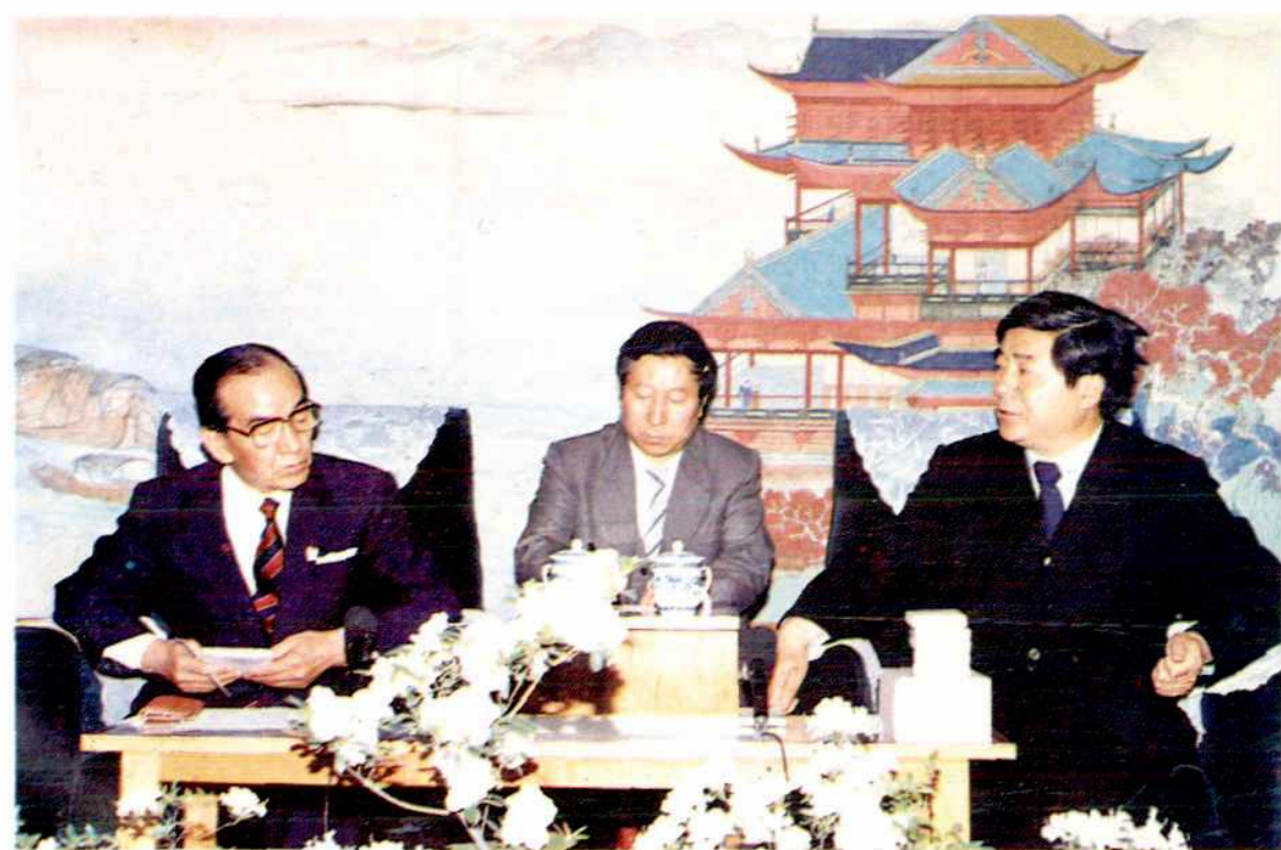
1989年日本高松市代表团访问南昌