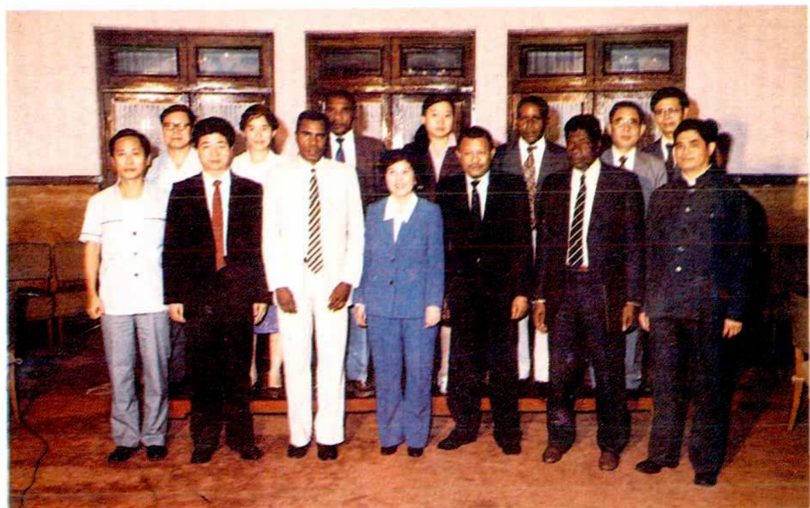
1989年马达加斯加外宾访问南昌