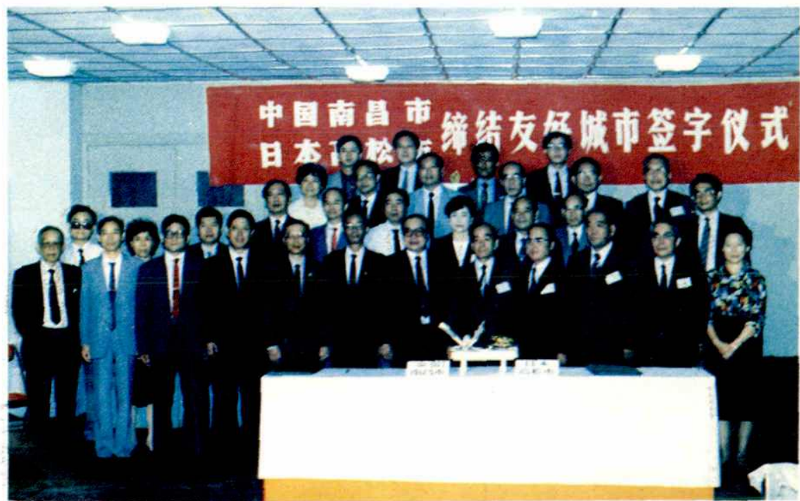
1990年日本高松市胁信男市长率团来南昌签订友城议定书