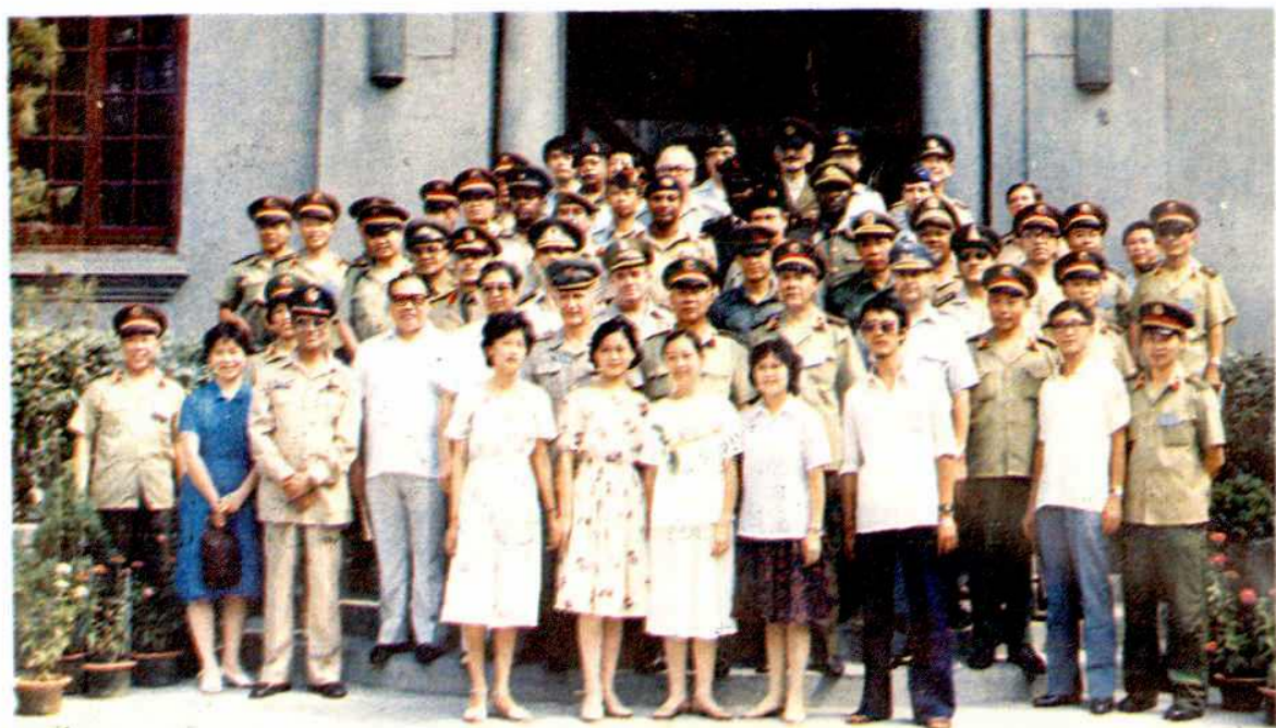
1988年各国驻华武官来南昌参观合影