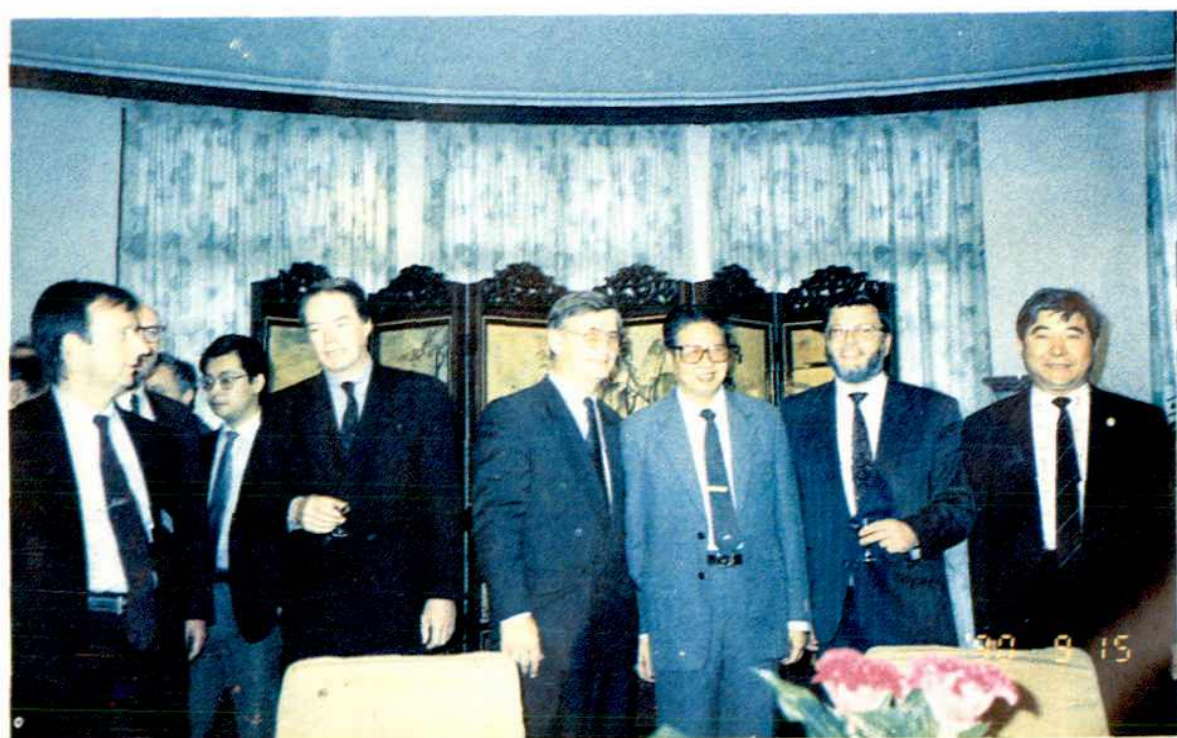
1990年德国黑森州经济代表团访问南昌