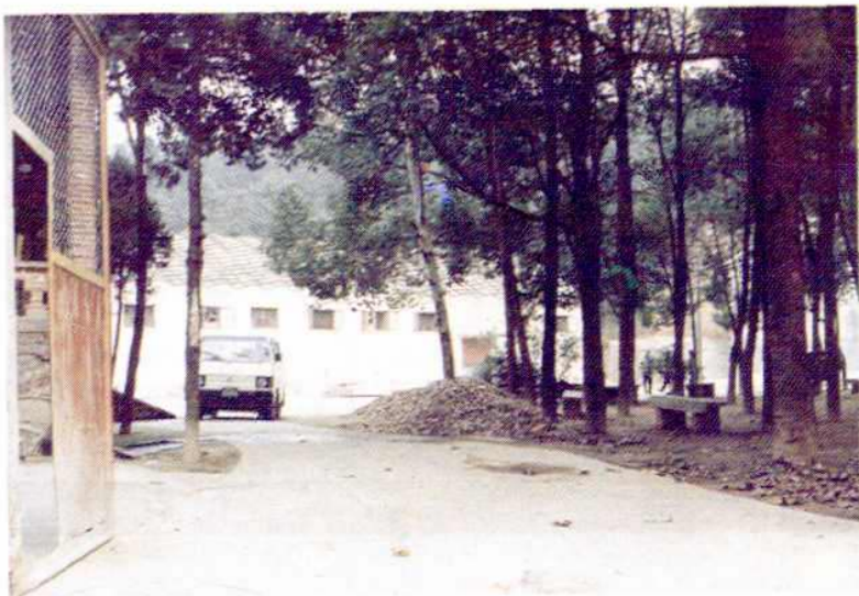
◀ 园林式的石坝仓库