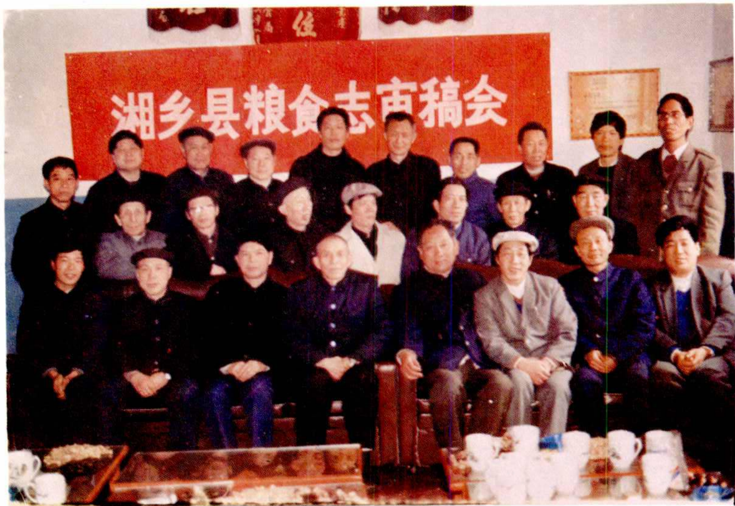
▲《湘乡粮食志》审稿会全体人员合影