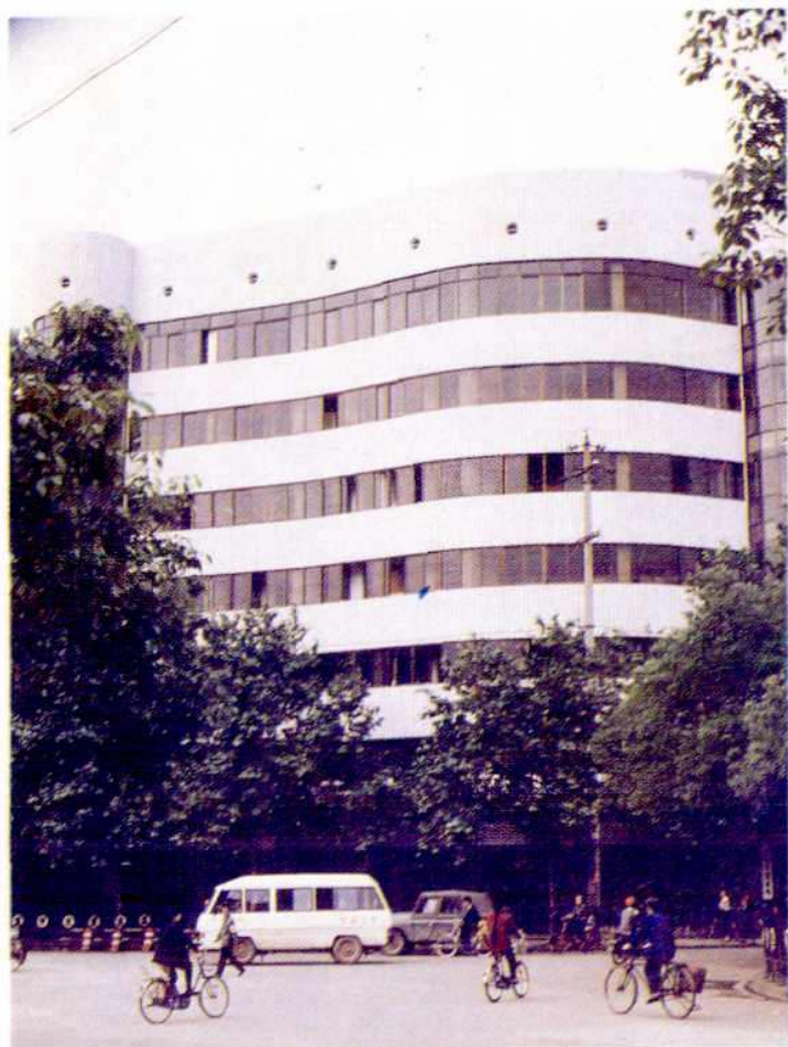
◀ 湘乡市粮食局办公楼