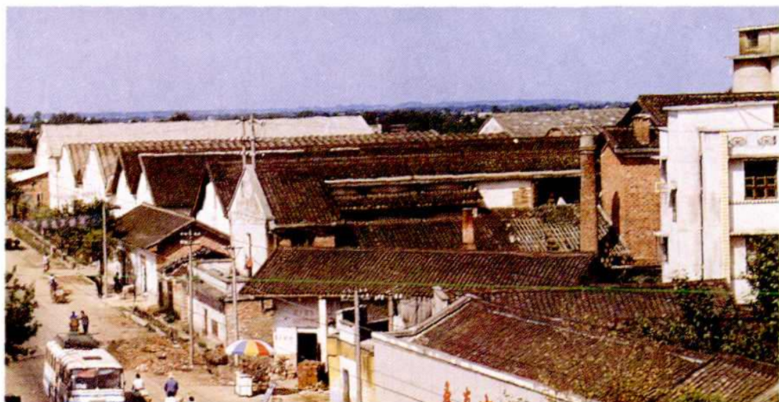
▲ 湘乡市一米厂、直属库