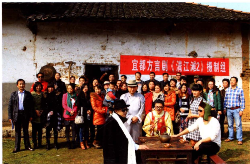
宜都方言剧《清江滩2》剧组合影