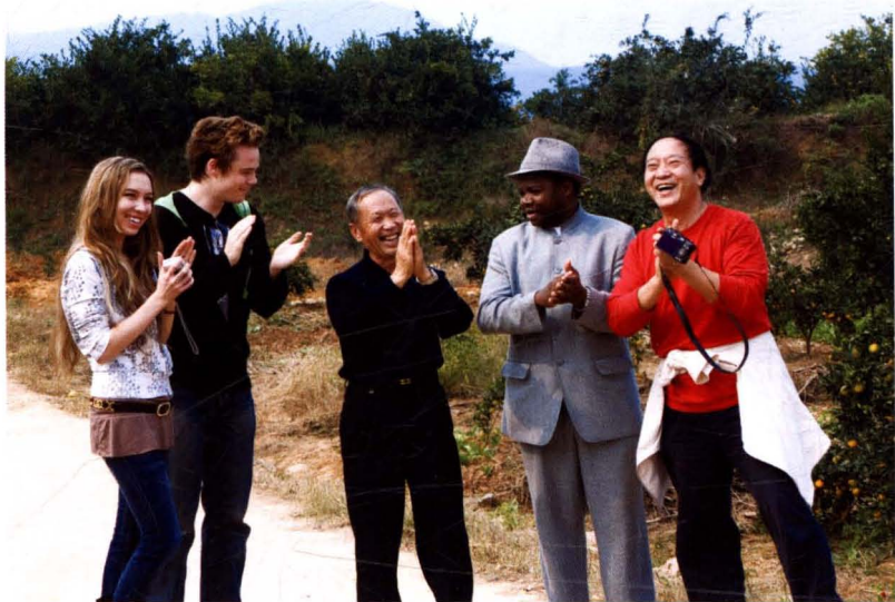
方言谜歌迷倒老外