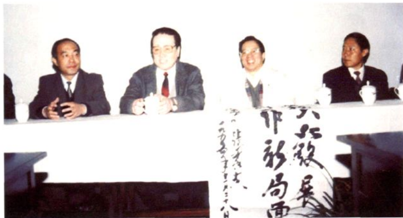
1995年11月28日司法部常务副部长张秀夫（左二）在省司法厅厅长曾宪章（右二）、市政府副市长张海波（右一）、市司法局局长赵伦（左一）陪同下考察乐山司法行政工作，欣然为市司法局题词“大服务、大发展、开创工作新局面”。