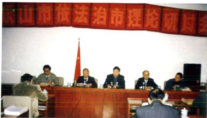
1999年10月乐山市召开依法治市理论研讨会。