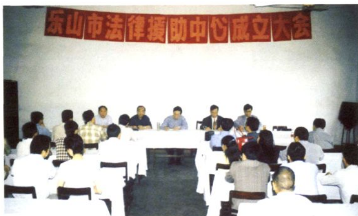
1999年8月乐山市法律援助中心成立，市委常委、市政府副市长何征修（中）出席成立大会并讲话。