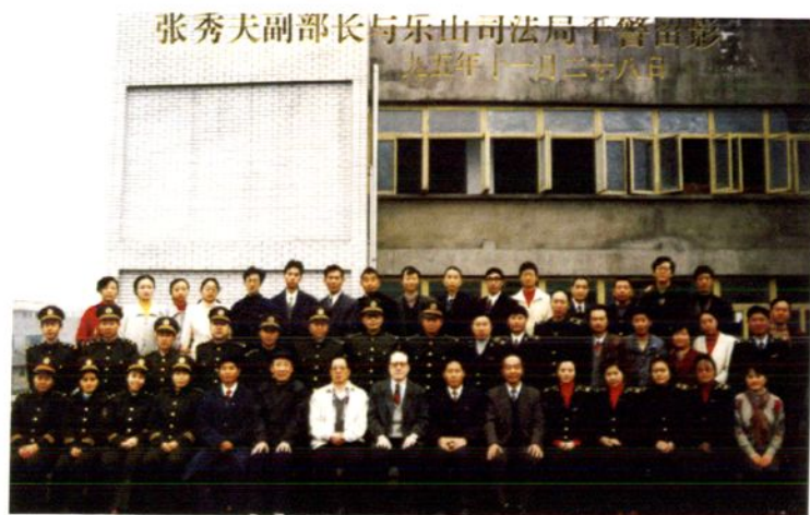
1995年11月司法部副部长张秀夫（左八）在省司法厅厅长曾宪章陪同下到乐山视察工作，11月28日同市司法局全体干警合影。