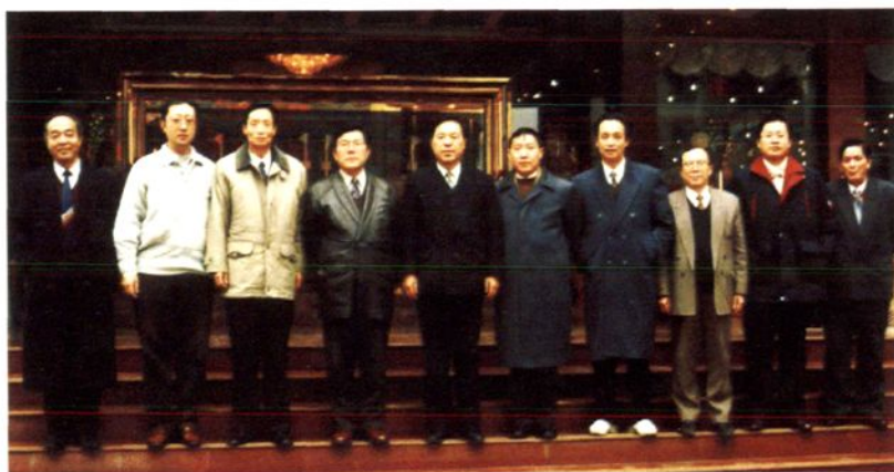
1996年12月司法部副部长张福森（左五）到乐山视察工作，市委副书记李吉荣（左四）、市委常委、政法委书记牟刚俊（右四）、副市长张海波（右五）陪同。