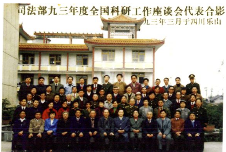
1993年3月司法部全国科研工作座谈会在乐山召开。