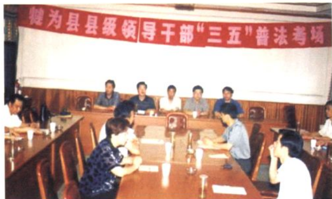
2000年8月犍为县组织县级干部进行“三五”普法考试。