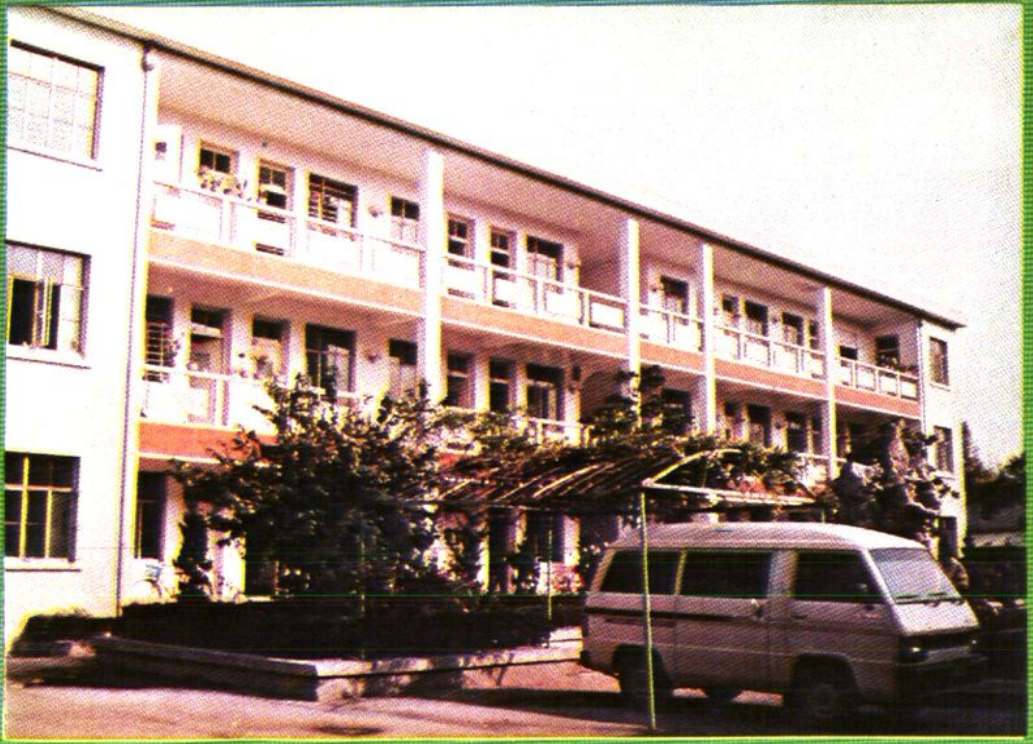
松江县供销合作联社办公大楼