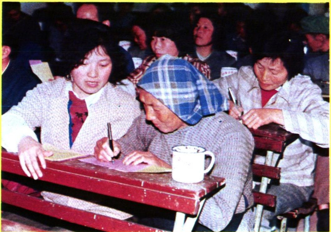
社员代表在社代会上认真选圈自己满意的理监事会组成人选