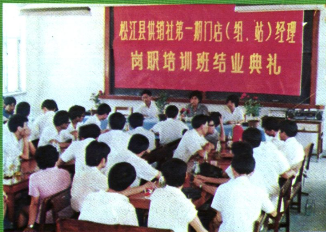
松江县供销社第一期门店(组、站)经理岗位培训班结业典礼