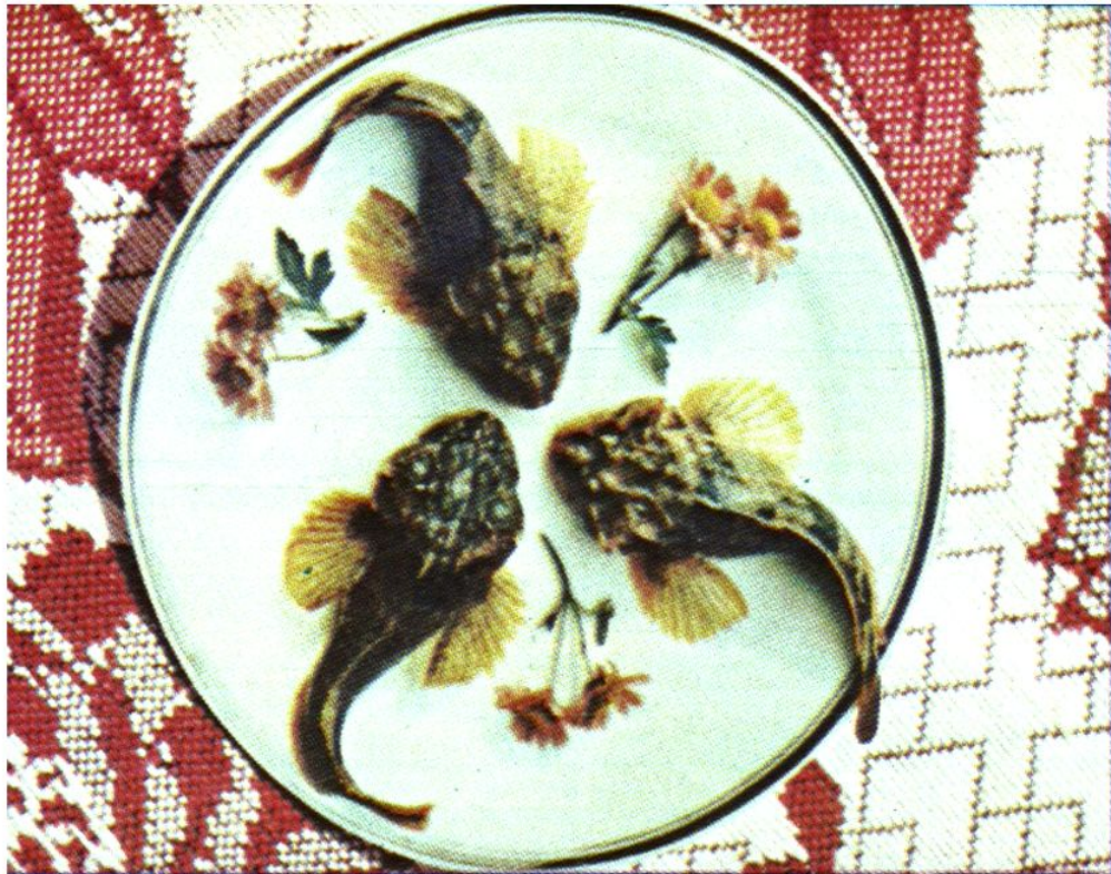
松江历史名产“四鳃鲈”鱼