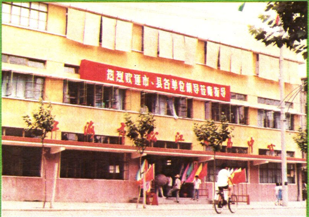
上海市松江贸易中心