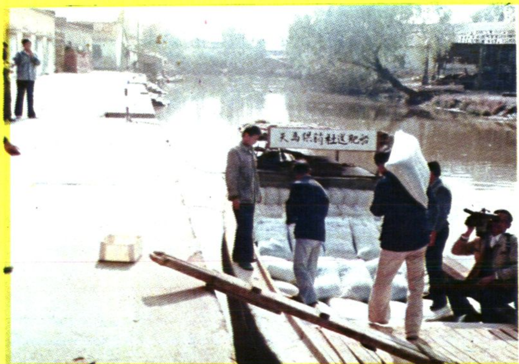
供销社将化肥送到农村，方便农民购买