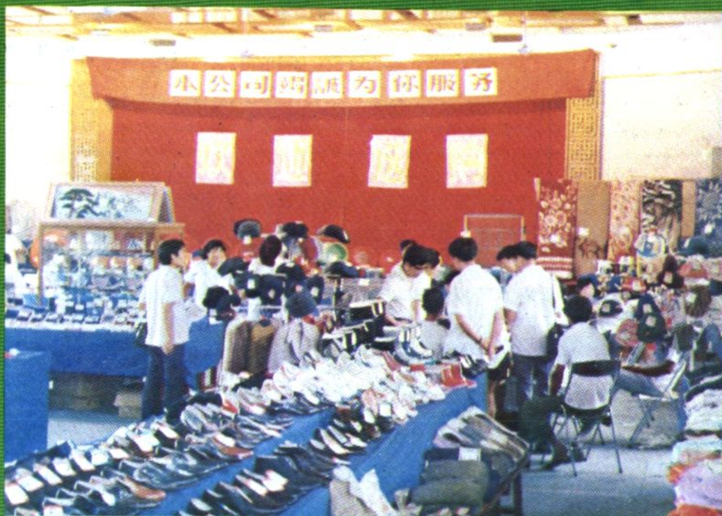
县百货公司举办县内外订货选购交流会