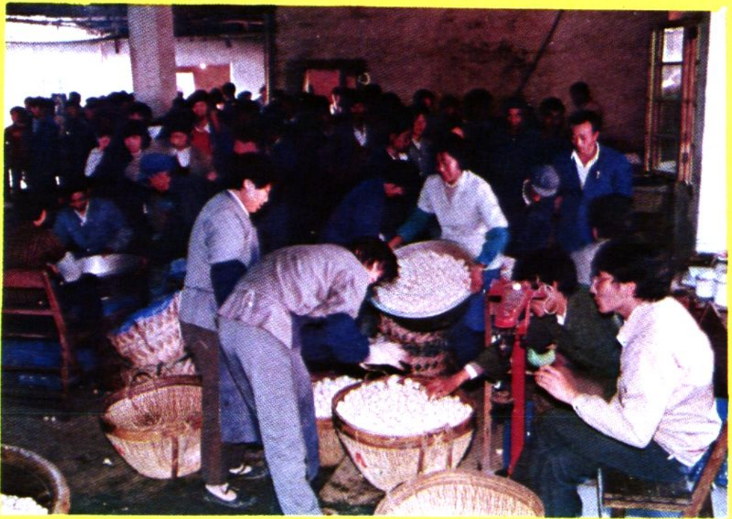
新浜供销社蘑菇收购站一派兴旺景象