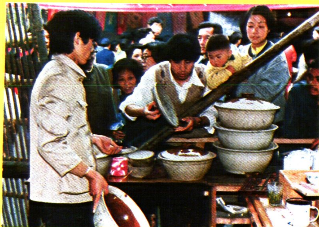
供销社送货下乡，设摊供应