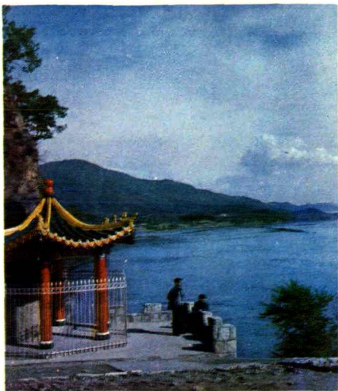
阿什哈达摩崖石刻亭