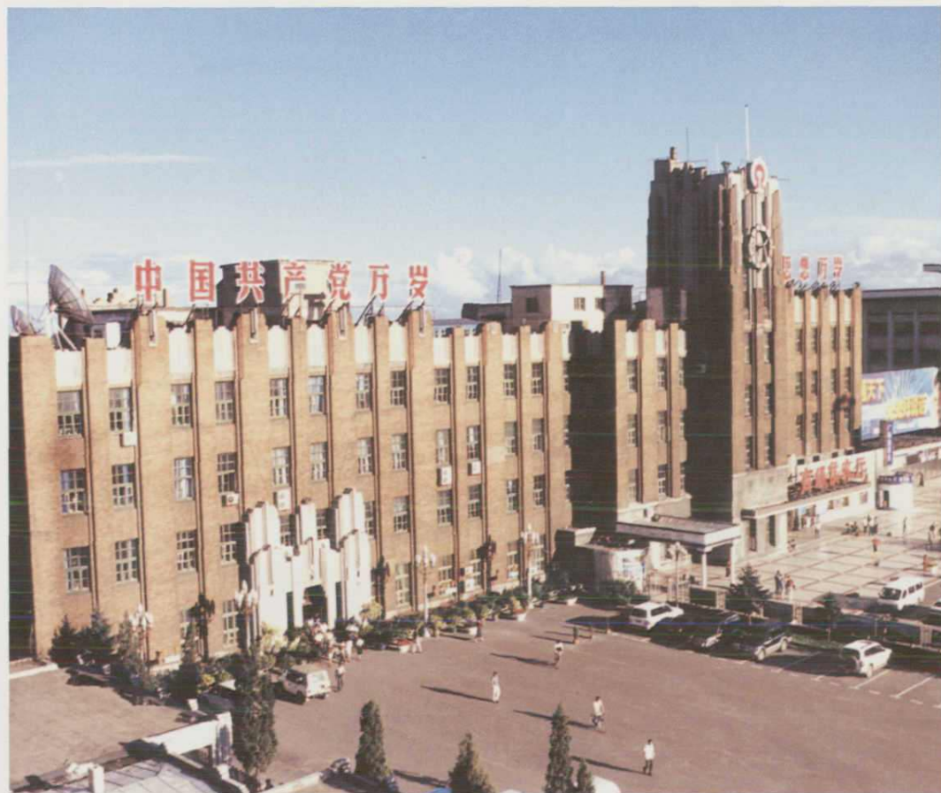
齐齐哈尔铁路分局办公楼