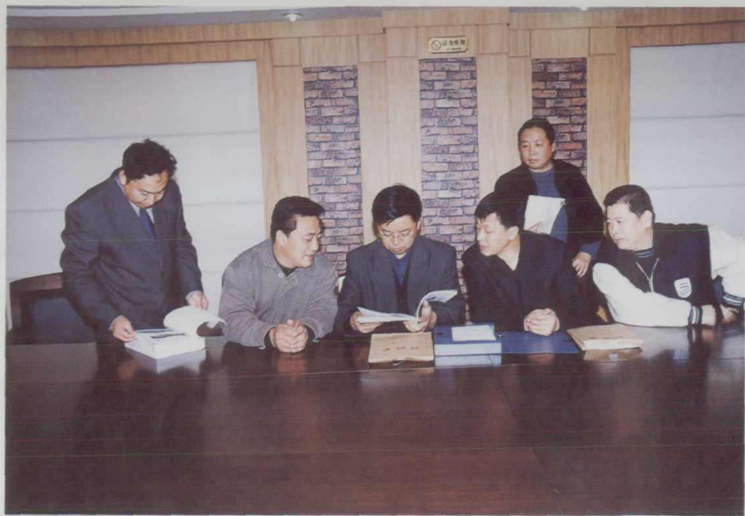
2002年4月4日《桥隧重点维修段志稿》通过分局终审