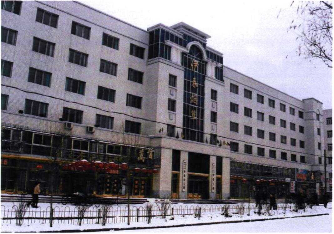
黑龙江省伊春市烟草专卖局（分公司）大楼