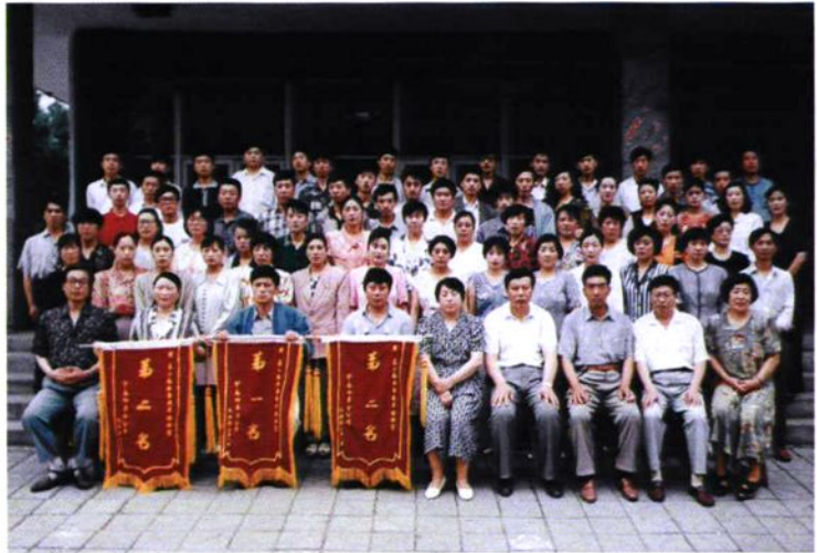
1995年伊春烟草分公司开展爱国主义教育和业务技术竞赛