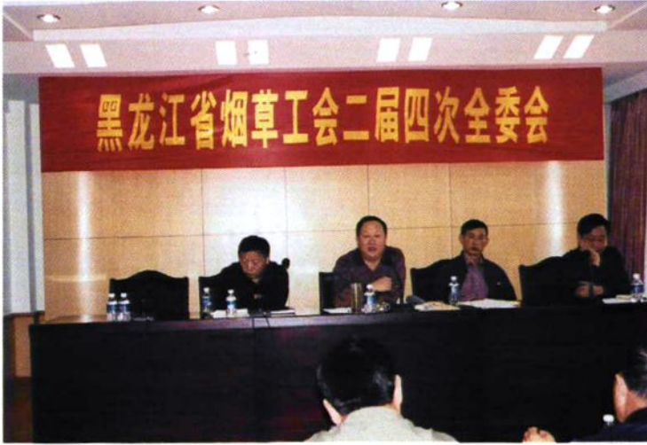
全省烟草工会二届四次全委会在伊春召开