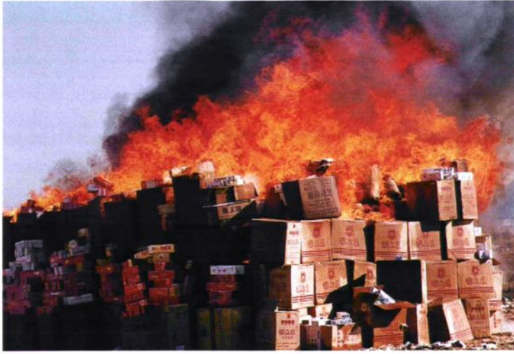
1999年3月15日300 多件假冒商标卷烟被销毁