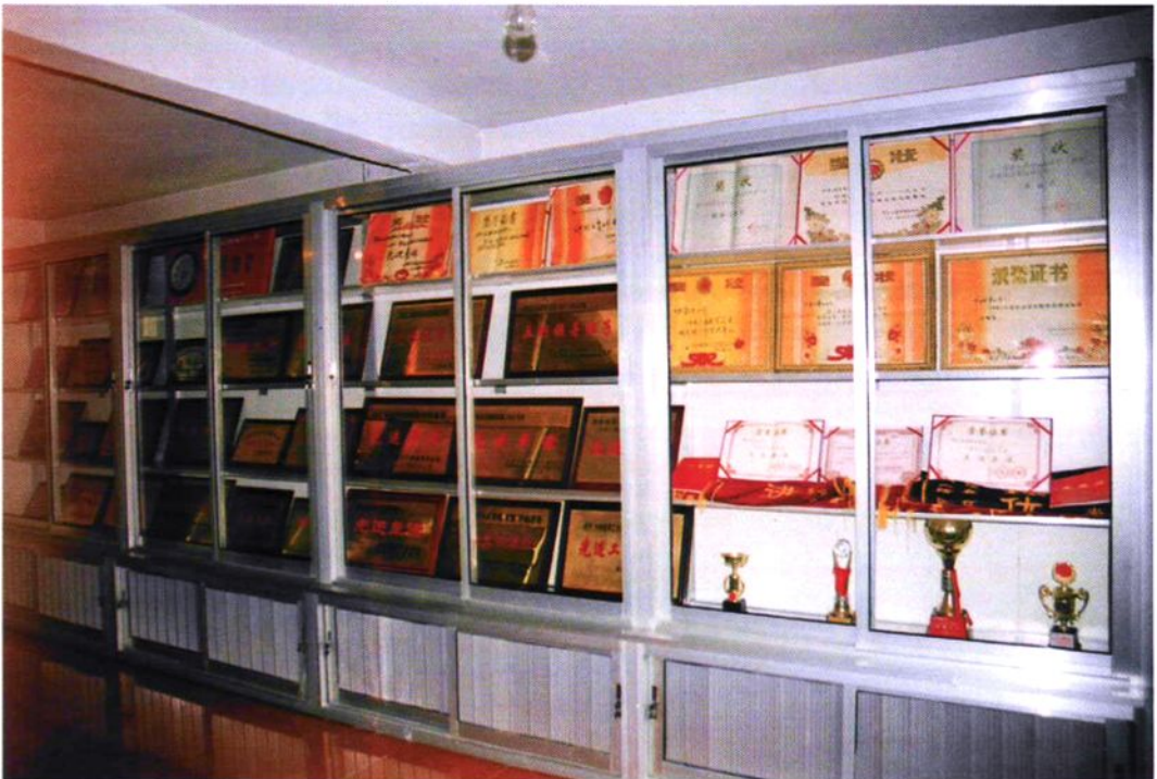
黑龙江省伊春市烟草专卖局（分公司）自组建以来取得了快速发展和令人瞩目的成就