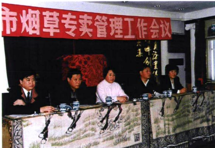
1996年伊春市烟草专卖局全市专卖管理工作会议会场