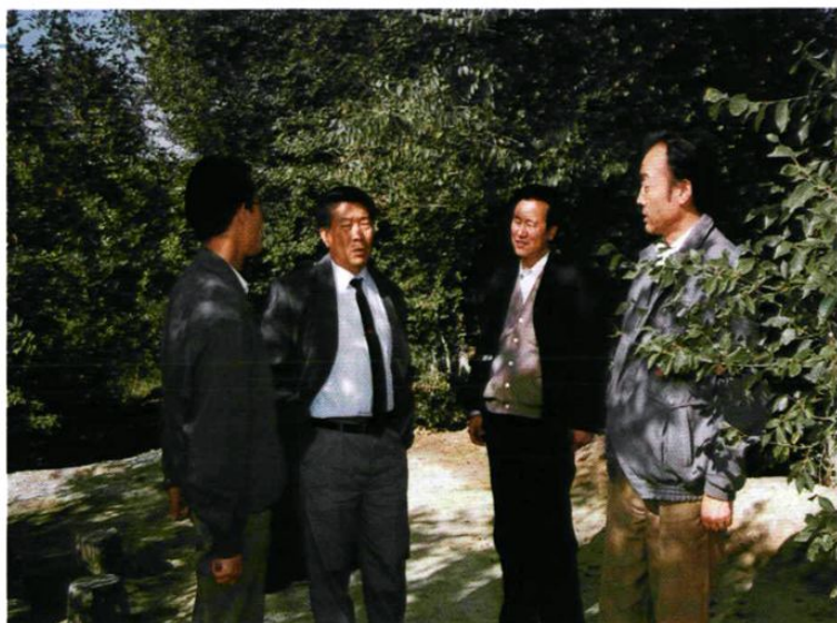
国家环保局自然保护司司长杨朝飞(左2)在市环保局局长胡曾颐(右1)等领导陪同下,考察乌鲁木齐市水磨沟区荒山绿化情况。