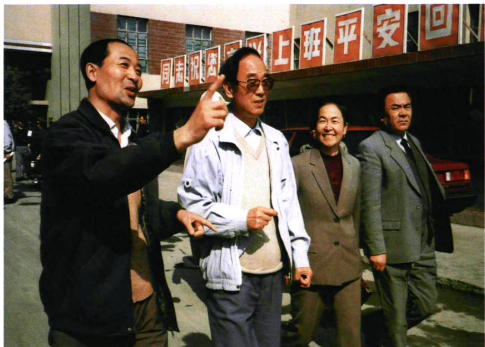
1992年9月11日国家环保局局长曲格平率全国城市卫生、环境综合整治检查团对乌鲁木齐市工作进行综合考评。图为曲格平局长(左2)在市委副书记买买提·沙来(右1)等领导陪同下,在新疆锂盐厂检查。