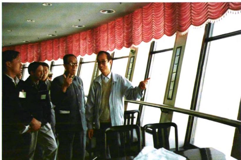
1992年9月12日国家环保局局长曲格平(右1),规划司司长王玉庆(左2)在环球大酒店顶楼旋转层视察乌鲁木齐市大气环境质量,与陪同的市环保局党组书记弓弦正(右2)交谈。

首府“蓝天工程”建设和环境空气质量变化始终得到市委、市政府的高度重视,并列为全市工作重中之重。图为自治区党委常委、市委书记杨刚(前排右1)、自治区党委常委、市长努尔·白克力(右2)和副市长郭依坤(右4)等领导在市环境监测中心站调研察看全市环境质量变化状况。