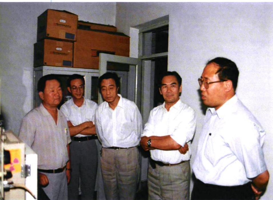
1995年8月29日国家环保局局长解振华率全国城市卫生、环境综合整治检查团对乌鲁木齐市工作进行检查。期间解振华局长(右1)在自治区环保局党组书记努尔·加合甫(右2)、局长安惠民(右3)、市委副书记、常务副市长张国文(左1)陪同下,到市环境监测中心站视察并看望环保干部职工。