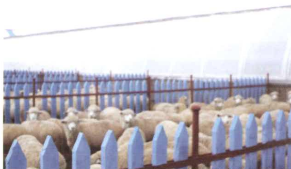
自培第一代中国美利奴羊群和现代化暖圈