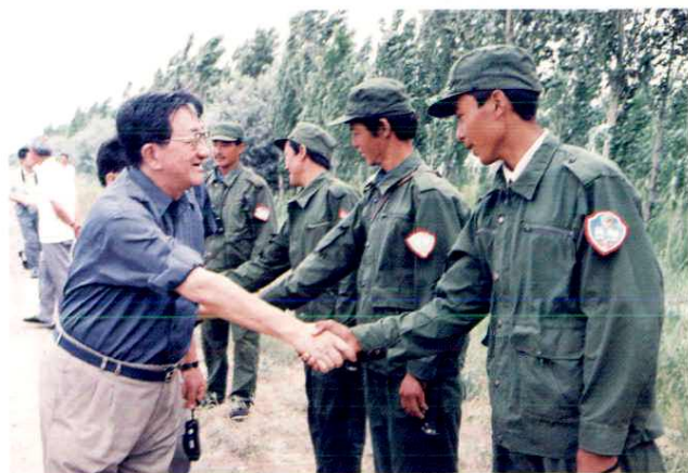
中国社会科学院教授赴团边防林看望守边民兵