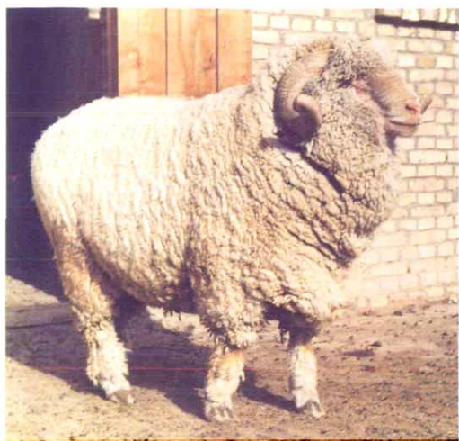
1990年引进澳大利亚美利奴种公羊 0193号