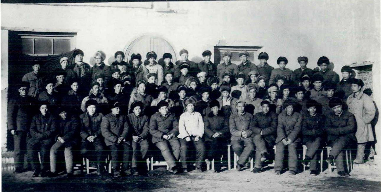
1962年伊塔边民外逃事件后,自治区党委决定组建边境农场,奉农四师令察布查尔第一农场从佛尔善西迁边境斐新哈萨组建农场,1963年元月实施搬迁时与察布查尔第二农场各级干部联欢留影。