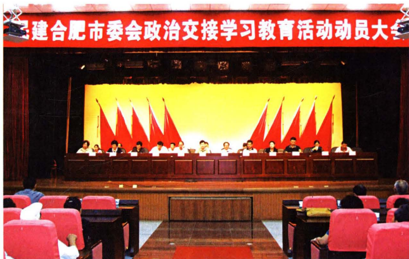
◀ 2007年9月24日,民建市委召开政治交接学习教育活动动员大会