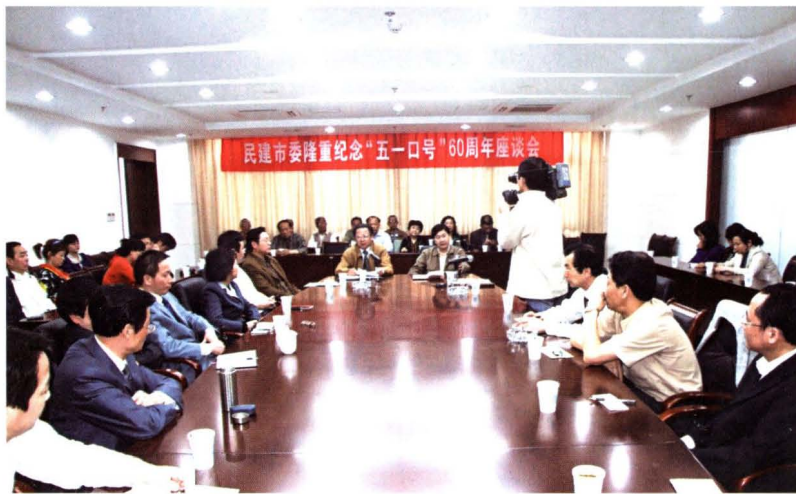
◀ 2008年4月29日,民建市委举行纪念“五一口号”60周年座谈会