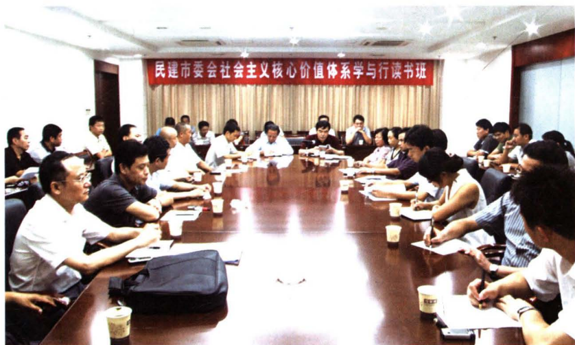
▶2010年9月9日,民建市委举办社会主义核心价值体系学与行读书班