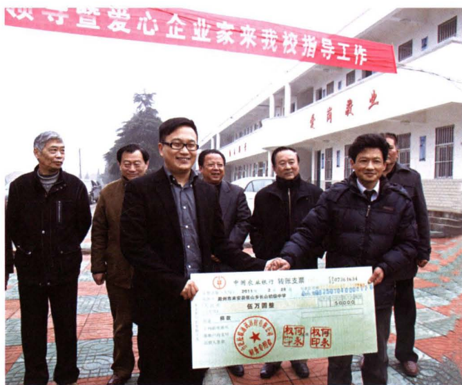
◀ 2011年2月28日,民建市委组织企业家会员向来安县长山中心学校捐资修建蓄水设施,解决师生饮用水困难