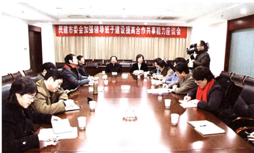
▶ 2010年1月8日，民建市委召开加强领导班子建设提高合作共事能力座谈会