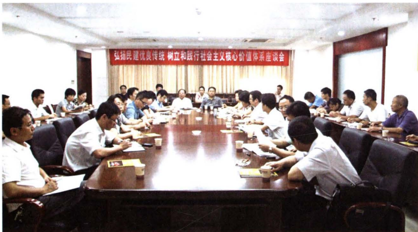
◀2010年7月23日,民建市委召开“弘扬民建优良传统 树立和践行社会主义核心价值体系”座谈会