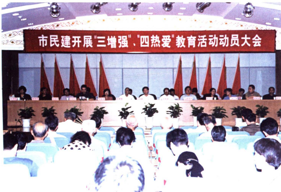
▲2003年7月29日,民建市委召开开展“三增强”、“四热爱”教育活动动员大会