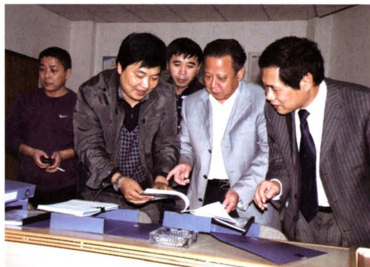
▲ 2011年11月,民建市委课题调研组调研合肥市大调解工作