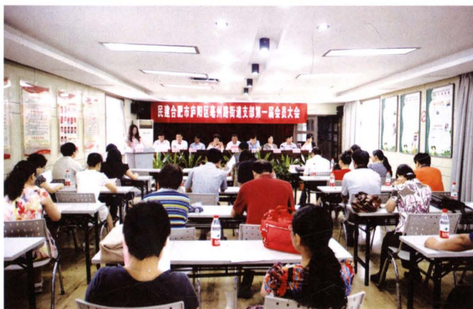
◀ 2011年7月16日，民建合肥市第一个街道支部庐阳区亳州路街道支部成立