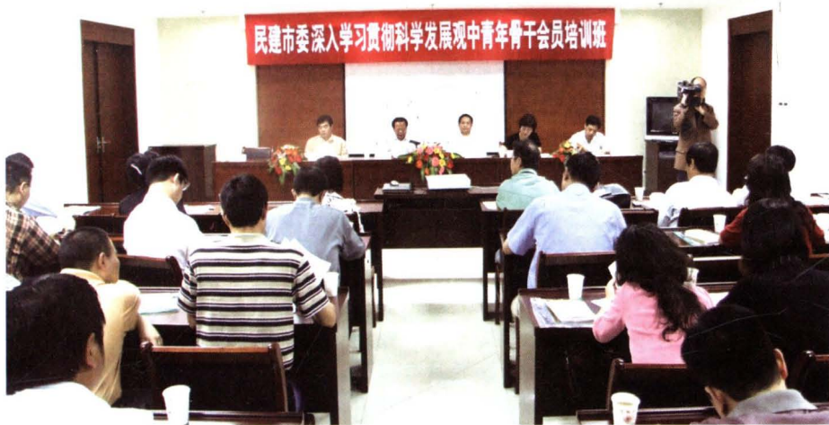
▲2009年5月20日，民建市委举办深入学习贯彻科学发展观中青年骨干会员培训班