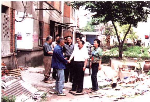
▲ 2004年,民建市委调研合肥市铁路二村危旧房改造,促成项目实施