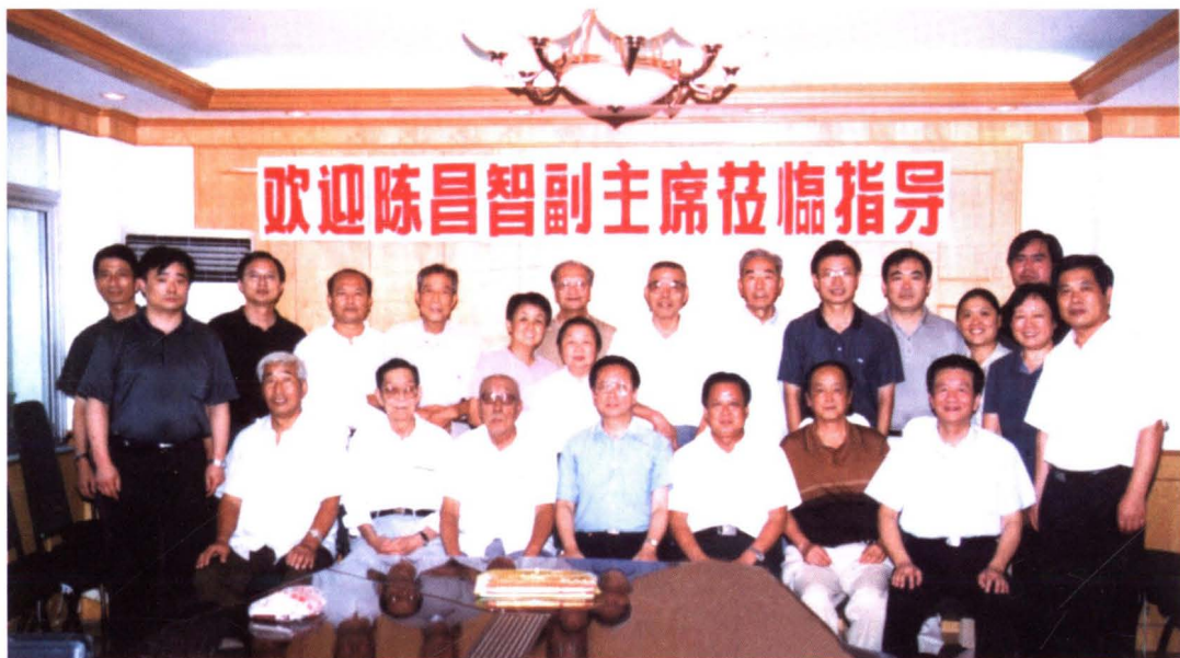
▲民建中央主席陈昌智(时任副主席)于2004年8月24日莅临民建合肥市委与会员座谈