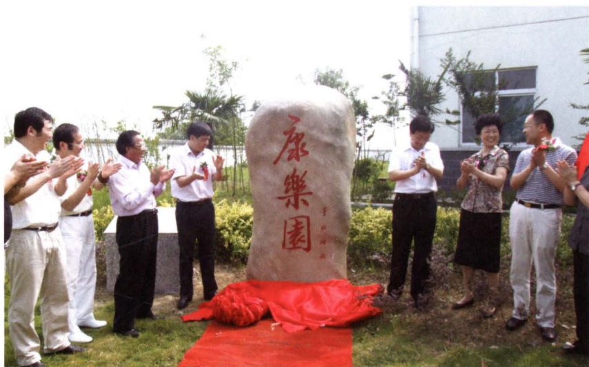
◀ 2010年6月29日,由民建企业家会员捐资援建的庐阳区三十岗敬老院“康乐园”落成