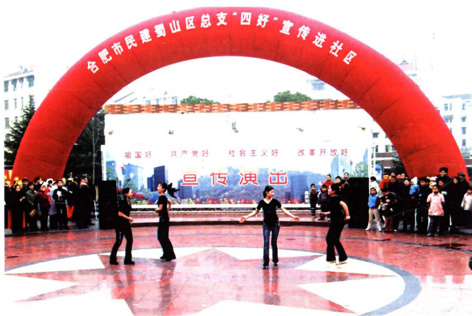
▲2004年12月19日,民建蜀山区总支在安居苑社区开展“四好”宣传进社区活动