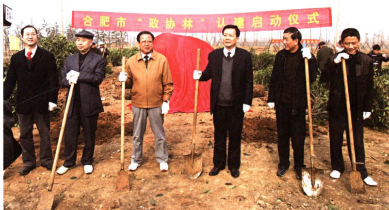
▶ 2010年3月18日,由合肥市政协和民建合肥市企业家联谊会共建的“政协林”启动仪式在大蜀山森林公园举行