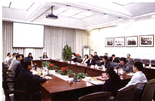
▲ 2011年11月3日，民建合肥市滨湖新区直属支部成立