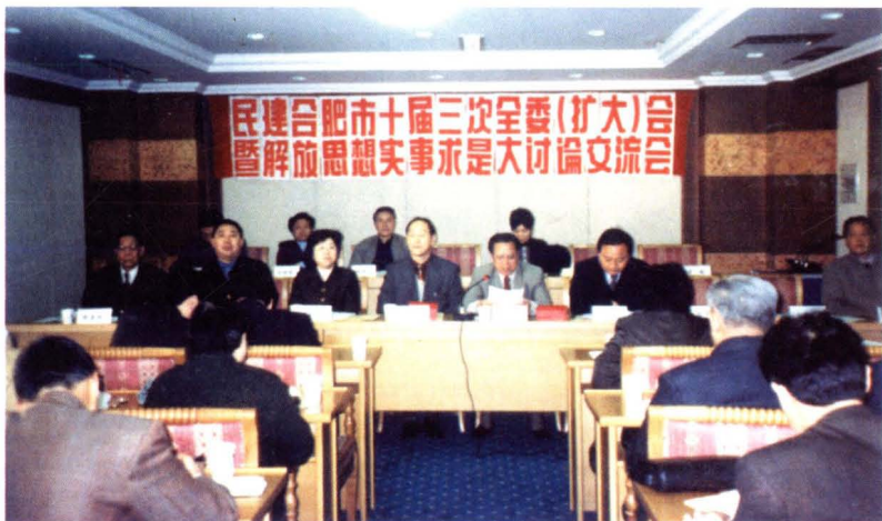
▶2002年3月19日，民建市委举行十届三次全委(扩大)会议暨解放思想实事求是大讨论交流会