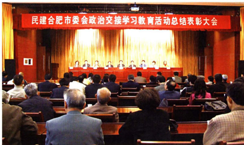
◀ 2009年4月17日,民建市委召开政治交接学习教育活动总结表彰大会