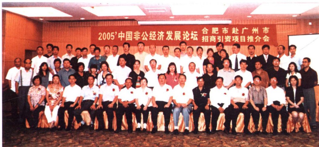
▲ 2005'中国非公经济发展论坛在合肥举办,民建市委以“论坛”为契机,于当年9月联系组织了合肥市赴广州招商引资项目推介会