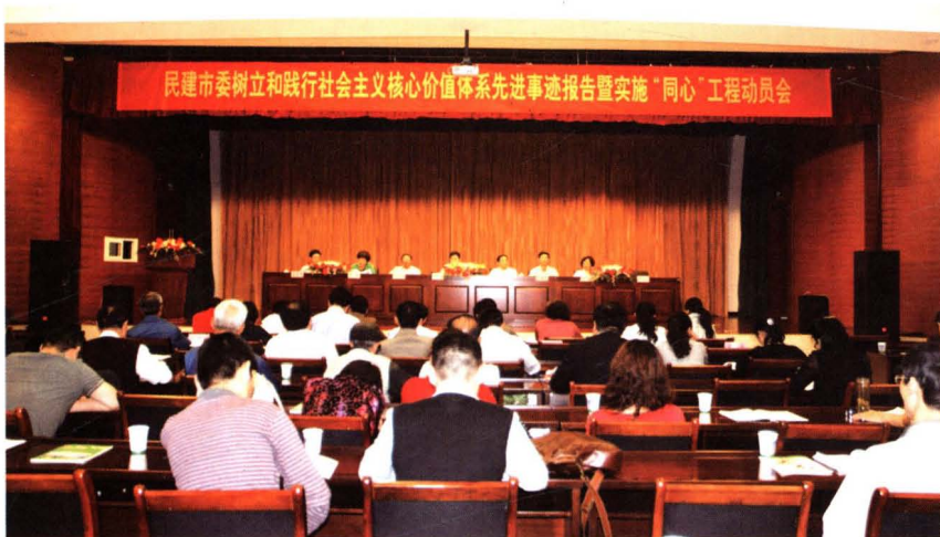
◀2011年5月11日,民建市委召开树立和践行社会主义核心价值体系先进事迹报告暨实施“同心”工程动员会