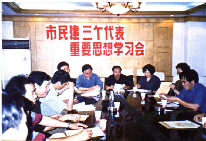
◀2003年7月3日，民建市委召开十届八次全委(扩大)会，学习“三个代表”重要思想