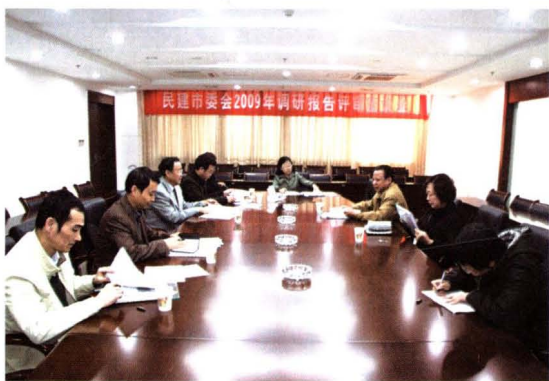
▲ 调研成果专家评审会