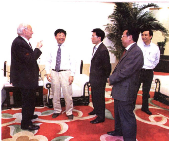
◀ 2007年10月11日,应民建市委邀请,前联合国副秘书长莫里斯·斯特朗一行来肥考察垃圾发电项目。图为中共安徽省委常委、合肥市委书记孙金龙(左二)会见莫里斯·斯特朗(左一),市政协副主席、民建市委主委王世清陪同会见