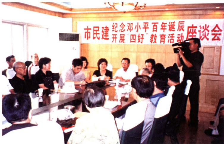
◀2004年8月19日，民建市委召开纪念邓小平诞辰100周年暨开展“四好”教育活动座谈会