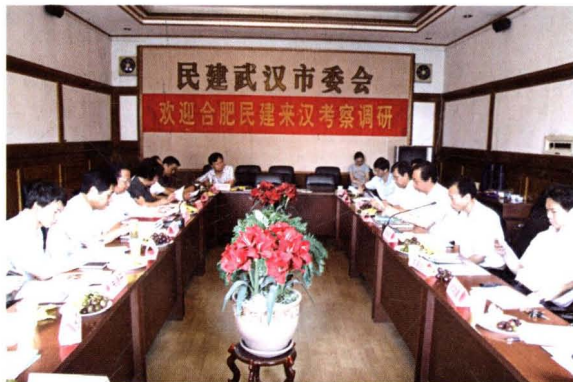
▲ 2009年8月,民建市委课题调研组赴武汉调研农村土地承包经营权流转