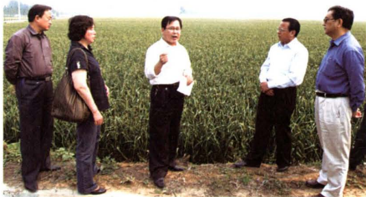
▲ 2008年5月,民建市委课题调研组赴济南调研蔬菜产业发展