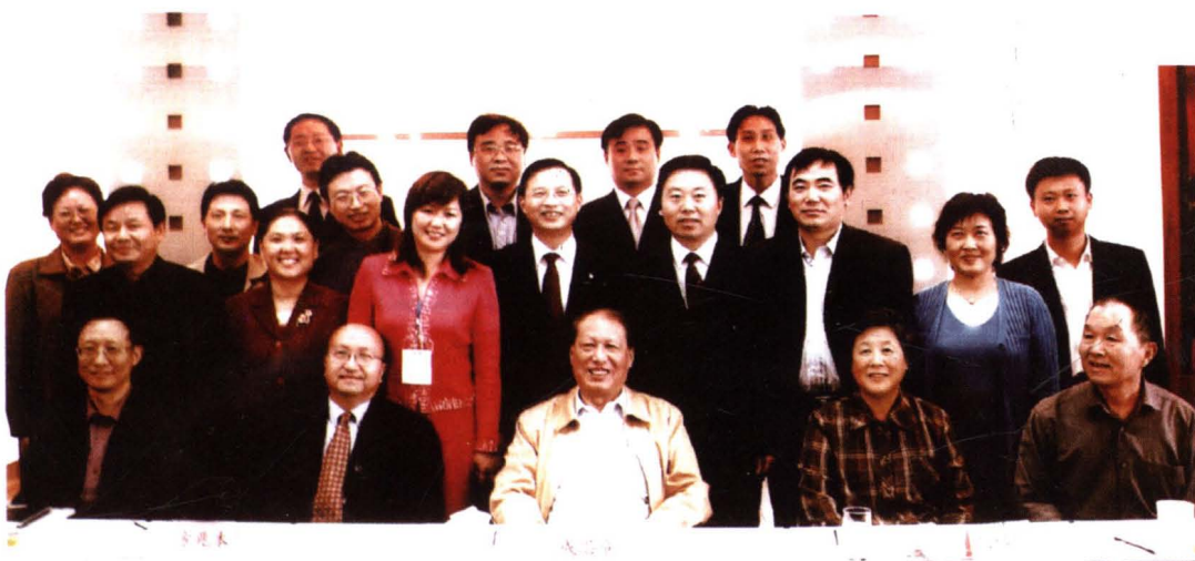
▲2005年10月11日,民建中央主席成思危、副主席张榕明等领导与参加2005'中国非公有制经济发展论坛的合肥市民建会员合影