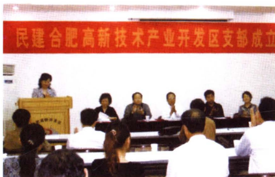
▲ 2007年10月18日，民建合肥市高新区直属支部成立