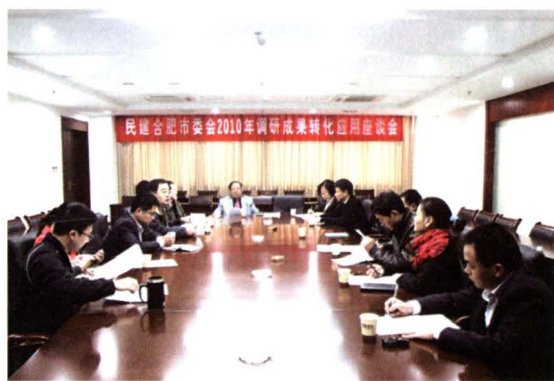
▲ 调研成果转化应用座谈会