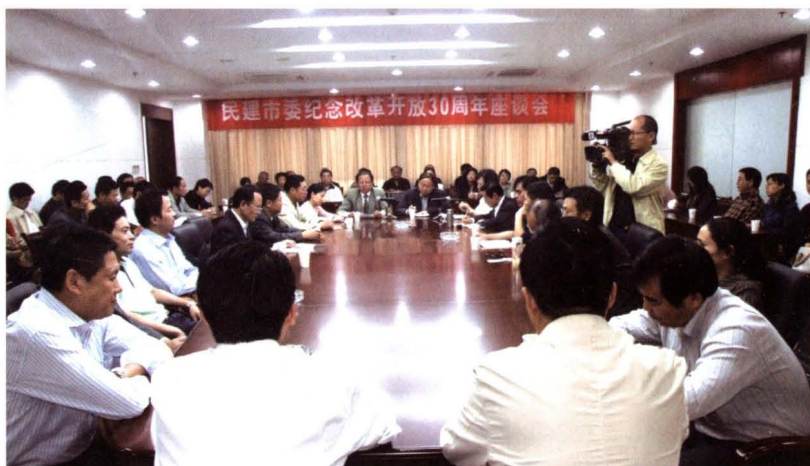
▶ 2008年10月9日,民建市委召开纪念改革开放30周年座谈会