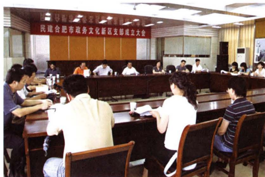
▲ 2009年7月29日，民建合肥市政务文化新区直属支部成立