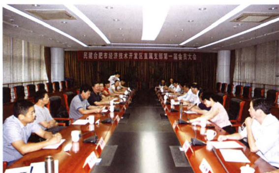
▲ 2011年7月15日，民建合肥市经济技术开发区直属支部成立