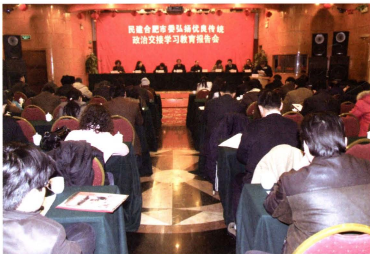
▶ 2008年2月3日,民建市委召开弘扬优良传统政治交接学习教育报告会