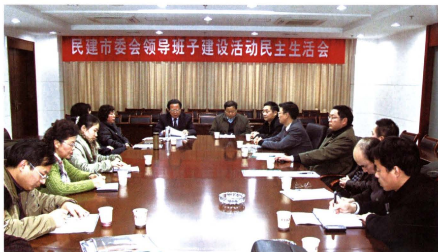
◀ 2010年2月4日，民建市委召开领导班子建设活动民主生活会