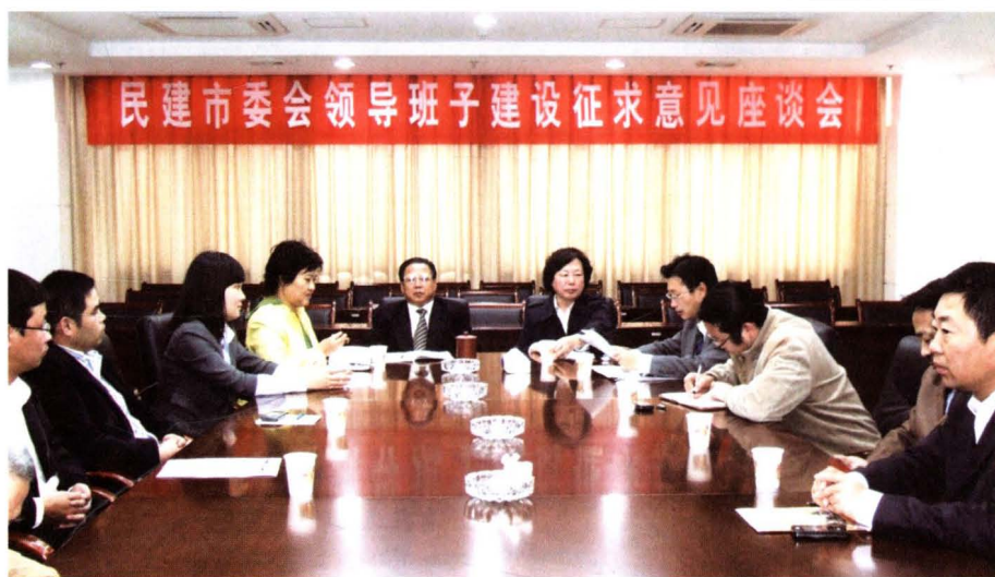
◀ 2009年11月6日，民建市委召开领导班子建设征求意见座谈会