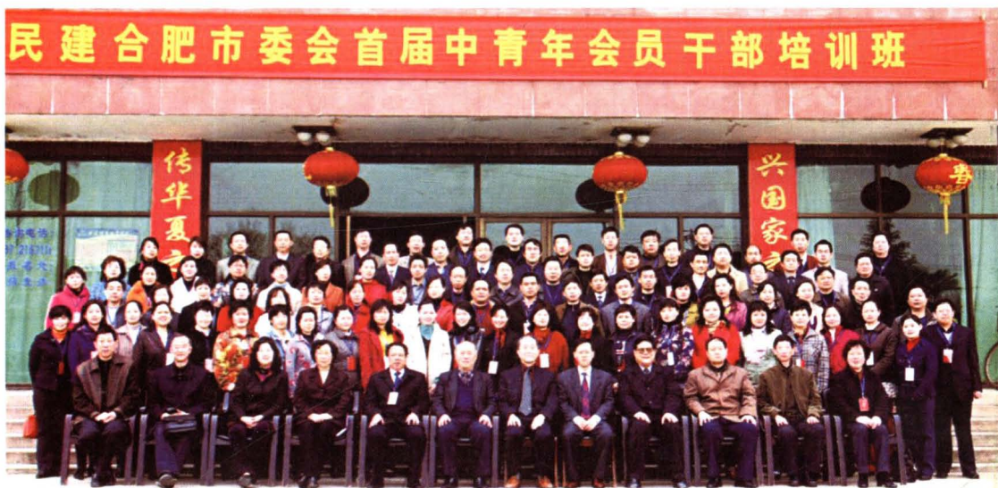
▲2007年3月，民建市委在市社会主义学院举办首届中青年会员干部培训班,图为培训班学员合影