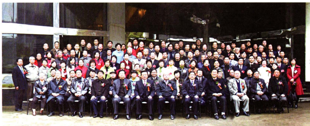
▲ 民建合肥市第十一次代表大会合影