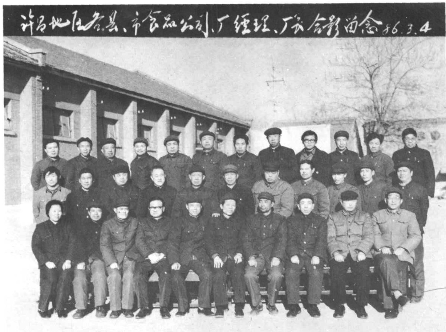
图5 原地区公司1986年区划调整时最后一次各县、市公司、厂，经理、厂长会合影