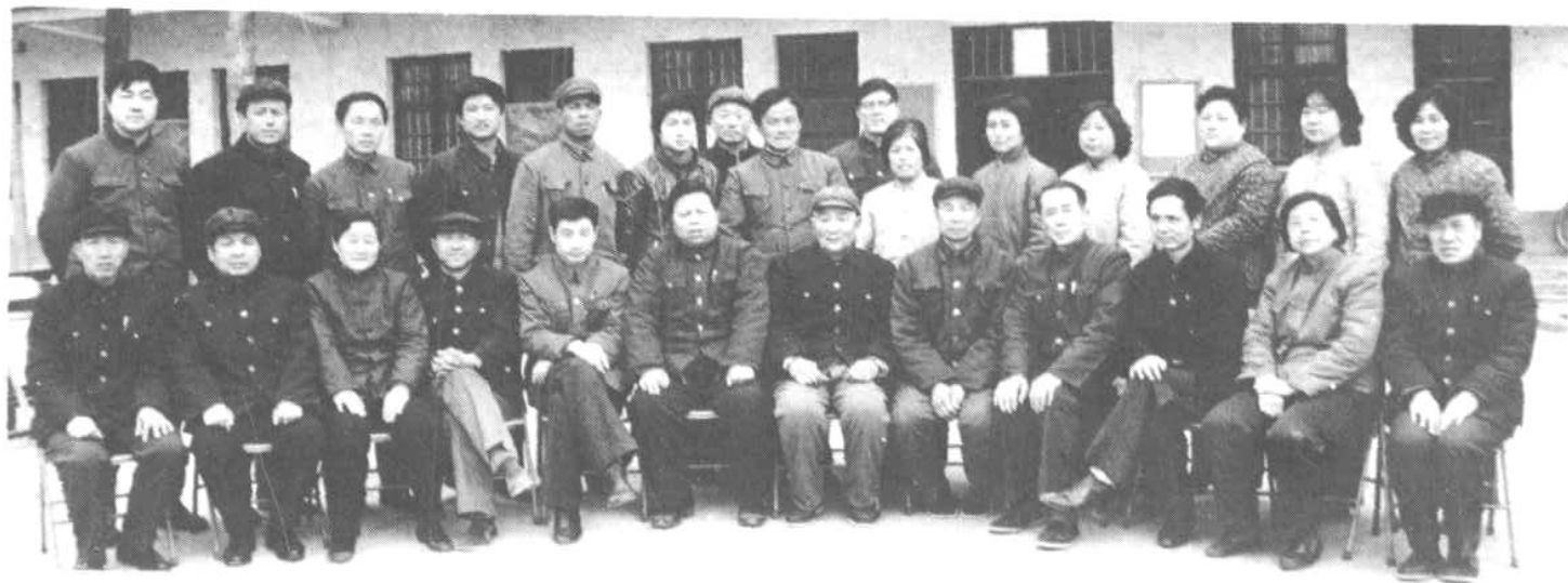
图 6 原市公司 1986 年区划调整时公司全体人员合影