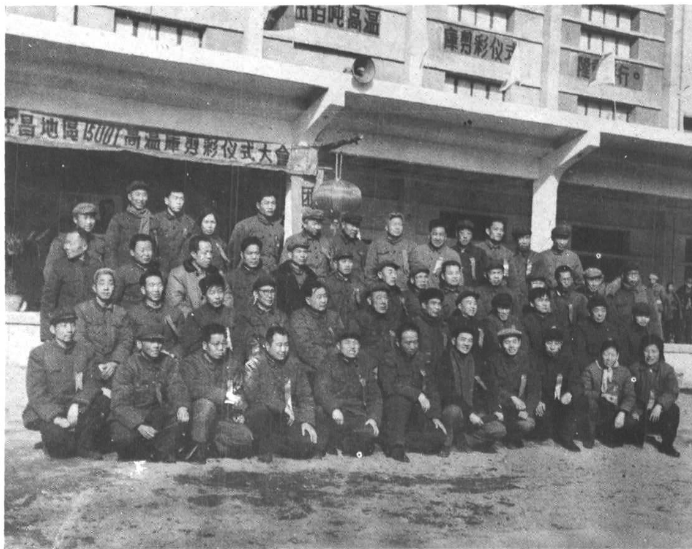
9 图9 1979年12月26日原地区公司新建1500T高温蛋库投产剪彩仪式会合影。