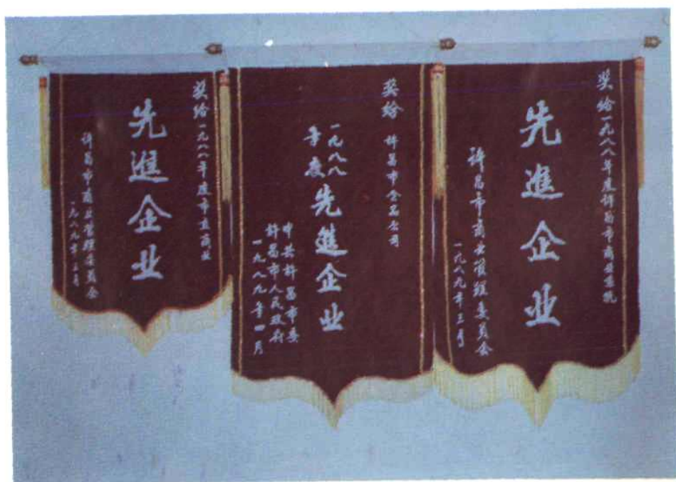
图 2 1988年本公司所获荣誉