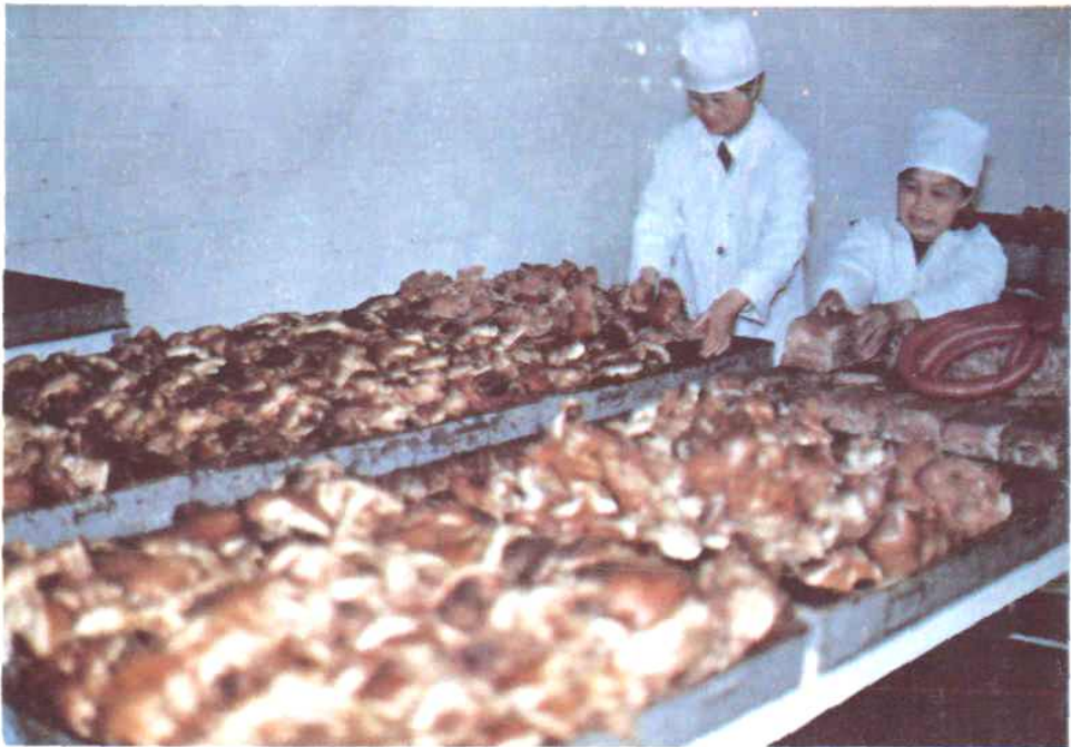
▽ 图14 熟肉制品厂部分产品。