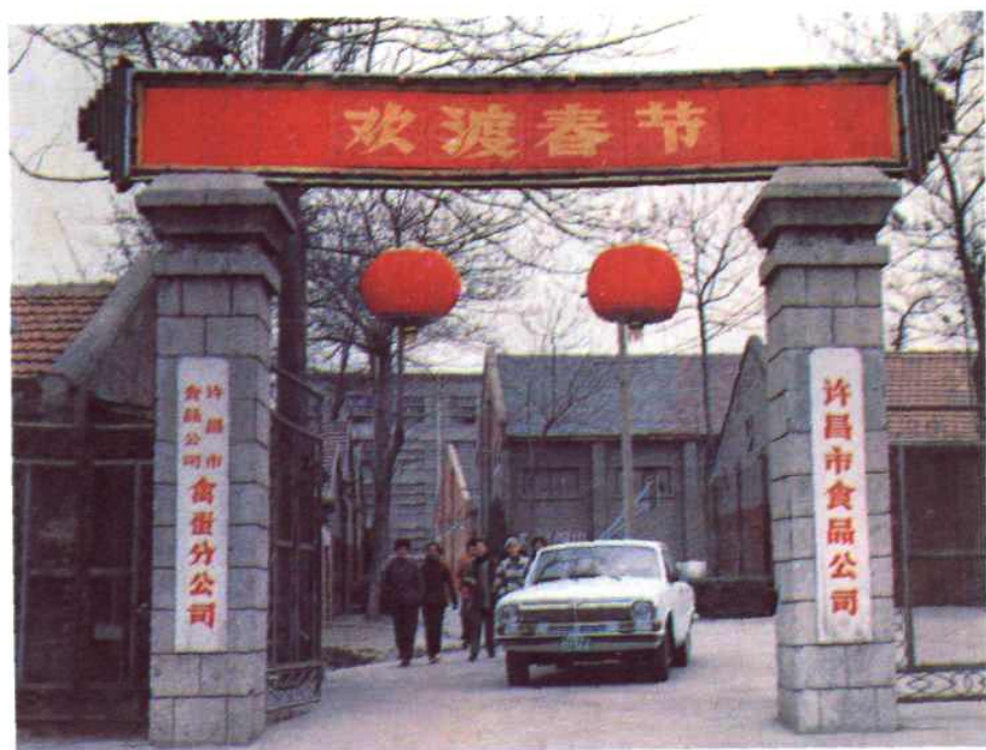
图7 公司与禽蛋分公司（即禽蛋厂）大门照。