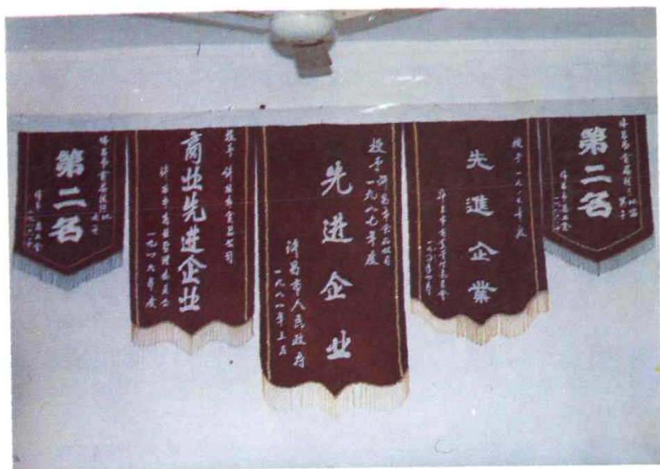
图 1 1987年本公司所获荣誉