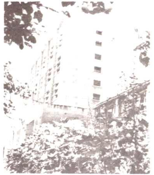
图13 1500T 高温蛋库外景。