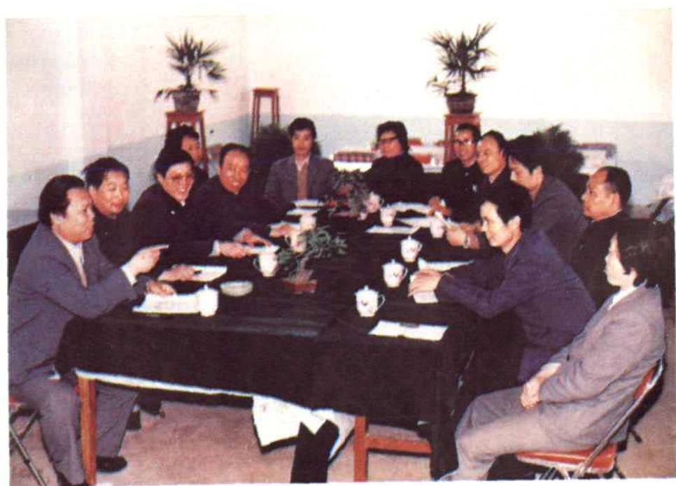
图8 1988年公司党、政、工及部分部、室领导同志在研究工作。